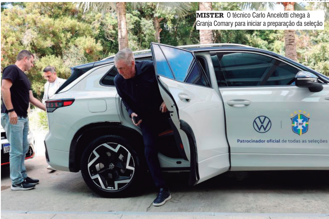
MISTER O técnico Carlo Ancelotti chega à Granja Comary para iniciar a preparação da seleção

jogadores sem contratemplos, a CBF montou uma operação logística especial. Helicópteros foram fretados para o transporte entre o Rio de Janeiro e Teresópolis, evitando atrasos causados