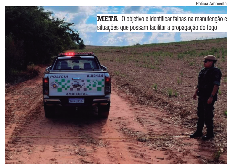
META O objetivo é identificar falhas na manutenção e situações que possam facilitar a propagação do fogo

A operação segue até hoje e concentra esforços em áreas consideradas mais vulneráveis durante o período de estiagem. As equipes intensificarão o monitoramento e as vistorias em aceiros, margens de rodovias e ferrovias, estradas rurais, unidades de conservação ambiental e canaviais