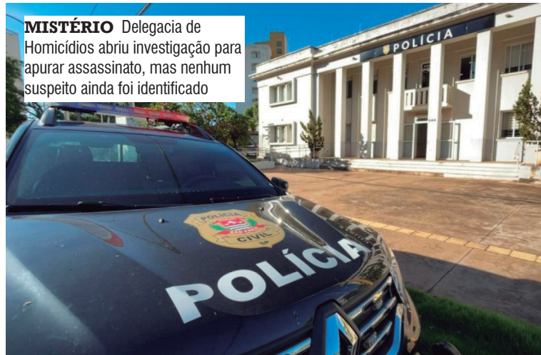
MISTÉRIO Delegacia de Homicídios abriu investigação para apurar assassinato, mas nenhum suspeito ainda foi identificado

O corpo foi encaminhado ao IML (Instituto Médico Legal) e passou por exames necroscópico e toxicológico. Até então, o ho-