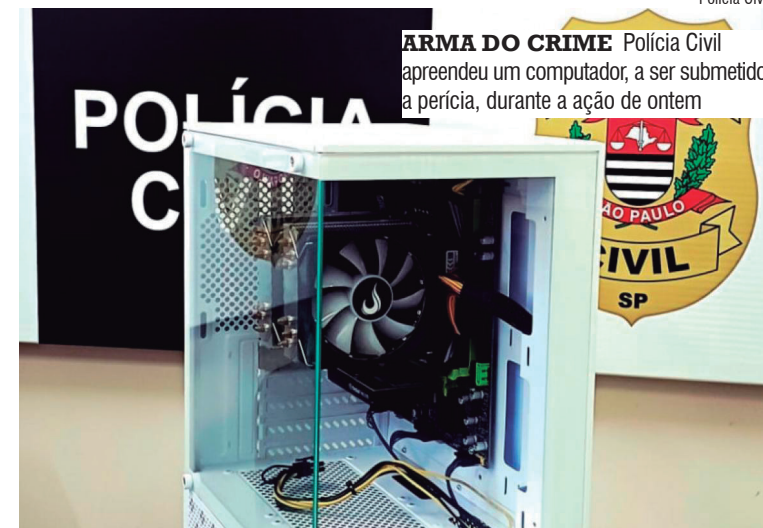
ARMADO DO CRIME Polícia Civil apreendeu um computador, a ser submetido a perícia, durante a ação de ontem

A investigação começou a partir de um relatório da Unidade Especializada da Polícia Civil de São Paulo, que identificou a disponibilização pública na internet de plani-