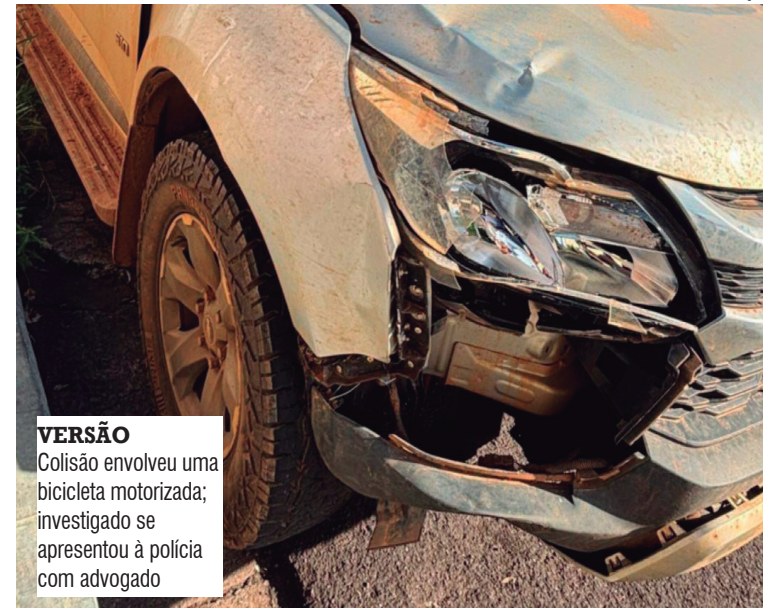
VERSÃO Colisão envolveu uma bicicleta motorizada; investigado se apresentou à polícia com advogado

Os policiais conseguiram identificar a caminhonete envolvida e localizar o proprie-