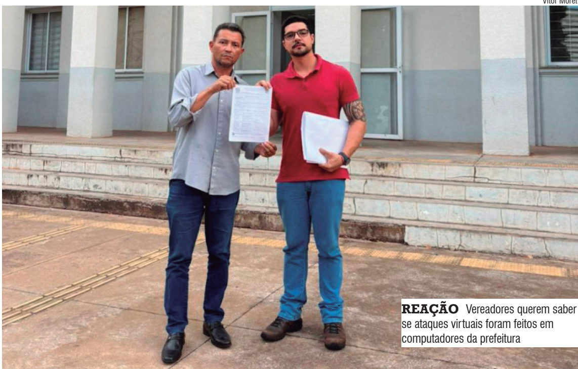
REAÇÃO Vereadores querem saber se ataques virtuais foram feitos em computadores da prefeitura