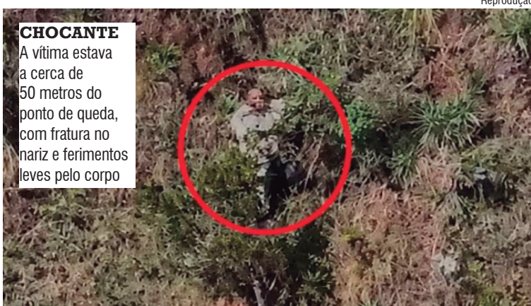
CHOCANTE A vítima estava a cerca de 50 metros do ponto de queda, com fratura no nariz e ferimentos leves pelo corpo

Segundo a Polícia Militar e o Corpo de Bombeiros, ela sobreviveu agarrada a um arbusto em uma área de difícil acesso do Parque Estadual da Serra do Rola Moça. A operação de resgate mobilizou 20 militares e uma aeronave Arcaño. A vítima estava a cerca de 50 metros do ponto de queda, com fratura no nariz e ferimentos leves pelo corpo.