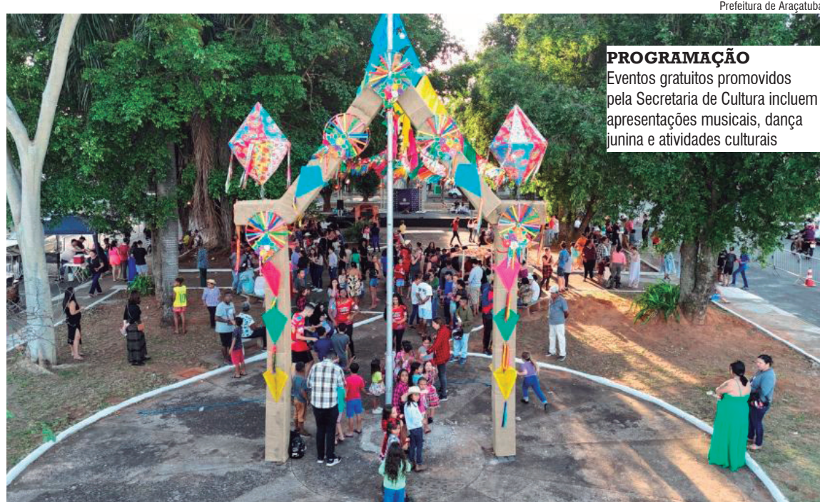
PROGRAMAÇÃO Eventos gratuitos promovidos pela Secretaria de Cultura incluem apresentações musicais, dança junina e atividades culturais

Já no Centro Comunitário Nossa Senhora Aparecida, na