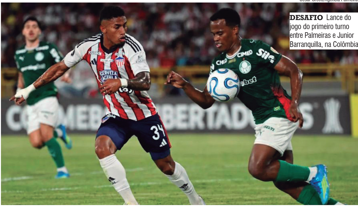
DESAFIO Lance do jogo do primeiro turno entre Palmeiras e Junior Barranquilla, na Colômbia

À parte a Libertadores, o Palmeiras também vem muito bem na temporada. O Verdão lidera o Campeonato Brasileiro, com 38 pontos — sete a mais que o Flamengo, segundo colocado. Além disso, a equipe de Abel Ferreira