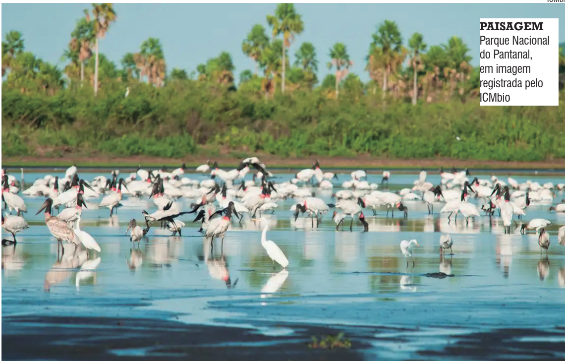
PAISAGEM Parque Nacional do Pantanal, em imagem registrada pelo ICMBio

O MapBiomias alerta que, apesar da redução no desmatamento no ano passado, a área desmatada no Brasil chegou à média de 2.698 hectares por dia,