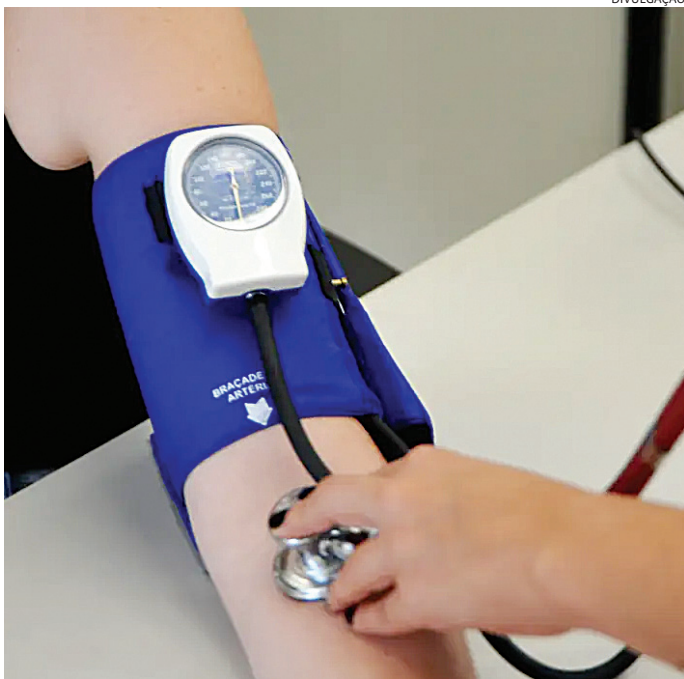
O uso de testosterona para mulheres tem riscos, inclusive de infarto

rações de outros exames laboratoriais, como os de colesterol e triglicerídeos.” A nota ainda ressalta que a Anvisa não aprovou nenhuma formulação de testosterona para uso em mulheres e que a agência reguladora também não reconhece “uso de testosterona para fins estéticos, de melhora de composição corporal, desempenho físico, disposição ou antienvhecimento.”