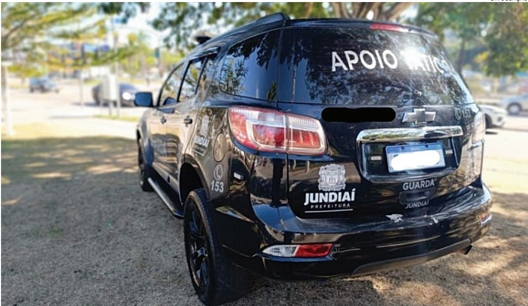
A equipe percebeu o desespero da família e agiu a fim de capturar o suspeito

A adolescente estava com a mãe e a avó e a mãe estaria recebendo ameaças de morte do ex-marido. Segundo relato da mesma, as ameaças estavam constantes e ela chegou a receber, somente neste dia, mais de 80 ligações e incontáveis mensagens de ameaças de morte. A vítima também relatou que, na mesma semana, o indivíduo teria acessa-