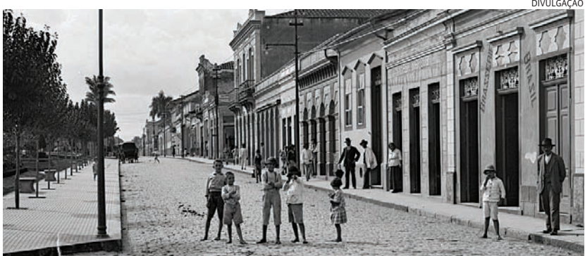
Jundiaí era uma cidade pacata até a chegada das grandes ferrovias

nais”. Já em 1700, o Brasil era colônia de Portugal e o estado de São Paulo tinha 16 municípios e lá estava Jundiaí. Expansão veio com a chegada das ferrovias. Cidades 5