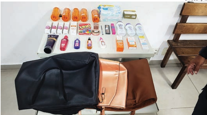
GMs encontraram produtos avaliados em R$ 1,5 mil

No veículo, estavam a grávida, de nove meses, e uma amiga. A irmã da proprietá-