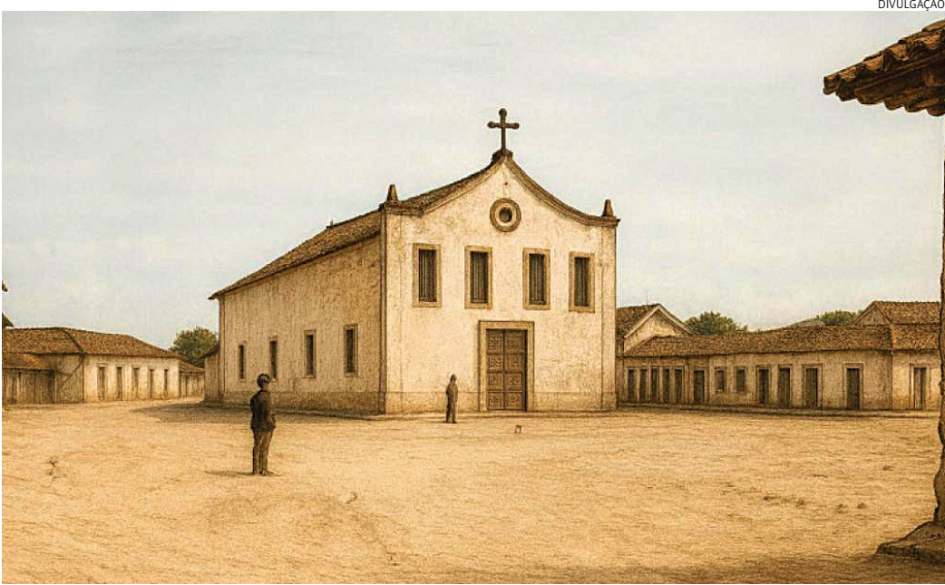
Primeira imagem registrando a Vila de Nossa Senhora do Desterro de Jundiahy

Jundiaí foi elevada à categoria de vila 14 de dezembro de 1655. Com isso, tornou-se uma das nove primeiras cidades do estado de São Paulo, chamadas de “cidades originais”. Já em 1700, o Brasil era colônia de Portugal e o estado de São Paulo tinha 16 municípios. Lá estava Jundiaí, junto a São Paulo, Paranaíba, Santos, São Vicente, São Sebastião, Sorocaba, Itu, Mogi das Cruzes, Jacareí, Taubaté, Guaratinguetá, Ubatuba, Itanhaém, Iguape e Cananéia. Na época, não existiam grandes cidades do interior, como Campinas e Ribeirão Preto. Inclusive, essas duas cidades pertenciam ao território jundiaense, que fazia divisa com Itu a Oeste, Paranaíba a Sul, São Paulo a Sudeste e Minas Gerais a Nordeste e Norte. Até 1800, muita coisa mudou no âmbito nacional e Jundiaí já tinha tido desmembramentos, Campinas era uma cidade emancipada, assim como Mogi-Mirim. No entanto, toda a região mais próxima pertencia ao território jundiaense. A configuração atual só foi delineada na segunda metade do século XX, quando os últimos mu-