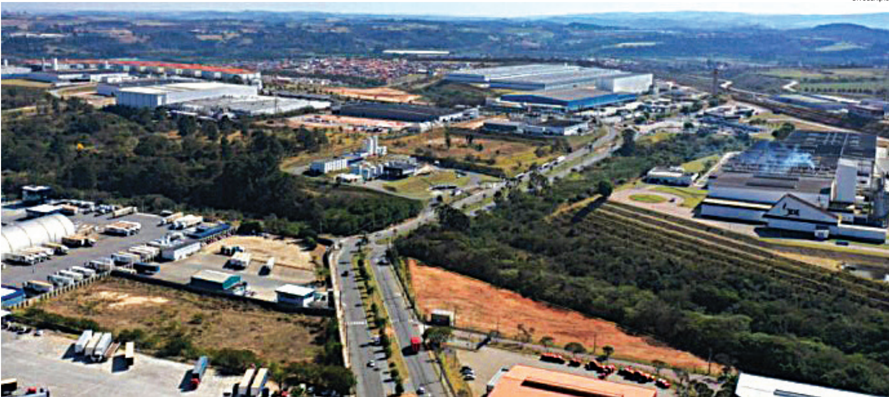
Jundiaí tem se destacado na abertura de novos negócios de serviços e comércio