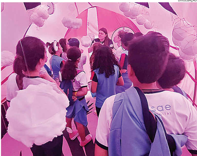
FMJ traz oportunidade para estudantes conhecerem o corpo humano