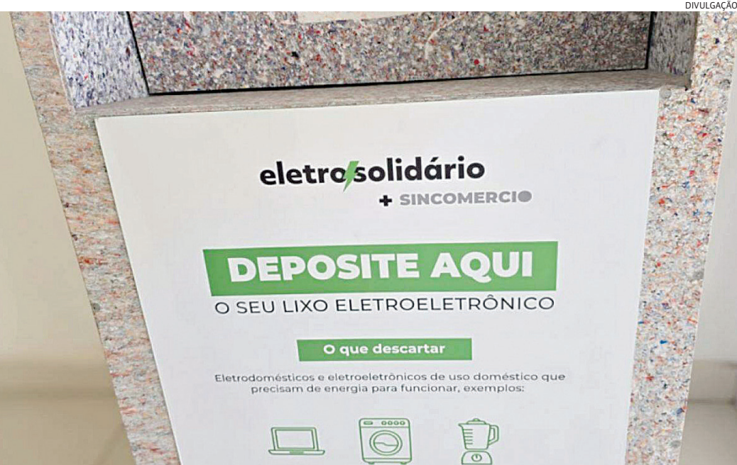
O material poderá ser entregue em diferentes postos de coleta e será recolhido e reciclado

SERVIÇO Lançamento da Campanha Eletro Solidário Data: 28/09 Horário: Das 9 às 13h Local: CDL Jundiaí – Rua Senador Fonseca, 651, Centro