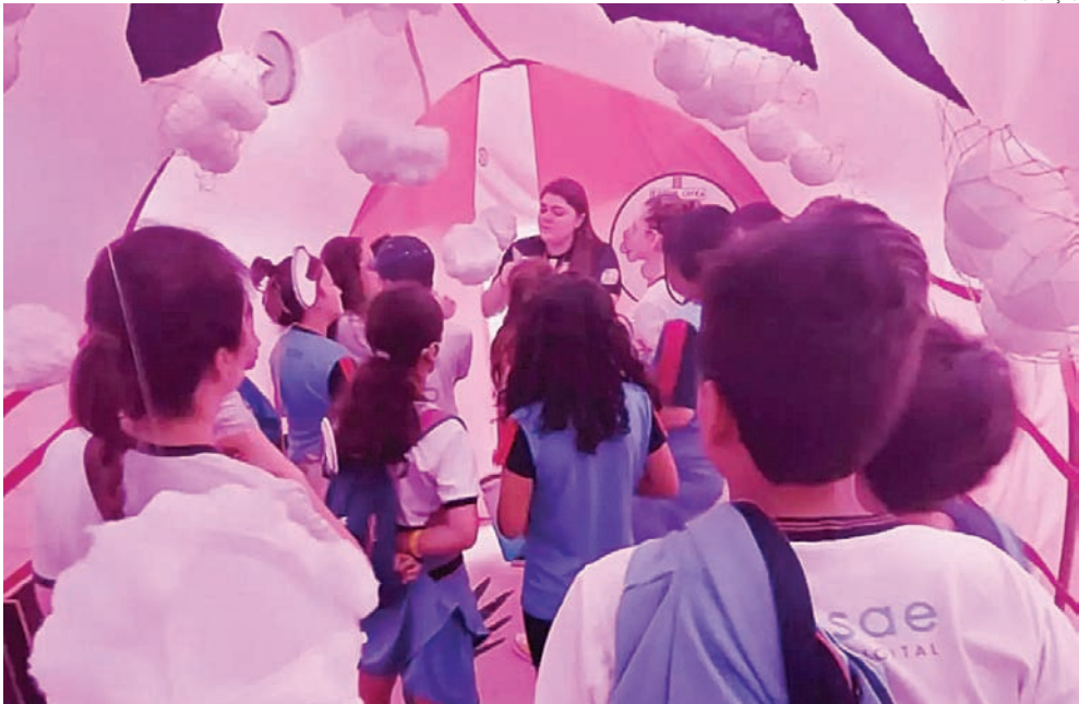
Trata-se de um evento de extensão organizado pelos estudantes do 1º ano