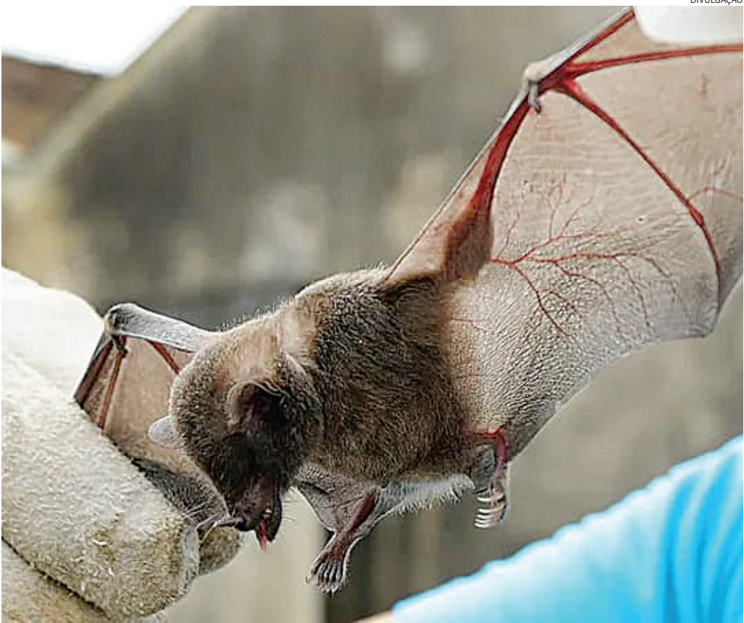
É o nono caso registrado esse ano em Jundiaí; em 2023, 17 casos foram identificados na cidade