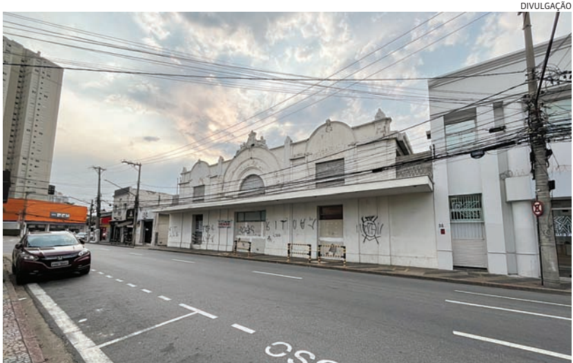
Local tem memória preservada pelos jundiaíenses, que querem o tombamento