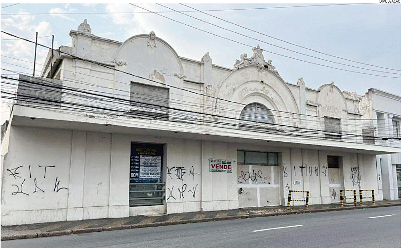
O prédio do Cine República mantém características arquitetônicas da época em que foi construído