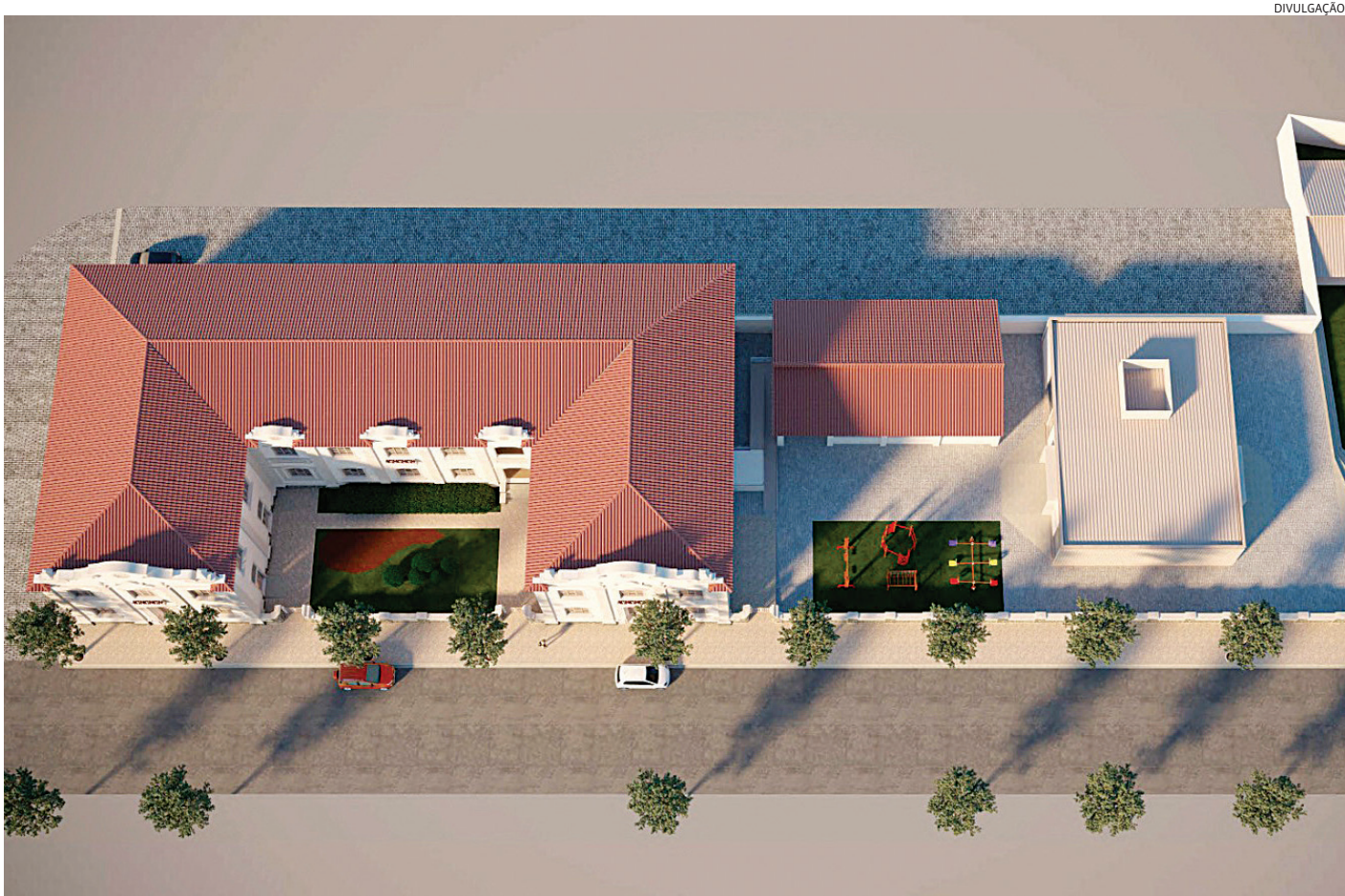
Ambos são equipamentos da Unidade de Gestão de Educação (UGE) da Prefeitura de Jundiaí e estão instaladas em um importante patrimônio histórico da cidade

“Com planejamento e gestão eficiente dos recursos, conseguimos renovar a ambiência de metade das escolas municipais de Jundiaí. Outras quatro já estão com projetos encaminhados, seja com obras em andamento ou em fase de finalização. A educação é o caminho para transformar a realidade das crianças e promover a prosperidade social”, destaca o prefeito