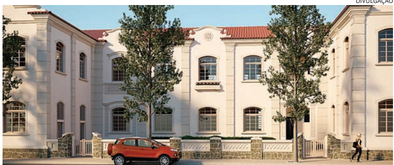
EMEB Maria de T. Pontes será restaurada e há construção de novas creches