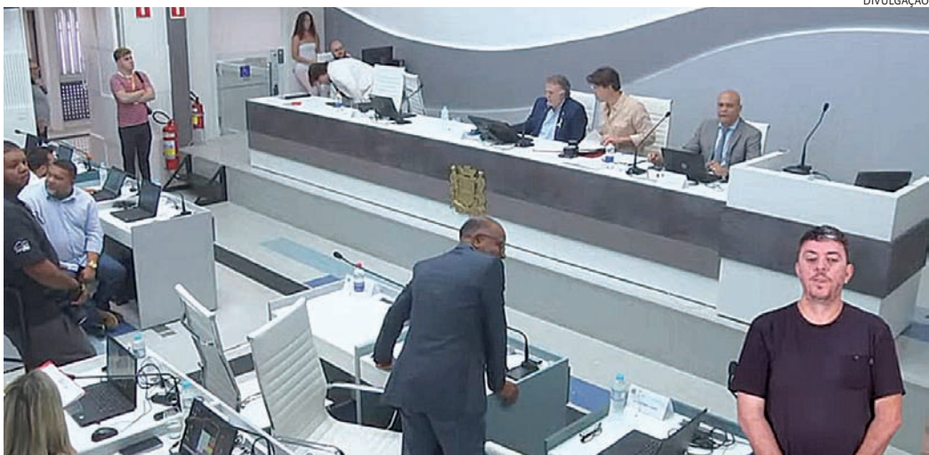
Câmara teve sessão ordinária na manhã desta terça-feira (24)

O Conselho Municipal da Juventude de Jundiaí (Comjuve) informa que vai eleger um conselheiro representante da sociedade civil para preencher uma cadeira de suplente na ca-