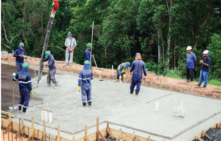
Apartamentos terão 44 m2, com dois dormitórios, sala, cozinha e banheiro

gurança jurídica para os moradores, melhorias no acesso e na infraestrutura urbana e novos projetos habitacionais que garantem moradia digna para quem precisa.