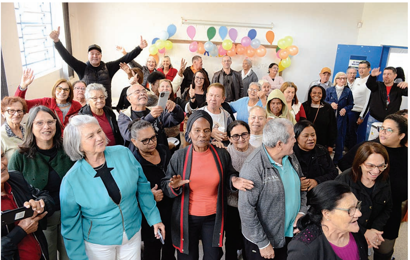
CCPI e Bom Prato Itinerante fortalecem rede de apoio a famílias e idosos

proteção social básica e especial. Em Várzea Paulista, essa rede é operacionalizada por meio dos Centros de Referência de Assistência Social (CRAS) e do Centro de Referência Especializado de Assistência Social (CREAS), além de equipamentos e