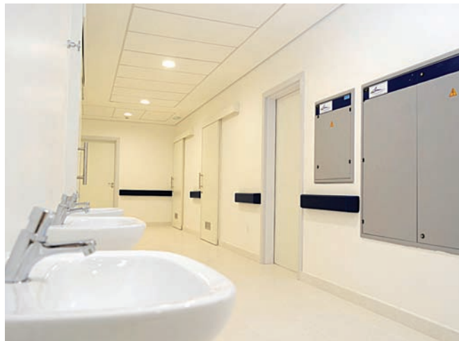
Hospital terá capacidade para realizar cirurgias, com apoio de UTI