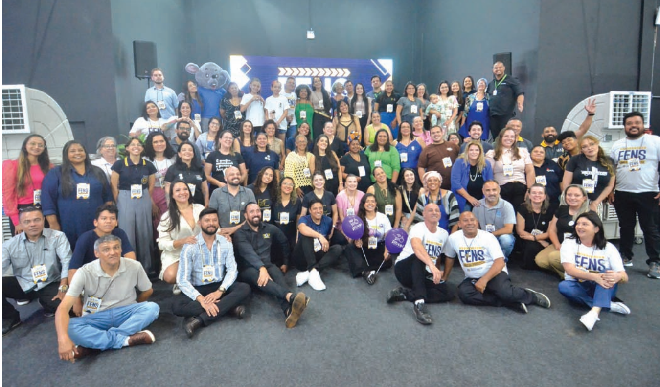
Feira movimentou o Espaço Cidadania e abriu novas oportunidades para empreendedores