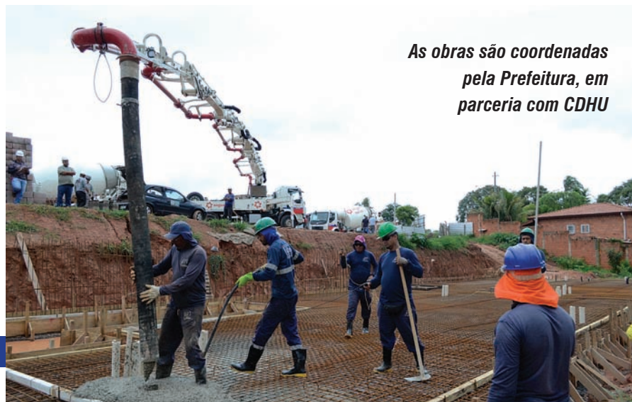
As obras são coordenadas pela Prefeitura, em parceria com CDHU

Outro avanço importante foi a ampliação do horário de atendimento da Unidade de Saúde da Família da Vila Real, que agora funciona até as 19h, facilitando o acesso da população a consultas e acompanhamento médico. *