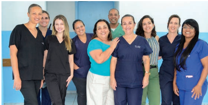
Equipe multidisciplinar atende pacientes acamados em suas residências

Desde que foi implantado, em 2022, o programa já realizou mais de 1.500 atendimentos, sendo mais de 400 acompanhamentos apenas