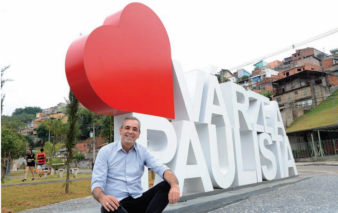
Para Rodolfo, investimentos rompem ciclos de desigualdade e geram oportunidades reais

Ela vai além do modelo tradicional, trazendo ambientes modernos, metodologias ativas e uma proposta pedagógica que coloca o aluno como protagonista do aprendizado, conectando conhecimento, prática e realidade social.