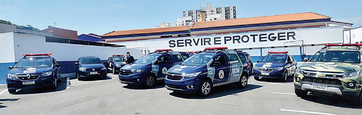
GCM sempre na vanguarda da segurança no município

apoio às escolas e participação em operações integradas com as forças estaduais. O resultado reflete ações adotadas nos últimos anos, como o reforço do policiamento por meio do programa Bairro Mais Seguro, em parceria com a Polícia Militar e a Polícia Civil.