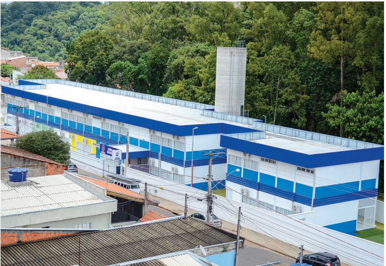
Escola do Futuro atende até 500 crianças da rede municipal

Santos Inocenti — chega para atender até 500 crianças da creche e da pré-escola da Região Norte, levando mais conforto, tecnologia e qualidade para alunos, professores e famílias.