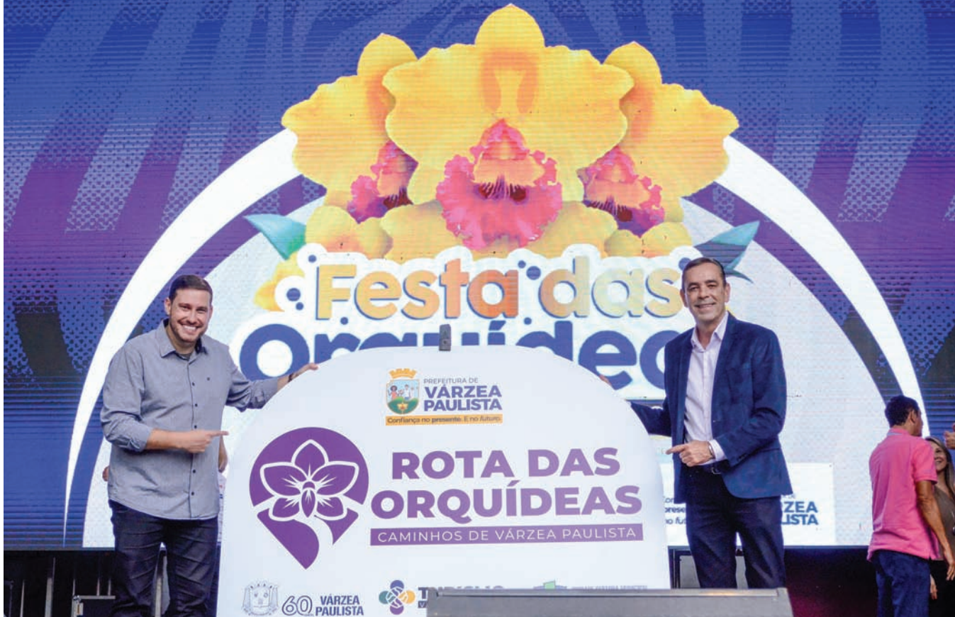
Rota turística integra história, cultura e produção local

lhares de visitantes, produtores, colecionadores e apaixonados por flores. Em 2025, foram mais de 30 mil pessoas em três dias, com mais de 350 espécies de orquídeas e cerca de 40 mil plantas expostas e comercializadas.