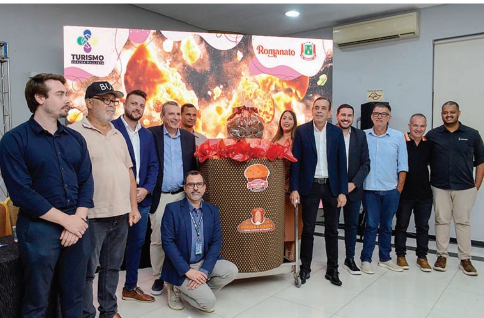
Com a força do panetone, Várzea quer ser reconhecida nacionalmente

Porque, em Várzea Paulista, tradição não é apenas memória — é também o caminho para o futuro. ✨