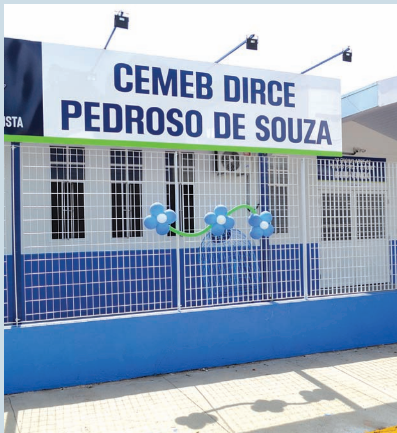
CEMEB Dirce Pedroso foi totalmente reformada e modernizada

A unidade recebeu nova pintura, ventiladores, mobiliário novo e adequação dos ambientes internos. A quadra esportiva também foi revitalizada, ampliando as possibilidades de atividades físicas e pedagógicas. Além disso, a escola passou por intervenções de acessibilidade, garantindo inclusão e mobilidade para toda a comunidade escolar.