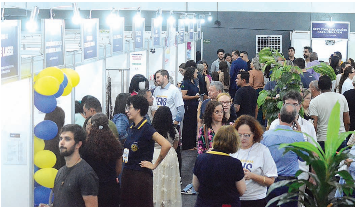
FENS reuniu mais de 100 expositores e milhares de visitantes

Mais do que um evento, a FENS nasceu com um objetivo claro: valorizar quem trabalha, empreende e investe em Várzea Paulista.