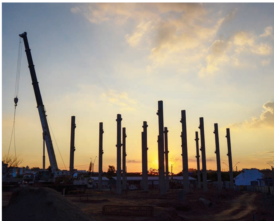
Agora, os novos cidadãos poderão nascer em um hospital na sua própria cidade

Com a implantação da maternidade, as gestantes poderão ter seus filhos na própria cidade, com atendimento especializado e mais conforto para as famílias.