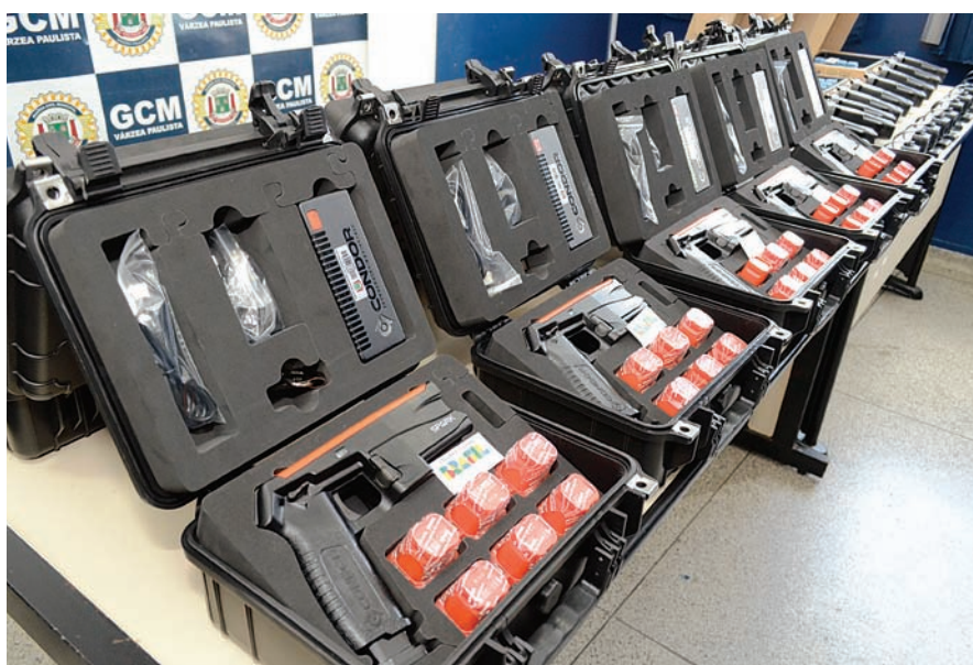
Novos armamentos trazem maior capacidade de enfrentamento à violência na GCM