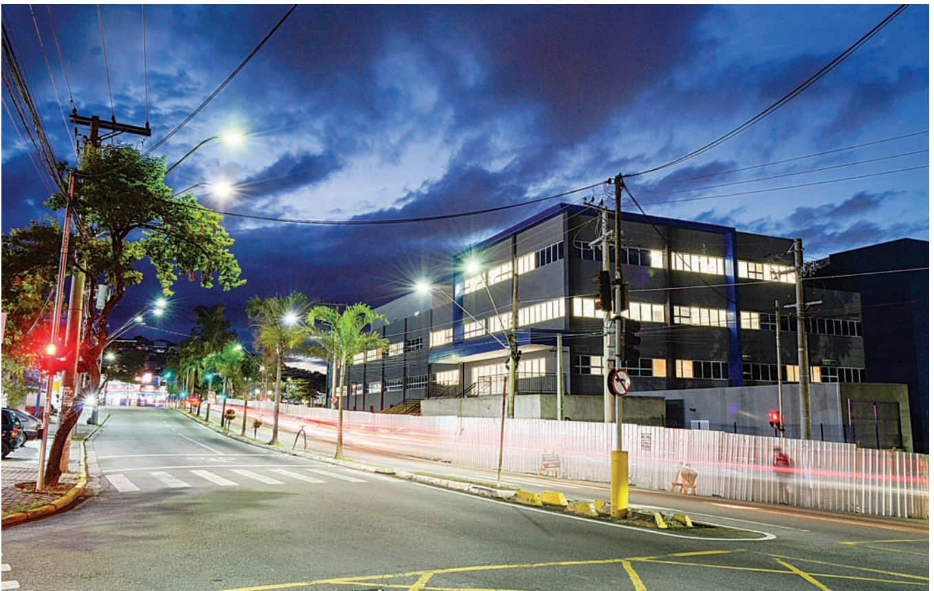
Com mais de 7 mil m 2 , novo prédio foi totalmente projetado para atender a população

Muito mais do que uma obra, o novo hospital representa um passo decisivo para fortalecer o sistema de saúde do município. Com mais de 7 mil metros quadrados de área cons-