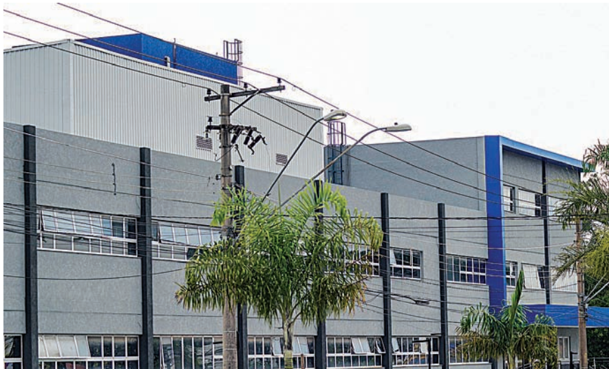
Hospital terá UTI, fazendo com que alta complexidade seja atendida

Com estrutura moderna, atendimento ampliado e serviços que antes não existiam no município, a cidade passa a oferecer uma rede de saúde mais completa e preparada para atender as necessidades da população. ✱