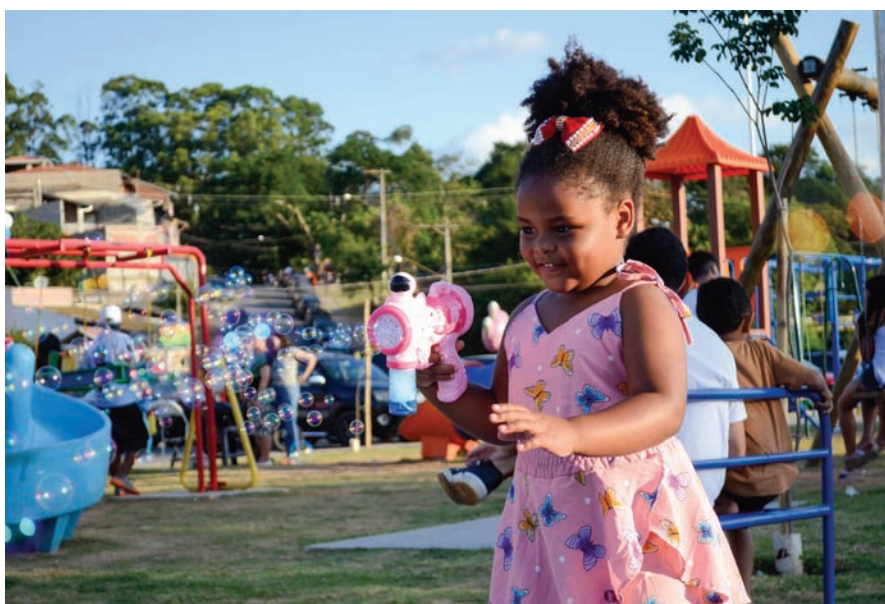
No Jardim América II, Pq. da Família representa nova opção de lazer e convivência

Entre os equipamentos disponíveis estão playground, pista de caminhada, academia ao ar livre, pista de Pump Track e iluminação em LED, além de um espaço estruturado para a realização de feira livre. O projeto também foi pensado para ser inclusivo, com brinquedos adaptados para crianças com deficiência e infraestrutura que incentiva a prática de atividades físicas para todas as idades.