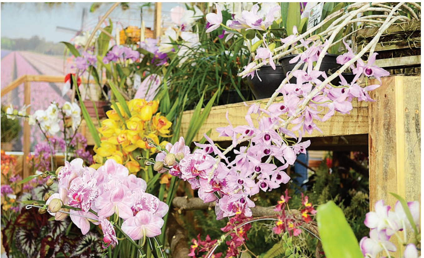
Mais de 30 mil pessoas visitam a Festa da Orquídea, anualmente