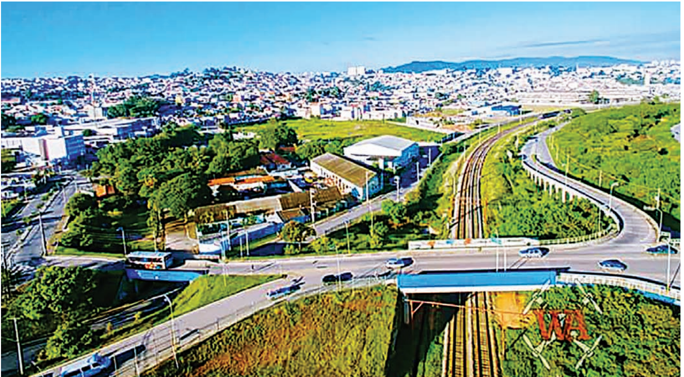
Várzea desponta como uma das cidades mais bem administradas no país