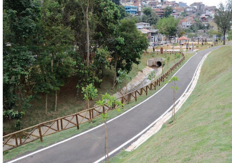
Primeira fase de obras no Gauchinha melhorou a mobilidade