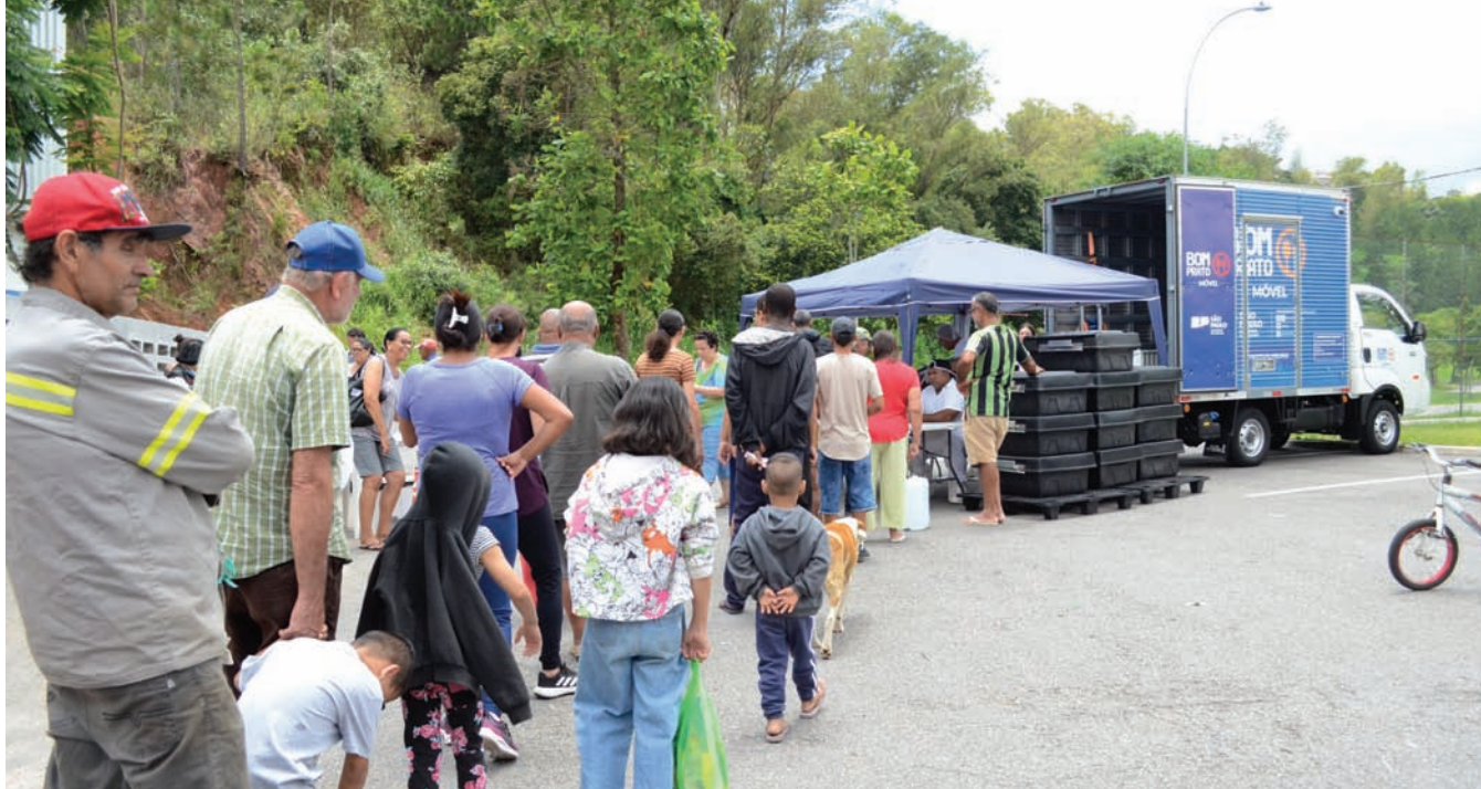
Por meio do Bom Prato Itinerante, refeições balanceadas são oferecidas a preços acessíveis