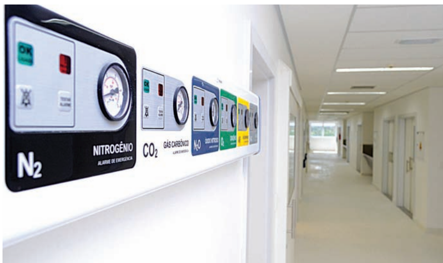
O Novo Hospital terá 100 leitos para internação