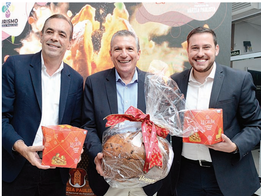
Com produção de 20 milhões de panetones anuais, Várzea é a Capital do Panetone

Se as flores são um símbolo cultural, o panetone é um símbolo econômico.