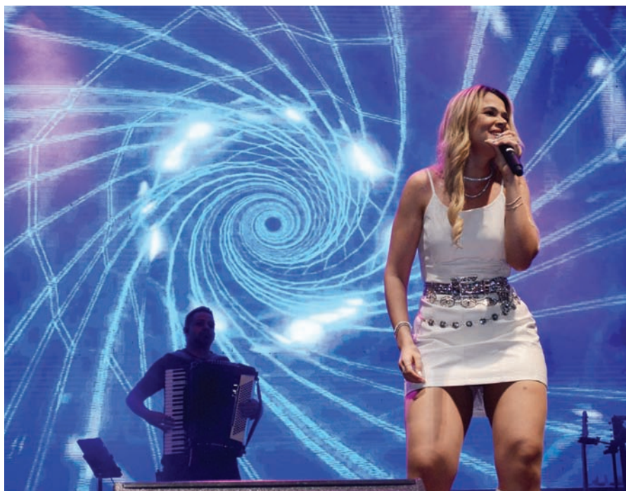
Atrações culturais são o ponto forte do evento