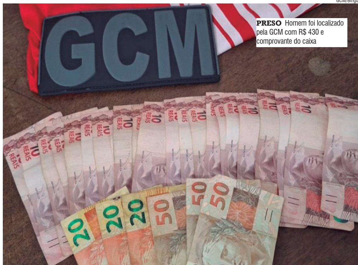
PRESO Homem foi localizado pela GCM com R$ 430 e comprovante do caixa