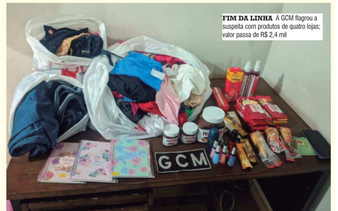
FIM DA LINHA A GCM flagrou a suspeita com produtos de quatro lojas; valor passa de R$ 2,4 mil

Ampliação das diligências identificou itens provenientes de outros estabelecimentos próximos. Parte dos produtos foi reconhecida pelas gerentes das lojas como sendo oriunda de furto. O valor total estimado das mercadorias ultrapassa R$ 2,4 mil. A mulher foi conduzida à delegacia sem resistência.