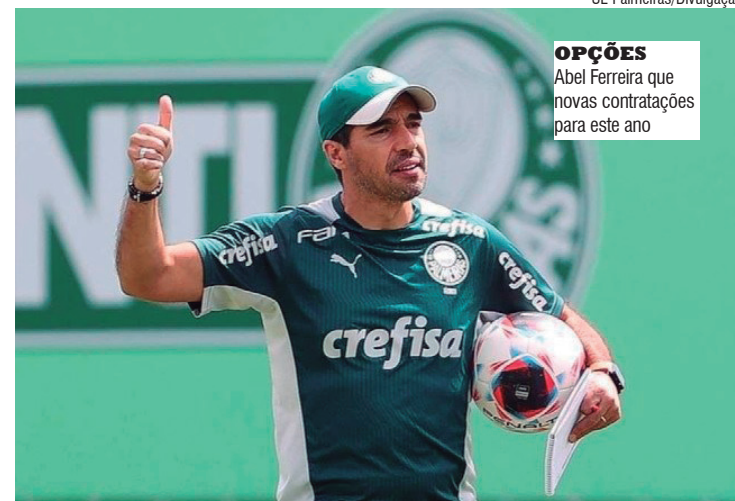
OPÇÕES Abel Ferreira que novas contratações para este ano

"Eu tenho o Veiga e estamos à procura de achar um substituto à altura. O adversário (Flamengo) tem Arrascaeta e De la Cruz. Muitas vezes vocês reclamam da fase dos jogadores, mas deixa eu falar que eles não aguentam, estão cansados. Mui-