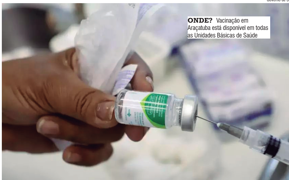
ONDE? Vacinação em Araçatuba está disponível em todas as Unidades Básicas de Saúde