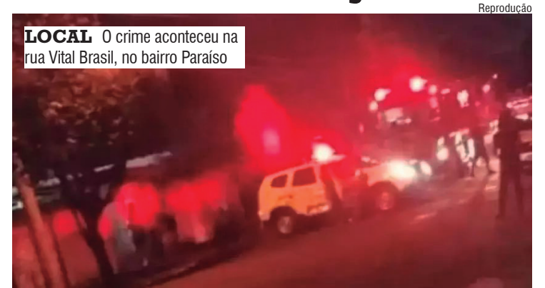
LOCAL O crime aconteceu na rua Vital Brasil, no bairro Paraíso