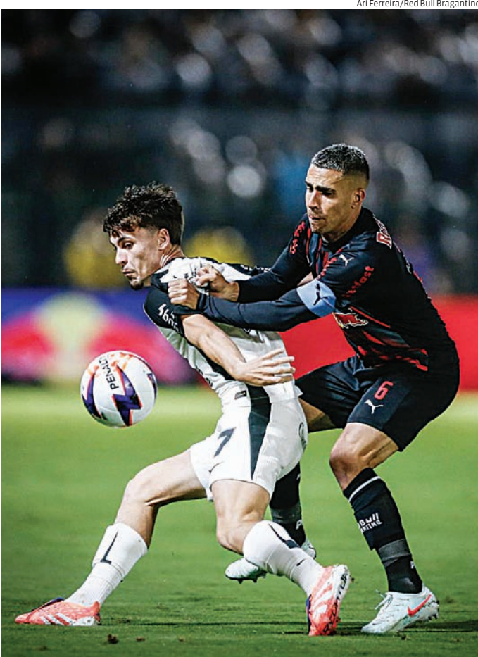
No primeiro confronto do ano, o time do interior venceu por 3 a 0