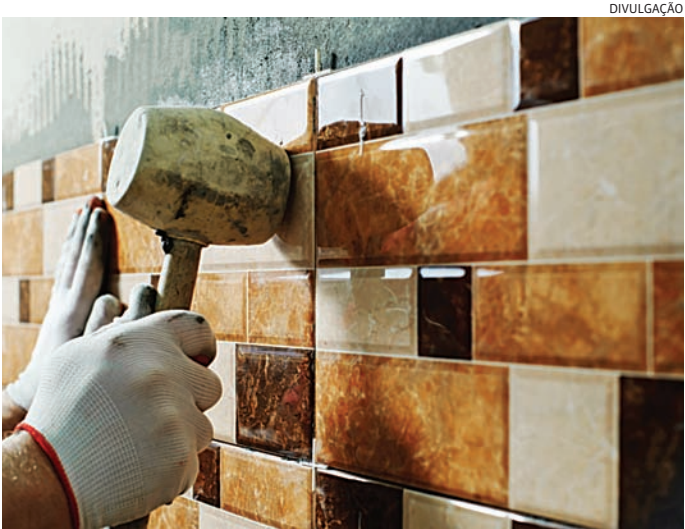
A iniciativa é uma oportunidade de aprendizado e geração de renda

As fichas não contempladas ficarão em lista de espera e poderão ser chamadas em caso de desistência. O participante que desistir do curso sem aviso prévio ficará impedido de se inscrever novamente por um período de três meses. Leia mais na versão do JJ ( jj.com.br )