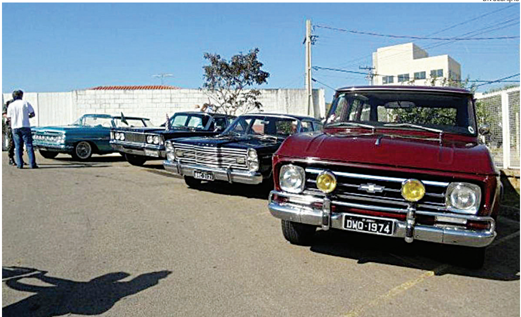
A frota de placas pretas do estado de São Paulo é de 76 mil

Já o automóvel mais longo do estado fica na capital: um exemplar da