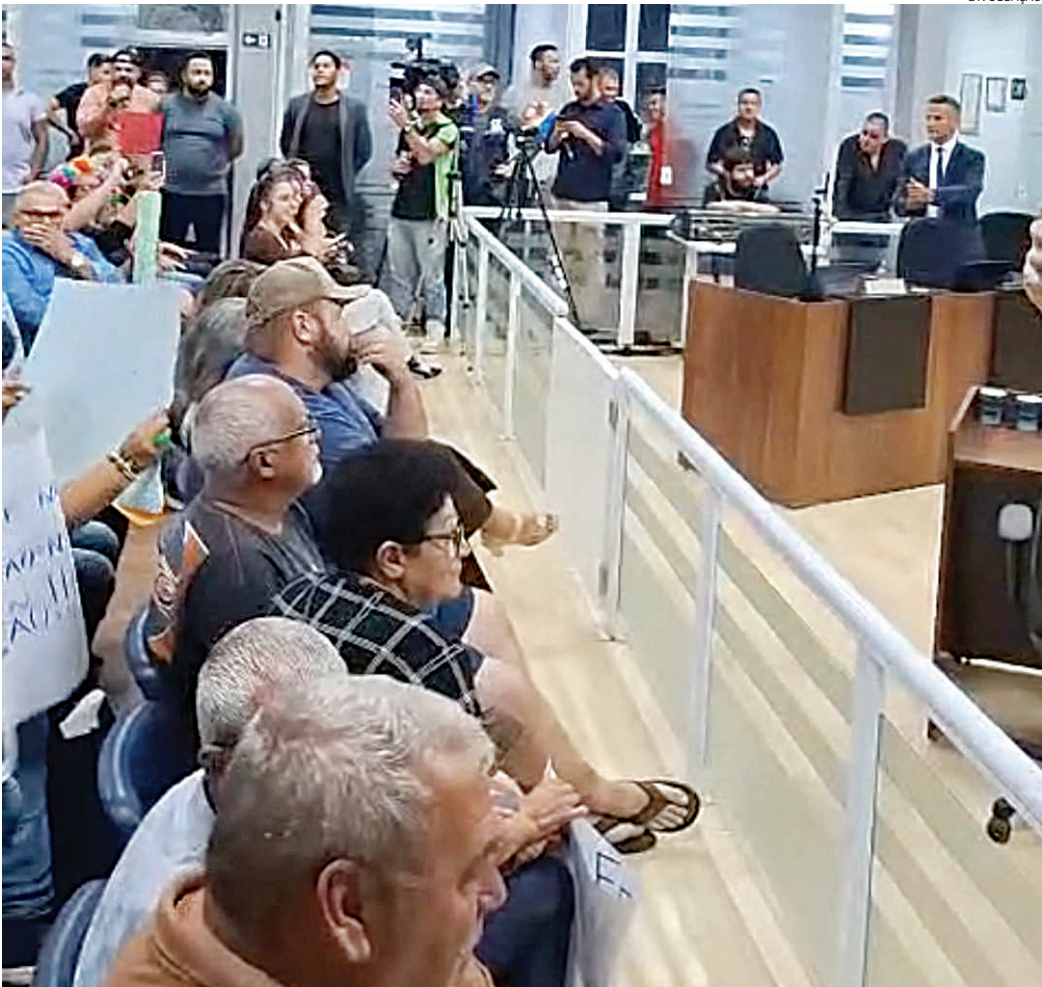
Sessão contou com grande número de munícipes e apoiadores do prefeito