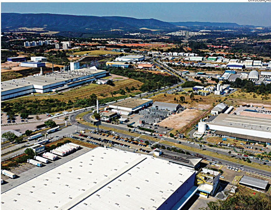
Os Estados Unidos lideraram como destino das exportações da regional

gional de Jundiaí em janeiro estão máquinas, aparelhos e instrumentos mecânicos (23,4%), máquinas, aparelhos e materiais elétricos (16,7%) e produtos de perfumaria (8,9%). Já as importações se concentraram em máquinas, aparelhos e materiais elétricos (30,2%), máquinas, apare-