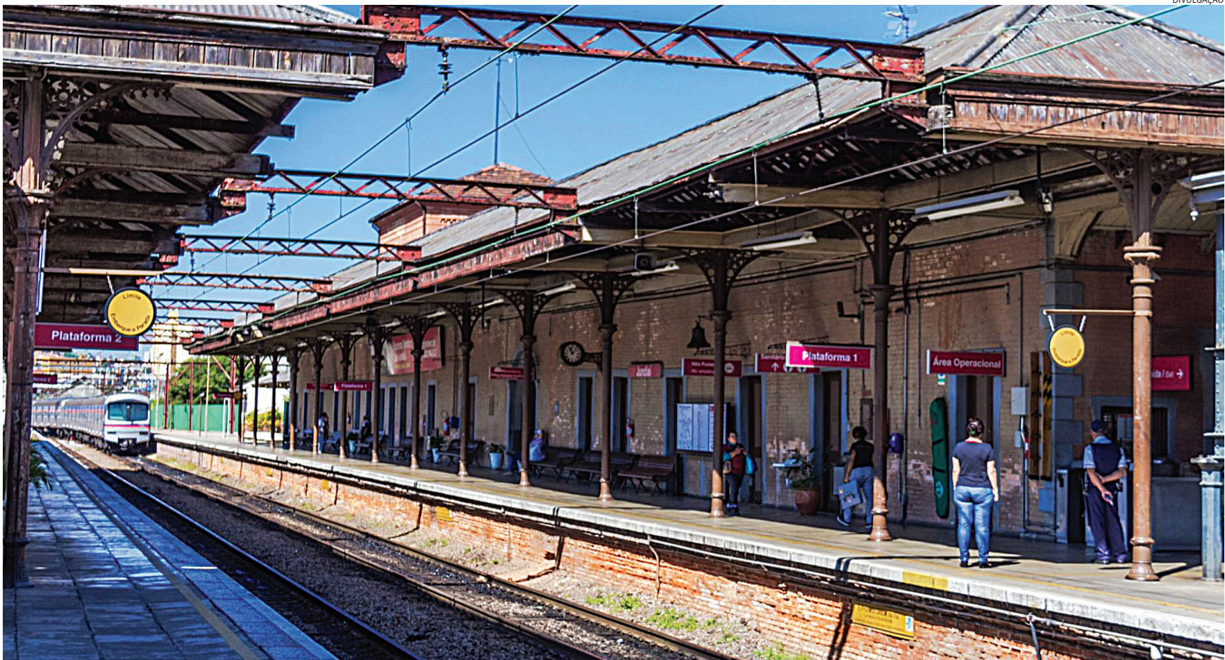
Projeto visa concentrar moradias, empregos e serviços no entorno de corredores

Na Região Metropolitana de Jundiaí (RMJ), outro município contemplado será Louveira, com outras mil habitações. Outras cidades que receberão o benefício serão Campinas (2 mil unidades), Valinhos (1 mil), Vinhedo (1 mil), Franco da Rocha (2 mil), Barueri/Carapicuíba