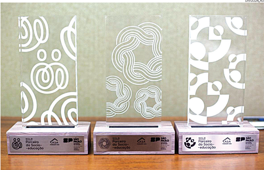
Podem concorrer projetos ligados a áreas como educação formal e complementar

Podem concorrer projetos ligados a áreas como educação formal e complementar, qualificação profissional, empregabilidade, cultura, esporte, saúde, cidadania, inclusão social e fortalecimento da rede de proteção. As iniciativas também devem dialogar com os Objetivos de Desenvolvimento Sustentável