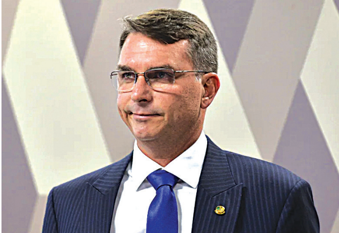
Flávio Bolsonaro estaria no segundo turno com Lula, diz pesquisa

Além deles, foram ventilados como candidatos os nomes do ex-ministro Aldo Rebelo (Democracia Cristã) e de Renan Santos (Missão). O governador de São Paulo, Tarcísio de Freitas (Republicanos), ficou de fora. Ele declara que não vai se candi-