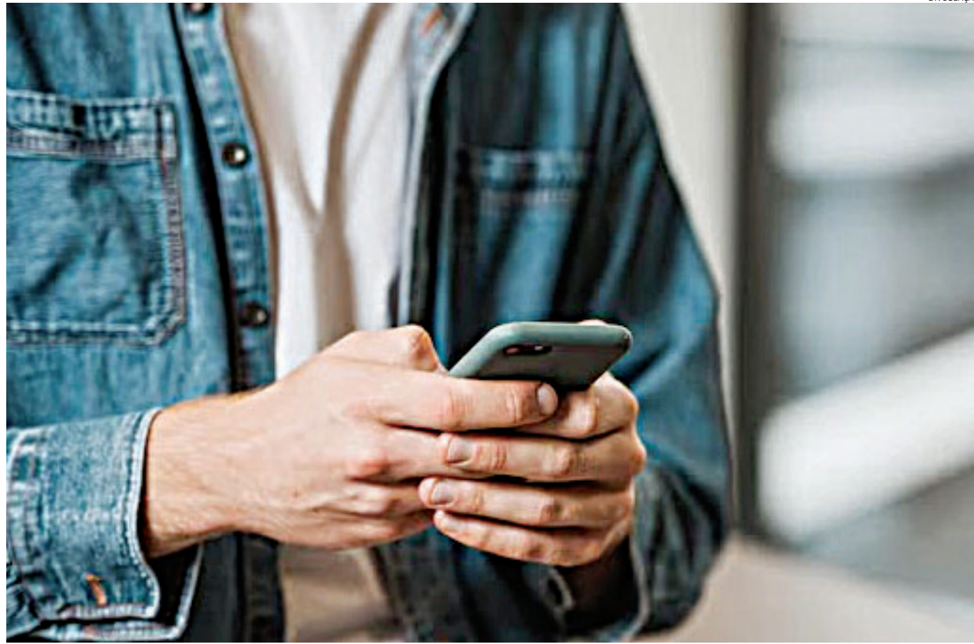
O roubo e furto de celulares têm caído em Jundiaí e no Estado

Apesar do número alto, a tendência é de queda neste tipo de registro. Ao considerar o primeiro bimestre de 2024, o de 2025 e o de 2025, houve queda ano a ano. Entre janeiro e fevereiro de 2024, Jundiaí teve 522 ocorrências de subtração de celular, sendo 168 de roubo, 203 de furto e 151 de outros tipos. No mesmo período, mas em 2025, foram 466 ocorrências, 174 de roubo, 183 de furto e 109 de outros tipos. Já neste ano, das 375 ocorrências, 114 foram de roubo, 141 de furto e 120