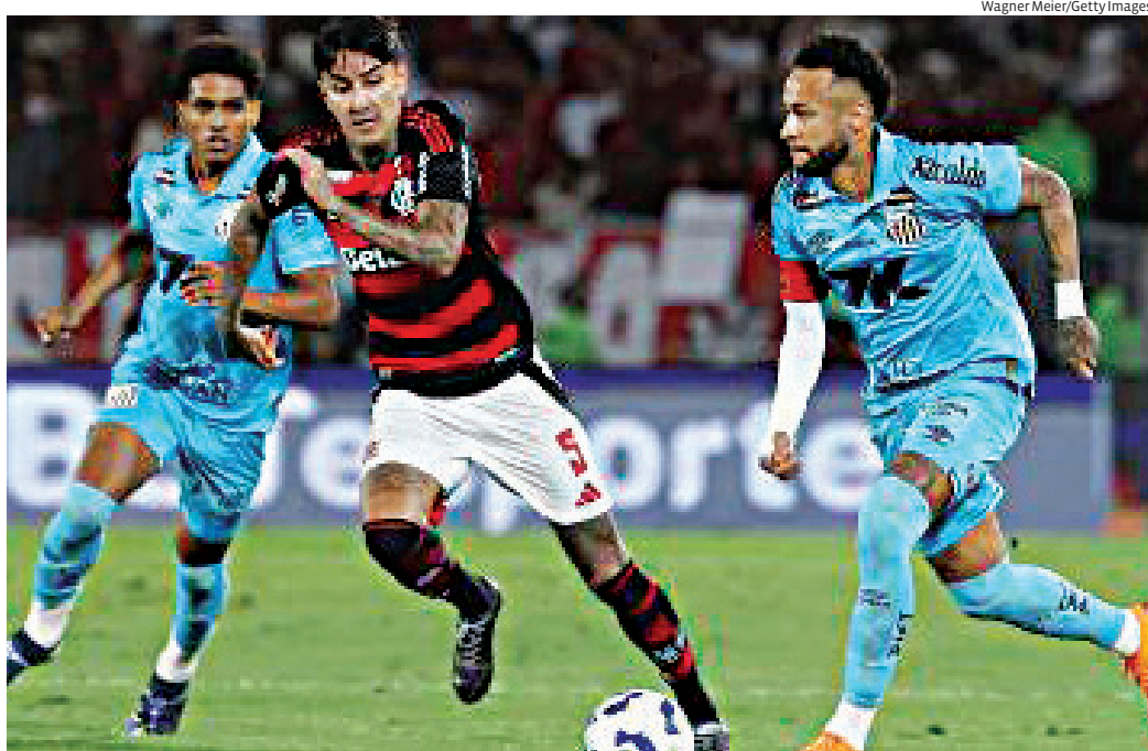
Três jogos movimentam rodada do Brasileiro

A rodada reúne jogos importantes para os paulistas, que entram em campo pressionados por desempenho e pontuação em um início competitivo de Brasileiro.