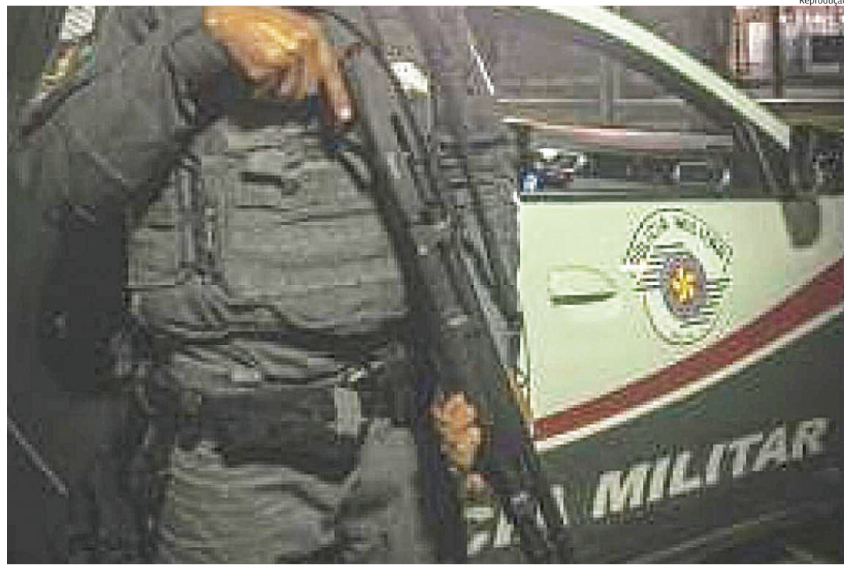
As equipes visualizaram o veículo transitando de forma irregular

Diante dos fatos, ele foi conduzido à Central de Flagrantes, onde a ocorrência foi registrada e permaneceu à disposição da Justiça.