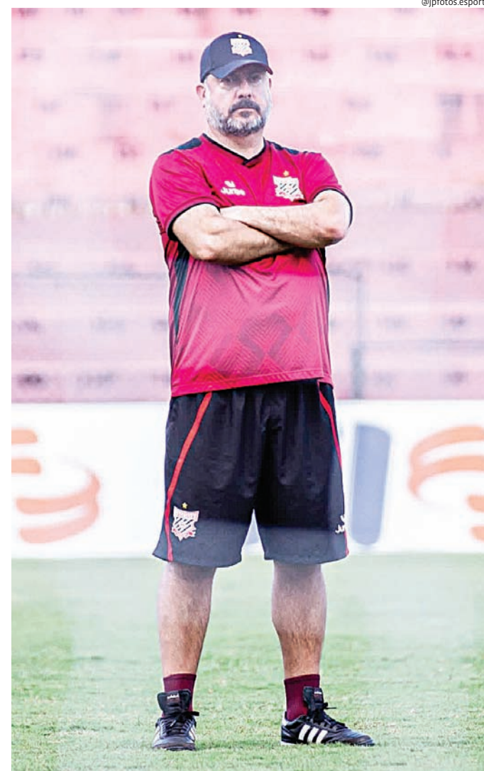
Galo joga por classificação após duelo equilibrado na ida

Com vaga na semifinal em jogo, o Paulista entra em campo pressionado, mas confiante, tentando surpreender o adversário e seguir na briga pelo acesso à Série A2.