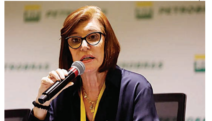
Magda Chambriard quer aumentar produção e refino

De acordo com Magda Chambriard, a expansão da