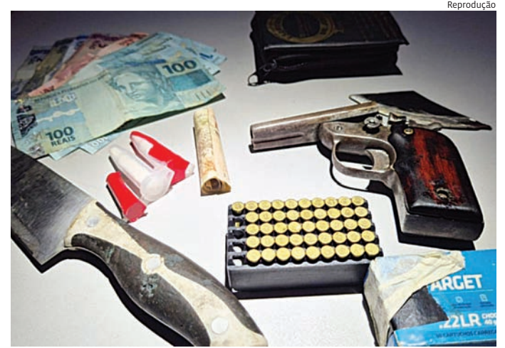
Um dos abordados assumiu a propriedade do veículo e dos objetos

Na vistoria veicular, foi encontrado um revólver artesanal, em condições de disparo, além de dezenas de