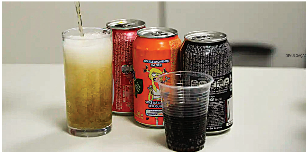
Baixo preço e até mesmo questões afetivas levam ao alimento ultraprocessado