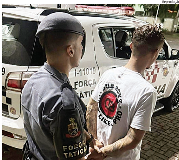
O homem era procurado por roubo e havia rompido o dispositivo

Ainda segundo a corporação, o homem era procurado por roubo e havia rompido