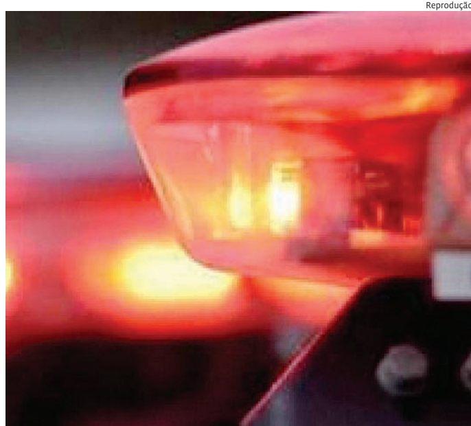
Suspeito foi detido após ser flagrado aguardando a vítima na rua

Após análise da autoridade de plantão, um dos indivíduos foi liberado, enquanto o outro permaneceu à disposição da Justiça pelos crimes de porte ilegal de arma de fogo, posse de munição, porte de entorpecente e apreensão de arma branca.