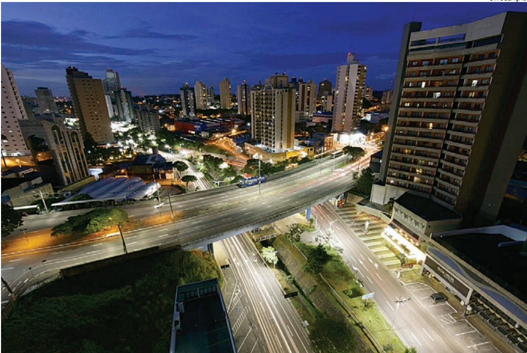
Jundiaí é um dos municípios contemplados na etapa do Novo PAC Seleções

Os primeiros projetos selecionados para receber recursos federais foram anunciados em março, quando a Prefeitura de Jundiaí conseguiu emplacar a construção das UBS Rio Acima e UBS Maringá, Creche Helena Galimbert e a contratação de