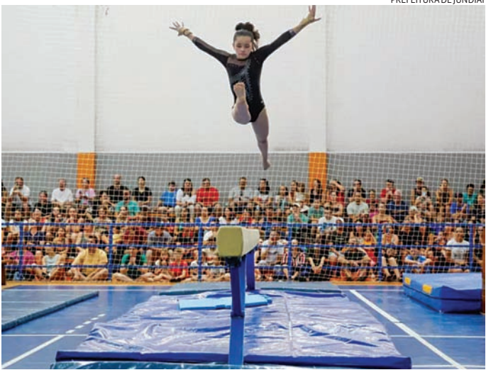
PREFEITURA DE JUNDIAÍ

No Bolão, o treinamento é exclusivo da equipe de competição da cidade, uma espécie de seleção dos melhores dos complexos esportivos.