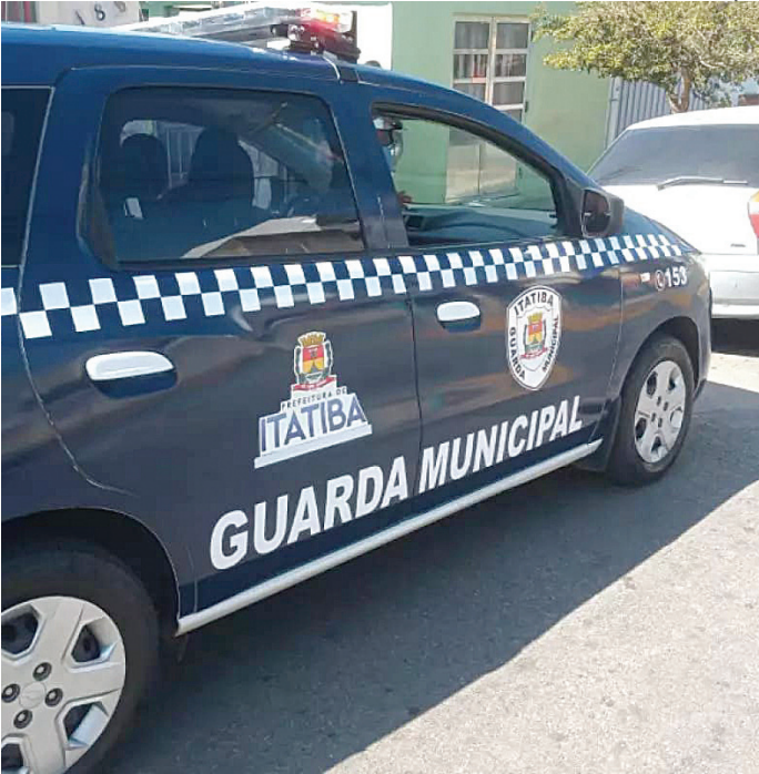
As drogas foram apreendidas pelos GMs e os dois suspeitos foram presos

Um suspeito de tráfico, na função de “aviãozinho” foi preso em flagrante por guardas municipais, em Itatiba, no momento em que abastecia uma ‘biqueira’ - a função do aviãozinho é justamente pegar a droga do local do armazenamento e levar para os pontos de venda. Os GMs Rilson e Ferreira haviam estado em uma escola, para atendimento, quando, ao deixarem o local, foram patrulhar em uma rua que faz fundos para a unidade escolar - neste local funcionava uma ‘biqueira’. Quando chegaram na rua, avistaram um homem descer de um carro e entregar a outro, uma sacola. Quando os guardas aceleraram, o suspeito voltou para o carro e tentou fugir, mas foi detido, assim como o que havia recebido a sacola.