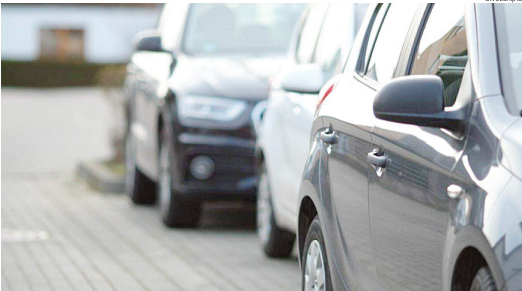
Pesquisar os detalhes do modelo desejado faz toda diferença no processo

Por fim, certifique-se de que toda a documentação do veículo está em ordem e atualizada. “Isso inclui o Certificado de Registro do Veículo (CRV), o Certificado de Registro e Licenciamento do Veículo (CRLV) e o comprovante de pagamento do Imposto sobre a Propriedade de Veículos Automotores (IPVA)”, finaliza o superintendente.