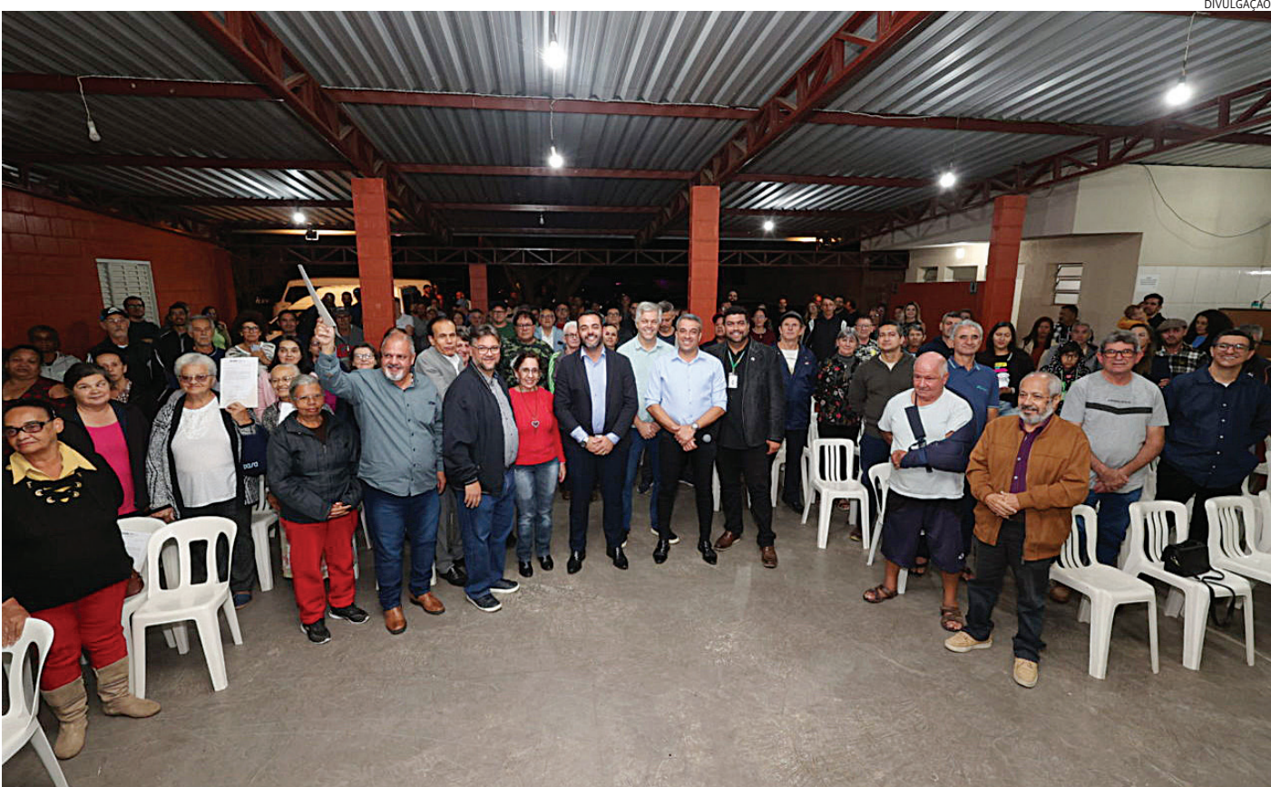
Após mais de 25 anos de luta e espera, 138 famílias receberam, emocionadas, as matrículas regularizadas

A história do Jardim Ritoni começou em 1995, com a venda de partes ideais de uma propriedade da família Ritoni. Ao longo dos anos, a área foi sendo dividida e ocupada por cerca de 65 famílias, que depois se