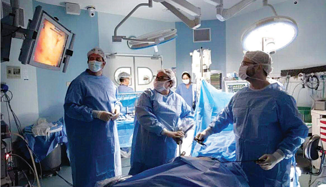
Mais de 4 mil procedimentos serão realizados em 25 hospitais estaduais para reduzir filas

Com o investimento adicional, a pasta busca ampliar a capacidade de atendimento da rede e reduzir o tempo de espera. A iniciativa integra o conjunto de ações estratégicas do Governo de São Paulo para expandir o acesso à assistência especializada, alinhada a programas como a Tabela SUS Paulista, que atualizou