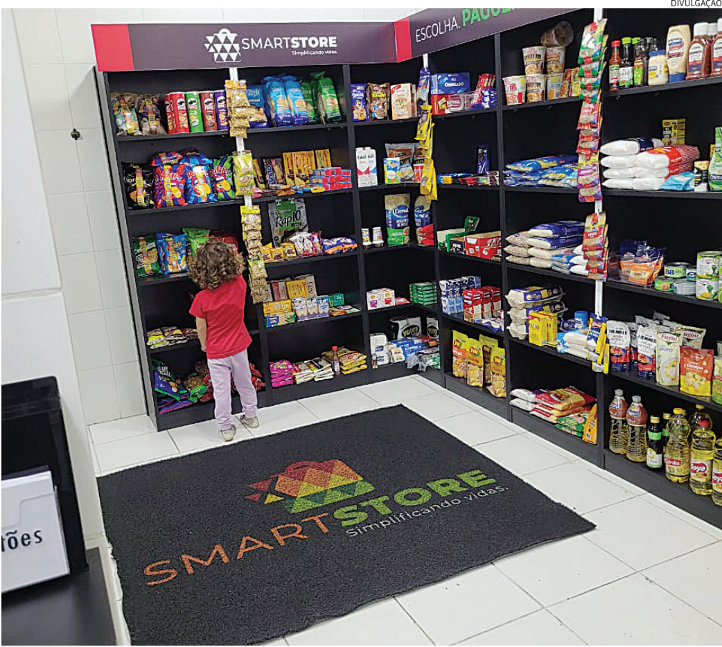
Para Carla Biasi, o espaço é um aliado na rotina com filhos e garante praticidade em momentos de imprevisto

A praticidade de fazer compras rápidas, sem sair do prédio e com total autonomia, tem conquistado moradores do país inteiro e na cidade não é diferente. Essas pequenas lojas funcionam dentro de condomínios residenciais e operam com tecnologia de autosserviço: o morador