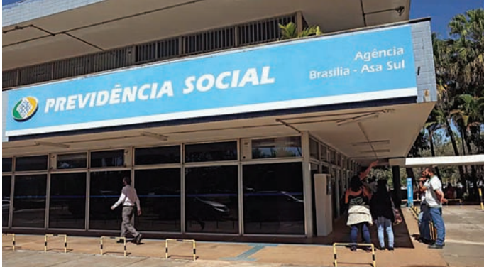
Fraude expôs entidades associativas, que agora falam em demissão

Outros sindicatos e associações também relatam dificuldade em manter seus serviços após a suspensão das mensalidades, inclusive os que não estão