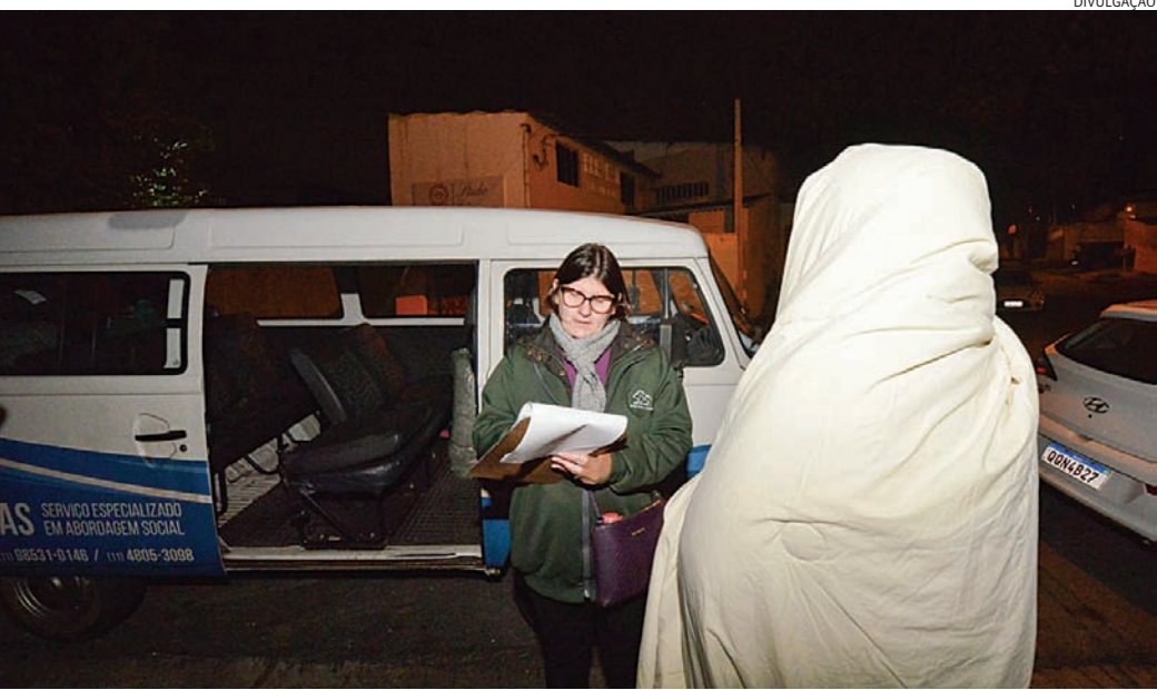
O atendimento emergencial é realizado em qualquer época do ano que a temperatura atinge 13°C

Mais do que uma tendência, os mercadinhos de condomínio representam uma nova forma de consumo, conectada com a agilidade e a conveniência exigidas pela vida moderna. Em cidades como Jundiaí, que combinam dinamismo urbano com forte presença de condomínios residenciais, o modelo tende a se consolidar ainda mais nos próximos anos.