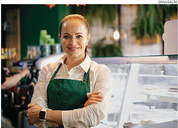
Profissionais receberão currículos de interessados em trabalhar na área

SERVIÇO: Pit Stop do Comércio Data: Sábado 24/05 Horário: Das 10 às 14h Endereço: Estacionamento da loja A Paulistana Magazine (Av. Fernão Dias de Paes Leme, 567 - Centro, Várzea Paulista). Realização: Sincomercio e CDL Jundiaí em parceria com A Paulistana Magazine.