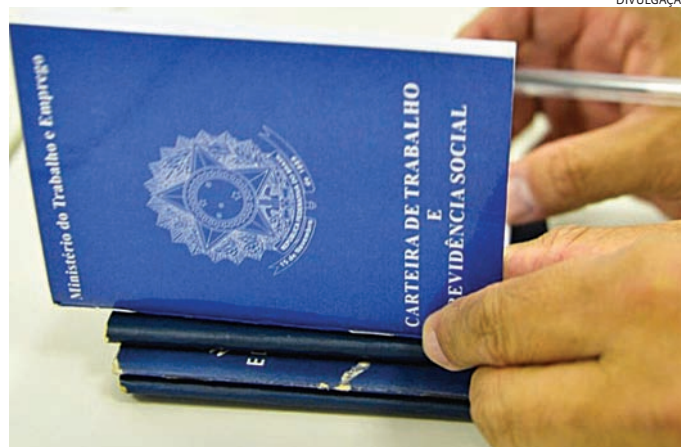
Jovens estão ocupando cargos mal pagos e que serão extintos em breve