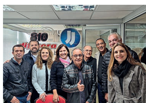
Funcionários da Rádio Difusora comemoraram os 80 anos