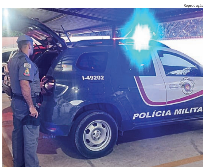
Na abordagem, a polícia descobriu que ele tinha um mandado

Os veículos atingidos foram devidamente registrados no boletim de ocorrência, assim como os danos constatados, com o respectivo registro fotográfico. O veículo do suspeito foi entregue à filha dele. Ninguém se feriu.