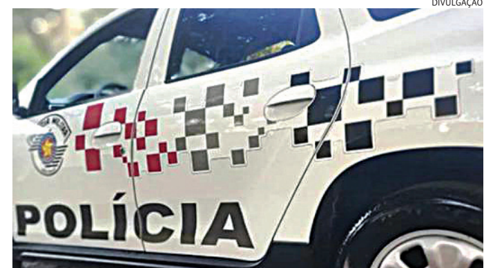
O homem estava dentro do veículo no momento da abordagem

Durante a abordagem ao suspeito, os policiais verificaram que ele apresentava visíveis sinais de embriaguez, como forte odor etílico, andar cambaleante, fala pastosa e