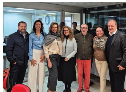
Representantes da indústria e Ciesp participaram do evento