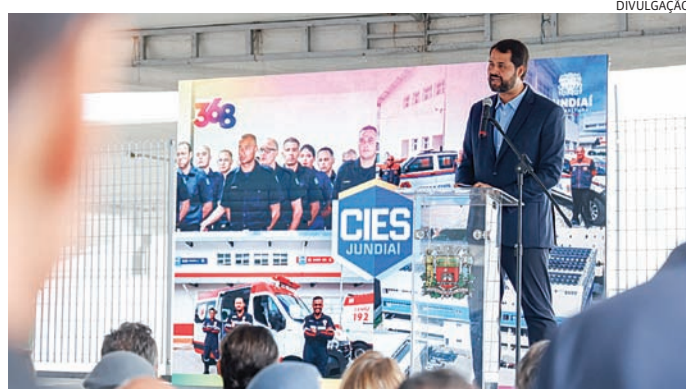
Em 8 anos, investimento em segurança - luta seguirá em Brasília

A estrutura passou a reunir em um único espaço a Guarda Municipal, a Defesa Civil, o SAMU/SAEC, equipes de Fiscalização, Trânsito e o Centro de Monitoramento da cidade. O objetivo foi integrar informações e agilizar a resposta a ocorrências, reduzindo o tempo de atendimento em situações de emergência.