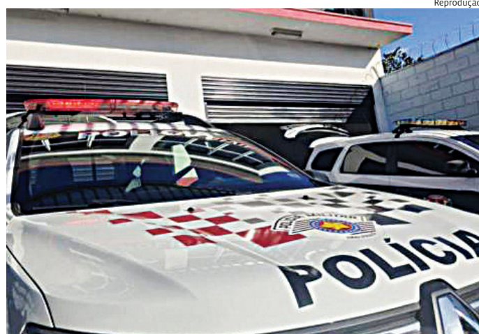
Os suspeitos são um maior de idade e dois menores

Os policiais conseguiram encontrar a vítima, que confirmou que estava dormindo no local, ocasião