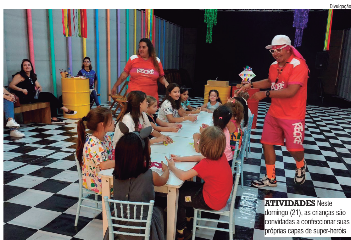
ATIVIDADES Neste domingo (21), as crianças são convidadas a confeccionar suas próprias capas de super-heróis

- Formatura dos Heróis (com direito a certificado) - Encontro com os Heróis e o desafio final - Evento gratuito O Shopping Praça Nova fica na rua Carlos Pereira da Silva, 6000, Jardim Guanabara