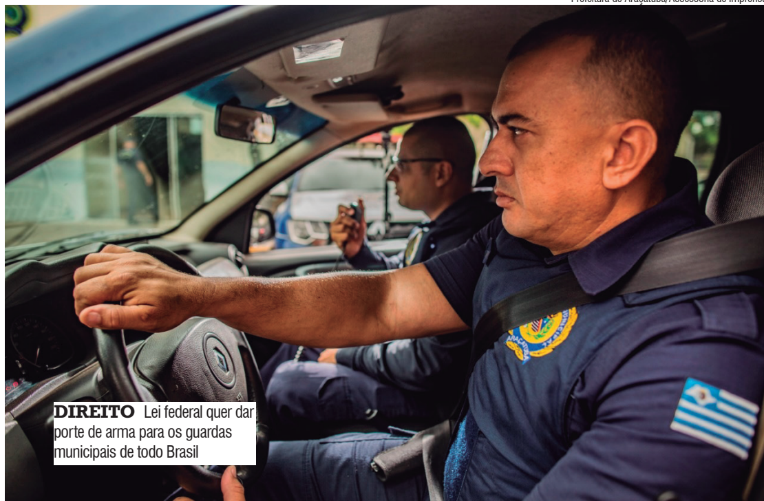
DIREITO Lei federal quer dar porte de arma para os guardas municipais de todo Brasil