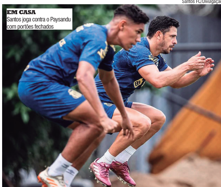
EM CASA Santos joga contra o Paysandu com portões fechados