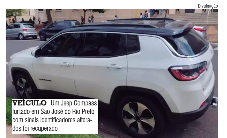
Divulgação VEÍCULO Um Jeep Compass furtado em São José do Rio Preto com sinais identificadores alterados foi recuperado

Diante das evidências de receptação e adulteração, o condutor foi detido em flagrante e encaminhado à central de flagrantes. O delegado responsável ratificou a prisão e o acusado