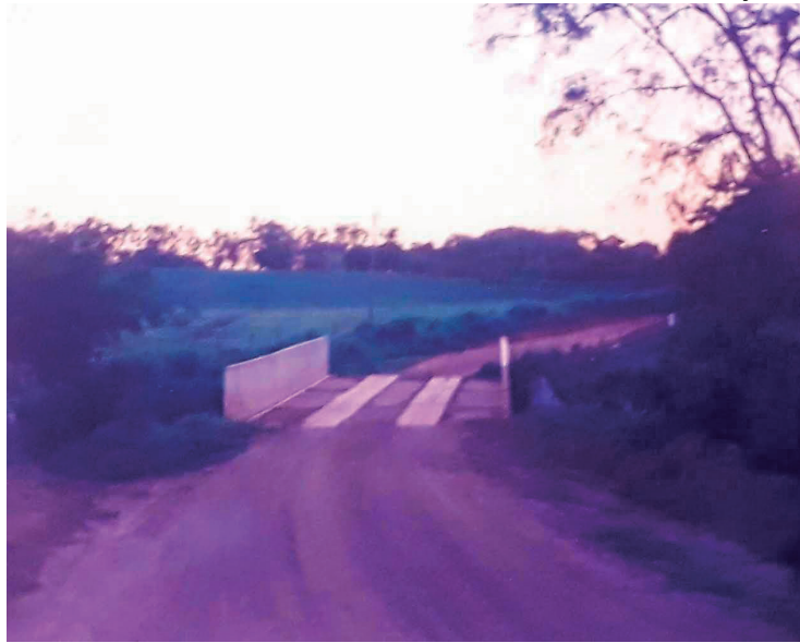
Ponte do Bagaçu