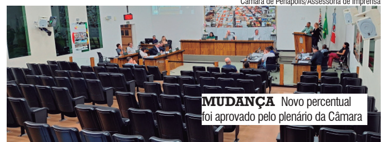
MUDANÇA Novo percentual foi aprovado pelo plenário da Câmara

Metade do orçamento impositivo tem que ser aplicado exclusivamente em ações e serviços de saúde pública. A Câmara Municipal de Penápolis foi uma das primeiras da região a criar este modelo na região.