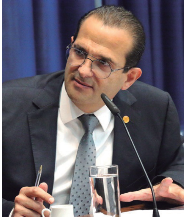
PROPOSITOR Deputado Edmir Chedid propôs a Comissão

“Mesmo nos municípios do interior e do litoral contemplados pela rede própria ou credenciada do Iamspe, os servidores ainda enfrentam problemas com várias reclamações sobre demora no agendamento de consulta”, argumenta o parlamentar.