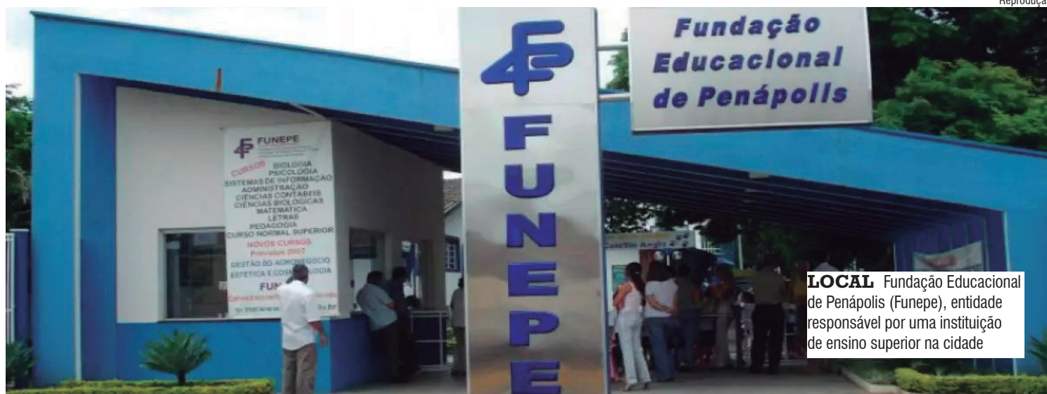
Reprodução LOCAL Fundação Educacional de Penápolis (Funepe), entidade responsável por uma instituição de ensino superior na cidade

A Justiça determinou o afastamento de nove membros do Conselho Curador da Fundação Educacional de Penápolis (Funepe), entidade responsável por uma instituição de ensino superior na cidade, como parte de uma investigação sobre desvio de verbas, conduzida pela Polícia Civil de Araçatuba. O esquema sob investigação movimentou aproximadamente R$ 36 milhões. A informação foi divul-