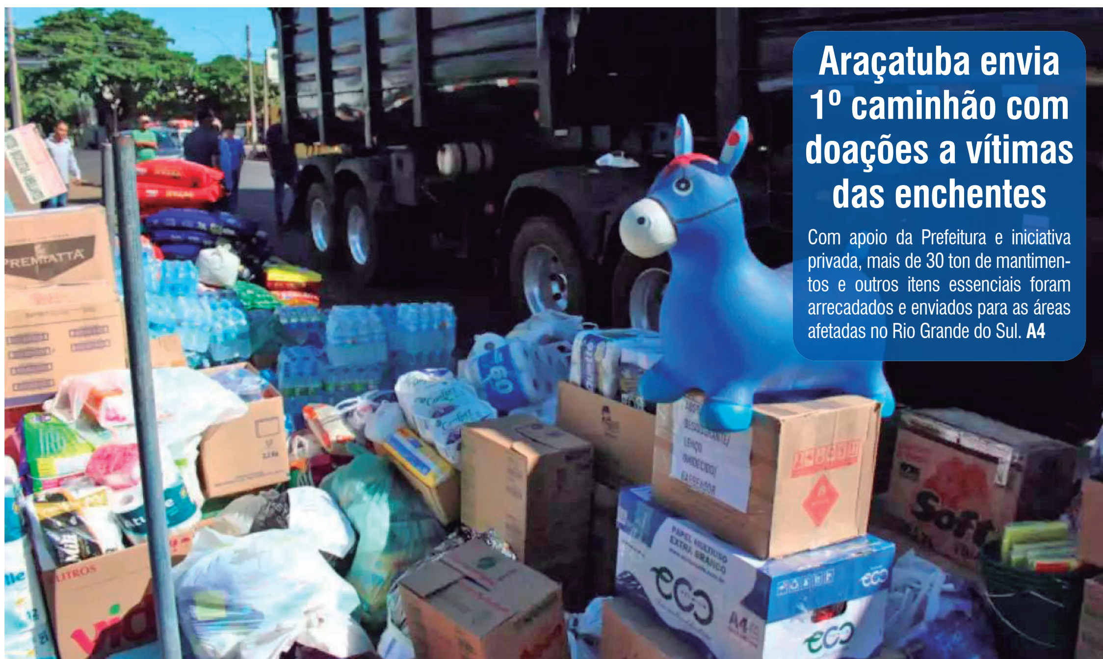
Araçatuba envia 1º caminhão com doações a vítimas das enchentes Com apoio da Prefeitura e iniciativa privada, mais de 30 ton de mantimentos e outros itens essenciais foram arrecadados e enviados para as áreas afetadas no Rio Grande do Sul. A4

A ideia é que o grupo permaneça em atividade até o final desta legislatura, promovendo debates para a elaboração de propostas e o planejamento de ações voltadas a esse público. A3