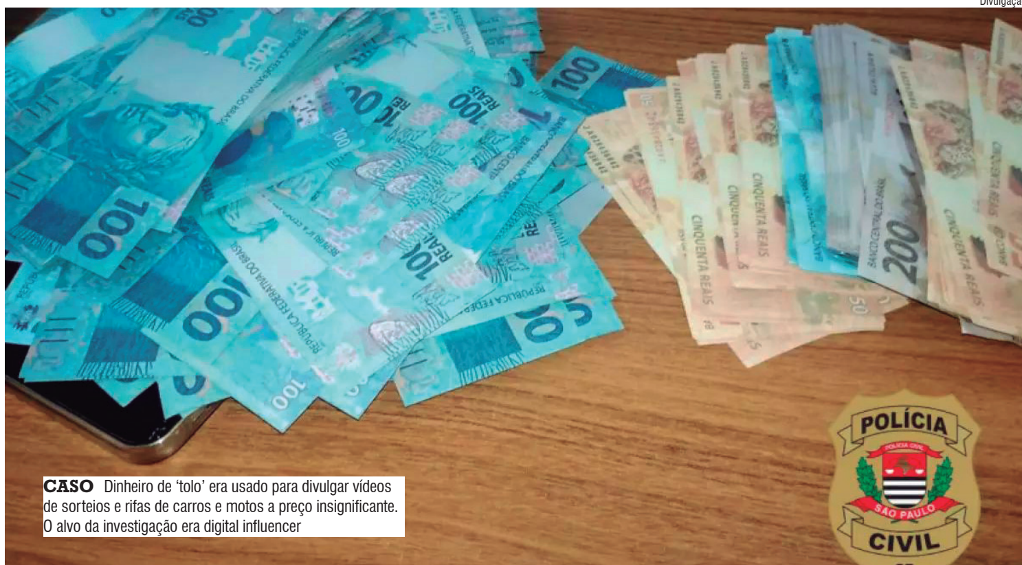
CASO Dinheiro de 'tolo' era usado para divulgar vídeos de sorteios e rifas de carros e motos a preço insignificante. O alvo da investigação era digital influencer

A reportagem apurou que o caso foi fruto de uma investigação pontual, pela Delegacia de Investigações Gerais da Divisão Especializada de Investigações Criminais, DIG/Deic, após uma denúncia que chegou até as equipes, de que o homem promovia rifas e sorteios de diversos prêmios pela internet