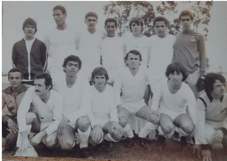
Time em 1974