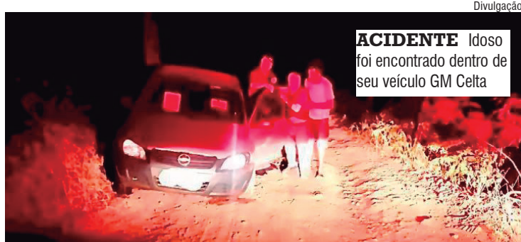
ACIDENTE Idoso foi encontrado dentro de seu veículo GM Celta

Na tarde do último sábado, por volta das 14 horas, os policiais estavam em operação na divisa com o Mato Grosso do Sul, próximo à usina hidrelétrica, como parte da Operação COSUD. Nesse momento, receberam um chamado de ajuda de uma mulher, informando que seu pai, de 80 anos, estava dirigindo e havia caído em uma