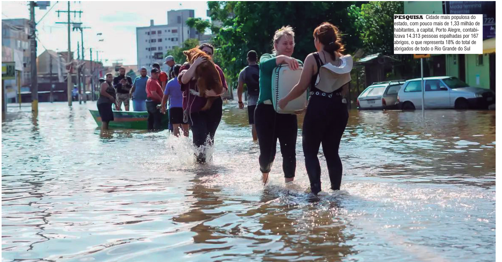
PESQUISA Cidade mais populosa do estado, com pouco mais de 1,33 milhão de habitantes, a capital, Porto Alegre, contabilizava 14.313 pessoas espalhadas por 167 abrigos, o que representa 18% do total de abrigados de todo o Rio Grande do Sul

Cidade mais populosa do estado, com pouco mais de 1,33 milhão de habitantes, a capital, Porto Alegre, contabilizava 14.313 pessoas espalhadas por 167 abrigos, o que representa 18% do total de abrigados de todo o Rio Grande do Sul. Já a segunda cidade mais populosa,