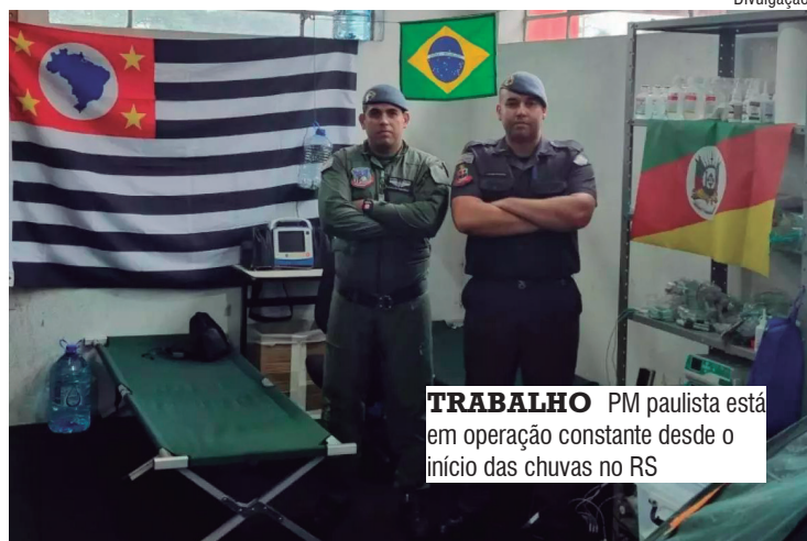
TRABALHO PM paulista está em operação constante desde o início das chuvas no RS

O tenente partiu para São Paulo no dia 9, seguindo para Porto Alegre (RS), no dia seguinte. Ao chegar, assumiu o posto de um outro oficial de saúde da Polícia Militar de São Paulo que já estava atuando há