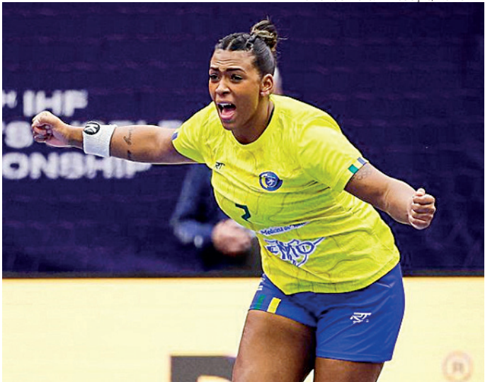
Brasil venceu a Eslovênia por 29 a 23, na casa das adversárias

As brasileiras começaram o primeiro tempo com tudo, abrindo vantagem de três pontos de diferença. O bom sistema defensivo e as tran-