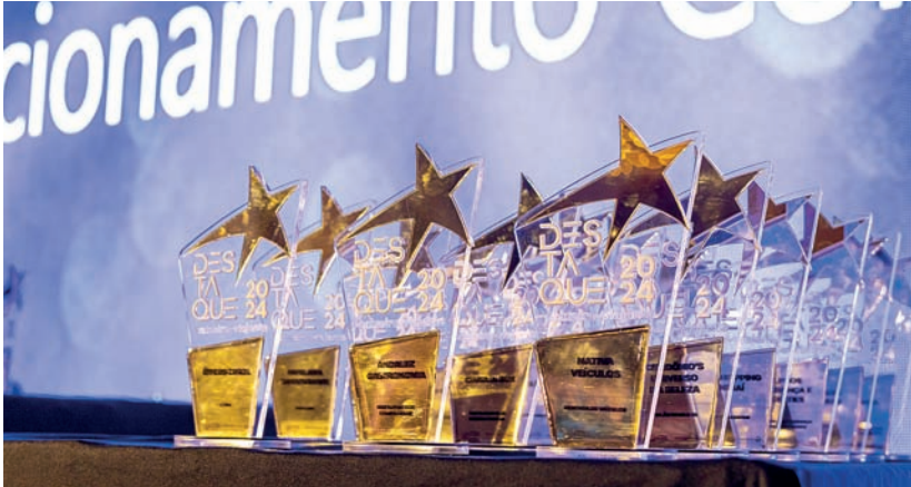
O Troféu entregue para as 74 categorias empresariais