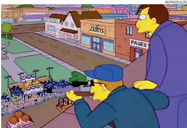
Cena de episódio de 'Os Simpsons' que não foi ao ar

A emissora britânica Channel 4 cancelou a exibição de um episódio do desenho "Os Simpsons", no último domingo (14). A mudança na programação aconteceu um dia após Trump sofrer um atentado num comício, nos Estados Unidos. Intitulado "Lisa the Iconoclast", o episódio estava programado para ir ao ar às 13h. Em uma de suas cenas, a personagem Lisa discursa no pódio de um comício e é se torna a mira de um atirador. O episódio nem cita, nem faz referências a Trump. Mesmo assim, a emissora suspendeu a exibição.