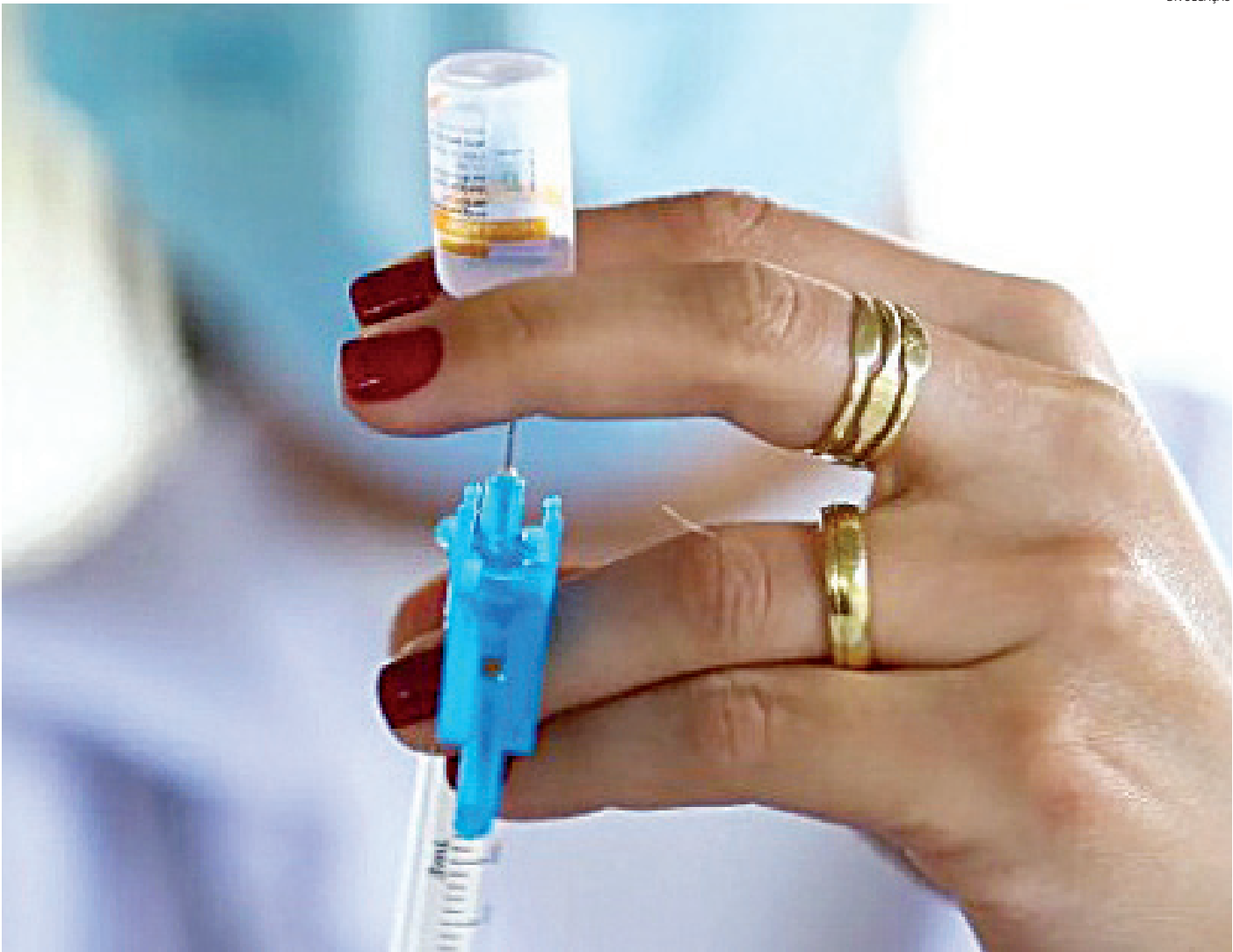
A vacina do HPV é aplicada em crianças e adolescentes de nove a 14 anos, além, agora, de pessoas que fazem uso da PrEP

O usuário de PrEP pode se vacinar contra o HPV em qualquer Unidade Básica de Saúde (UBS), desde que apresente qualquer tipo de comprovação de que realiza o tratamento, como formulário de prescrição do imunizante, prescrição de PrEP, cartão de seguimento,