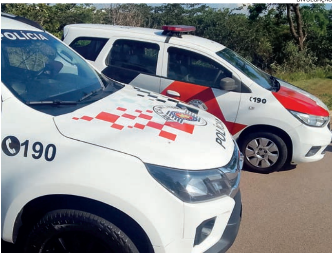
PMS agiram rápido e conseguiram prender um suspeito