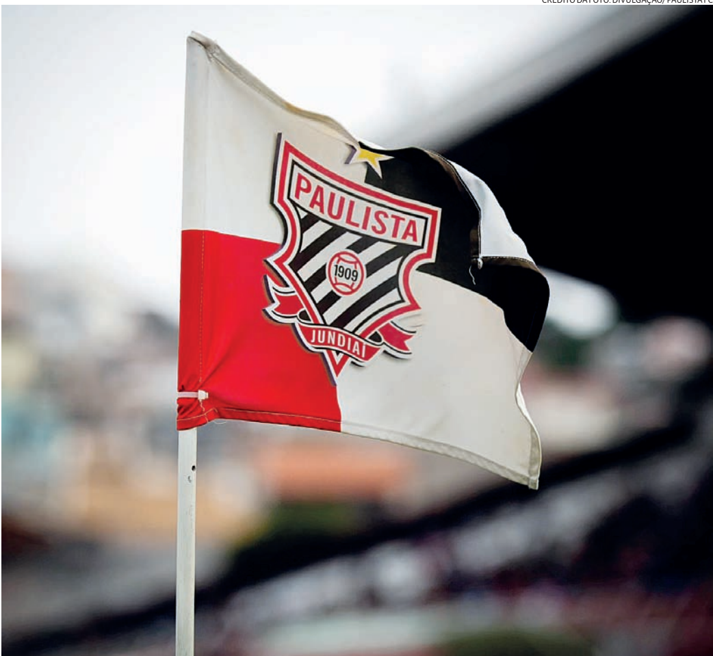
Todos os jogos serão realizados no Estádio Dr. Jayme Cintra, em Jundiaí