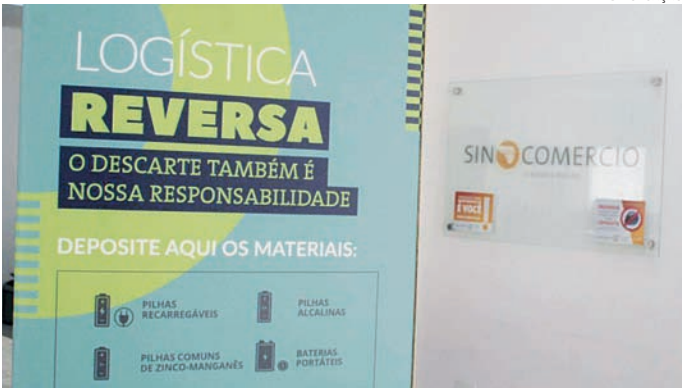
Ambas as entidades pretendem conscientizar os empresários do setor

SERVIÇO Workshop ESG e Logística Reversa para o varejo Quando: 24 de julho Horário: 8h30 às 11h Onde: Sesc Jundiaí- Av. Antônio Frederico Ozanan, 6600 — Jardim Botânico, Jundiaí- SP Inscrições: https://www.sympla.com.br/evento/esg-e-logistica-reversa-para-o-varejo/2513385 Evento presencial, gratuito e vagas limitadas