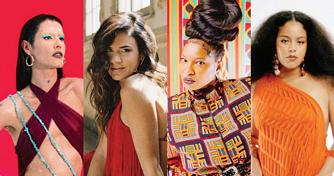
O line-up do evento é 100% feminino e a proposta trará diversos estilos musicais para embalar o público