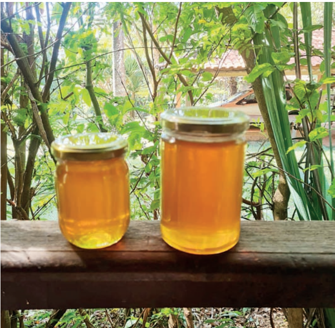
No Brasil, é natural que a população identifique o mel como medicinal