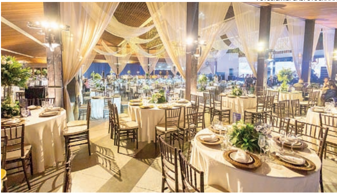
Decoração luxuosa no salão do Clube Jundiaense