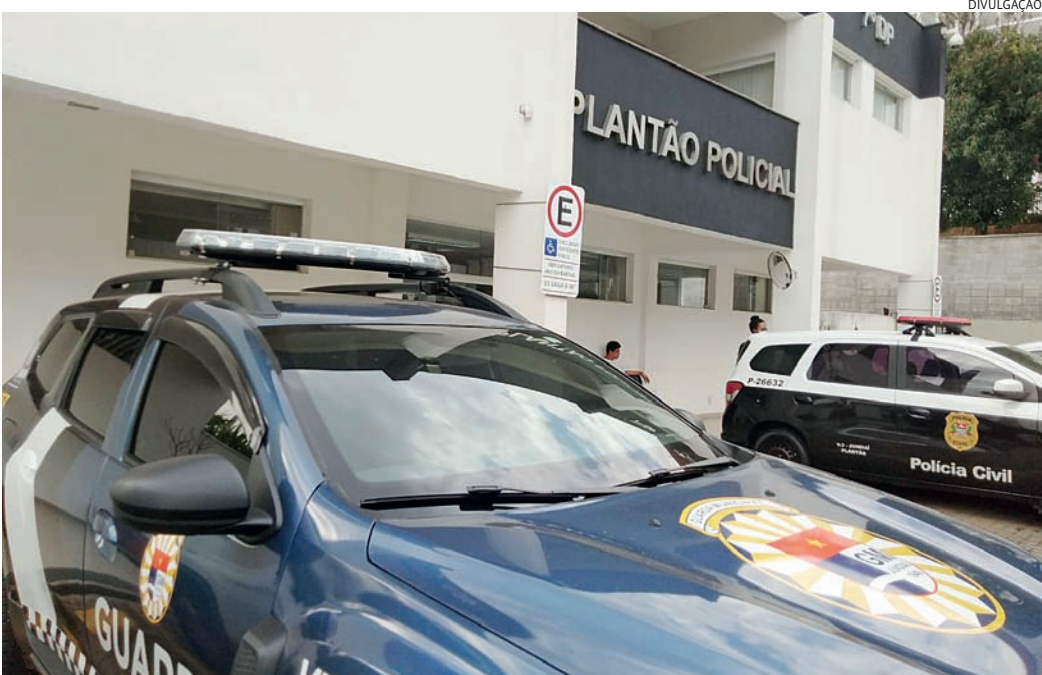
Eles foram conduzidos por GMs ao Plantão Policial, onde o delegado prendeu os três

No caso desta tarde, em Jundiaí, no decorrer da suposta manutenção, os suspeitos informaram ao barbeiro que a mola da porta havia se rompido e quebrado, e que para arrumar ficaria em torno de R$ 800. Sem que a vítima autorizasse, eles saíram do local com a peça e voltaram cerca