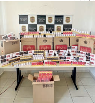
Os cigarros foram apreendidos pela DIG e serão destruídos

Um homem morador do bairro Horto Santo Antônio, em Jundiaí, foi preso por descaminho, nesta terça-feira (16). A prisão foi feita por policiais da Delegacia de Investigações Gerais (DIG), que encontraram em seu carro e em sua casa, quase 3 mil maços de cigarros trazidos do Paraguai. Por conta do tipo de crime, foi arbitrada fiança de R$ 3 mil, com base na lei, que ele pagou e recebeu o benefício da liberdade provisória. Ele vinha sendo alvo de investigações da DIG por possível distribuição de cigarros eletrônicos e, nesta terça, os policiais obtiveram informa-