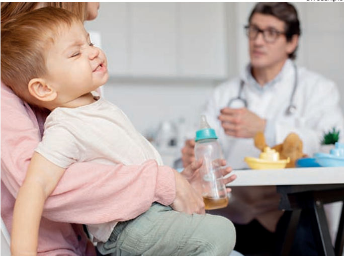
Acidentes mais frequentes são com medicamentos e produtos de limpeza

Entre os principais sintomas que ajudam a identificar uma intoxica-