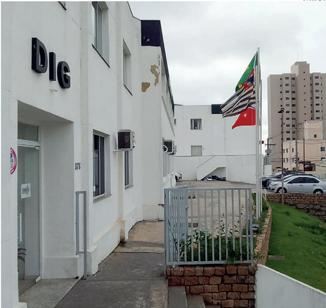
O delegado da DIG já fez o pedido de prisão preventiva do suspeito do crime

eles foram juntos ao evento, no mesmo carro.