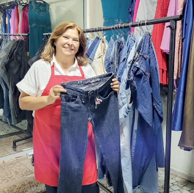
Roupas e outros itens podem ser entregues às quartas-feiras