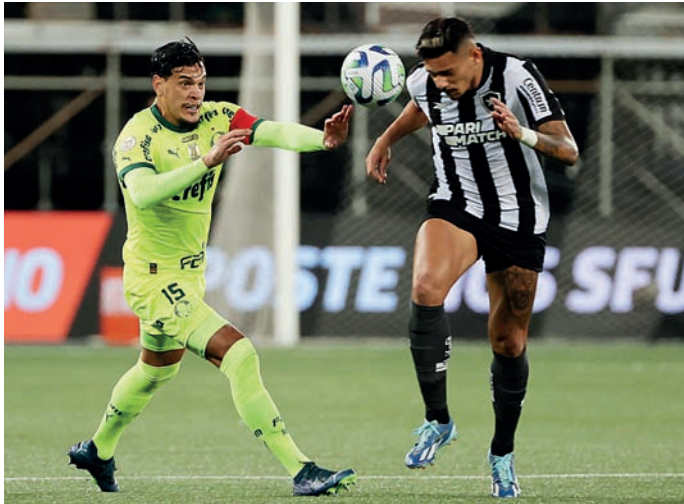
O duelo coloca frente a frente os líderes do Campeonato Brasileiro

Por outro lado, segue sem o meio-campista Richard Ríos, que terá uns dias antes de se juntar ao elenco