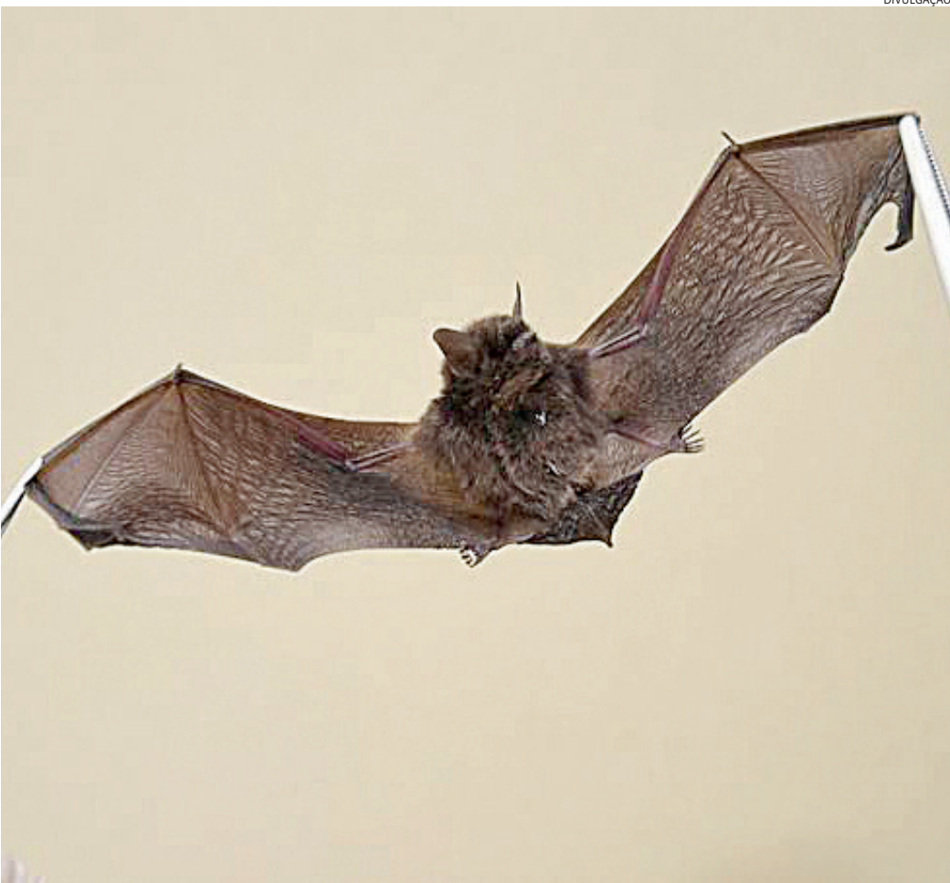
A Vigilância em Saúde Ambiental recomenda que munícipes imobilizem animal e notifiquem ao 156

para fugir de ameaças em seus habitats - e apesar de os morcegos serem os principais vetores de raiva ao ser humano, há outros mamíferos que transmitem a doença. “Cada vez mais há animais indo para as cidades procurando refúgio, e isso de certa forma desequilibra o ecossistema, porque acaba havendo uma ‘invasão’ de doenças em ambientes onde elas não existiam.” MUNICÍPE ATIVO Por outro lado, segundo o veterinário, o aumento crescente de casos positivos de raiva revela uma participação mais ativa dos cidadãos, que têm notificado a presença de animais silvestres no cenário urbano. Essa é a recomendação caso o munícipe se depa-