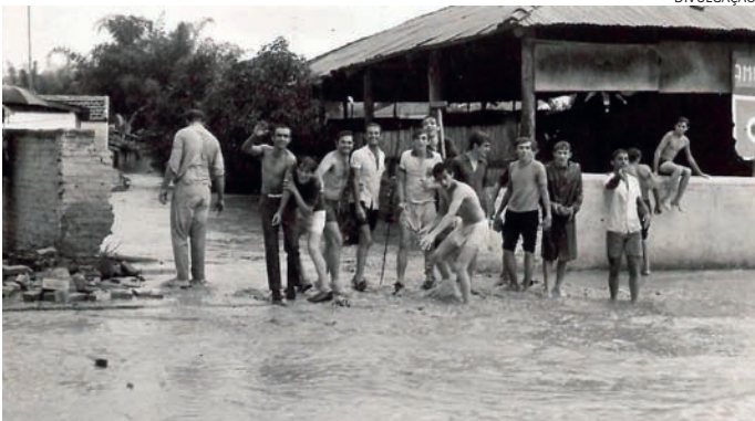
Em 1972, uma enchente no Bairro da Colônia, próximo ao Bar Amigos

Você sabia que Jundiaí pode revelar segredos de seus bairros mais tradicionais? O JJ resolveu criar uma série de matérias que trazem as histórias de alguns bairros da cidade; e, em nossa primeira parada, embarcamos em uma jornada pelo tempo para desvendar as curiosidades e a evolução do Bairro Colônia, um pedacinho acolhedor que pulsa no coração do município. A história do bairro começa com o processo de industrialização de Jundiaí, que acompanhou as vias de circulação. Com o fim do trabalho escravo no Brasil, os grandes senhores da terra de São Paulo passaram a investir na mão de obra dos imigrantes europeus, que fugiam dos horrores da guerra. Jundiaí re-