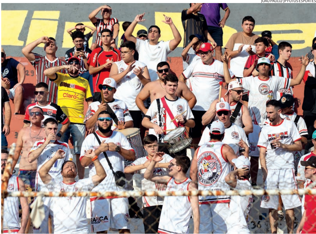
Em caso de vitória, o Galo ficará muito próximo da classificação para o mata-mata