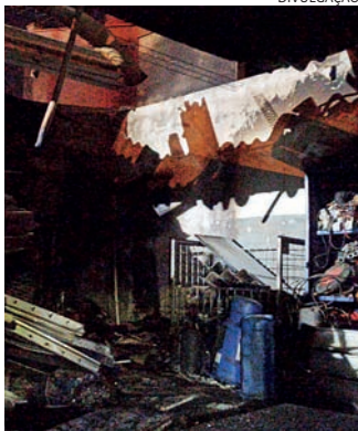
Os bombeiros evitaram um estrago ainda maior no local

Diante dos fatos, a equipe deu voz de prisão ao suspeito e o conduziu à delegacia, onde o delegado o prendeu em flagrante por tráfico de drogas.