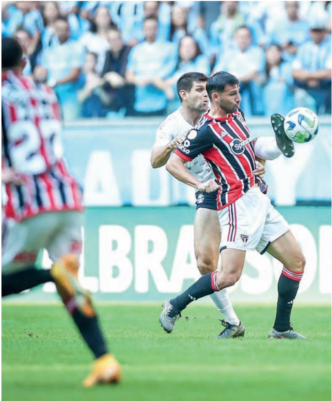
Na história do confronto, o São Paulo venceu 34 vezes e o Grêmio 32

Do outro lado, o Grêmio deseja sair da zona de rebaixamento do Brasileirão. Em má fase, a equipe respirou