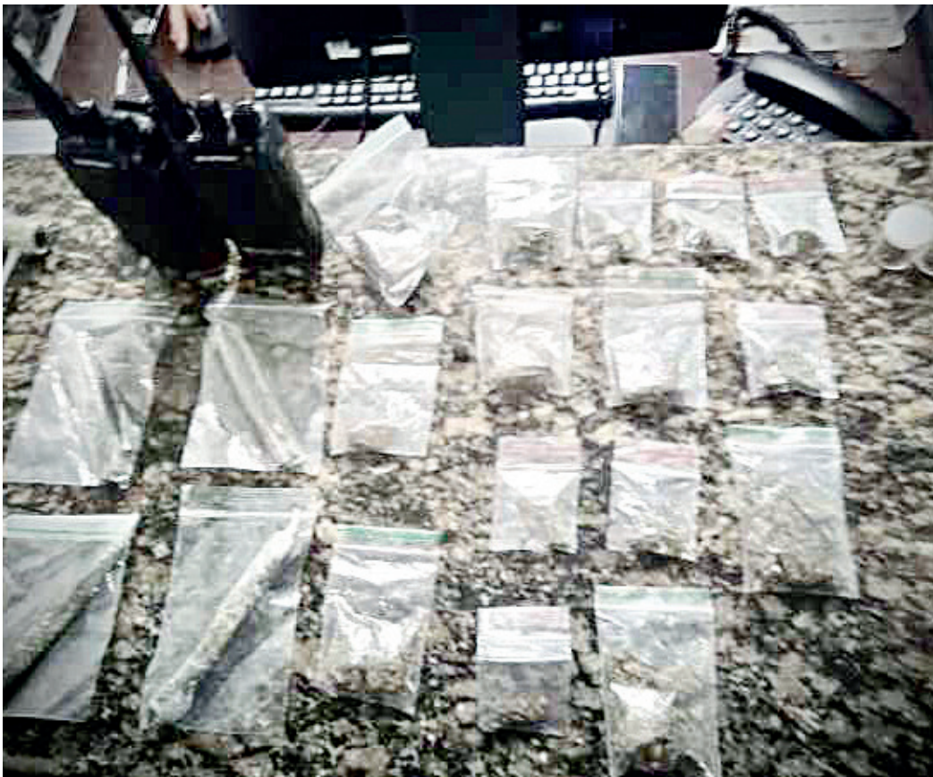
As drogas foram apreendidas e o suspeito foi preso pelos agentes

Guardas municipais apreenderam drogas, radiocomunicadores e outros itens relacionados ao tráfico e uso de drogas, no bairro Jardim Vitória, em Campo Limpo Paulista.