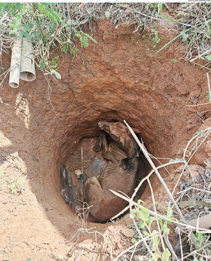
O animal ficou preso por algumas horas até ser resgatado

Após isso os tutores ficaram responsáveis pelos cuidados posteriores.