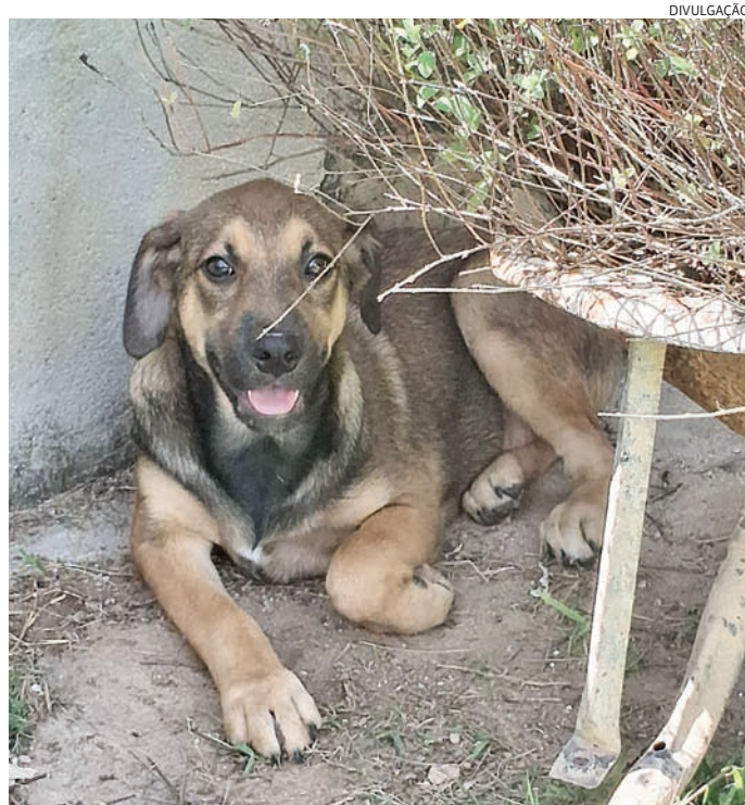
É uma luta conseguir 60 kg de ração diariamente, diz protetora

Ela ainda destaca os gastos com veterinários, medicação de uso contínuo e produtos de limpeza. Além disso, outro problema recorrente é a indiferença com os cães mais idosos do abrigo, que são “segunda