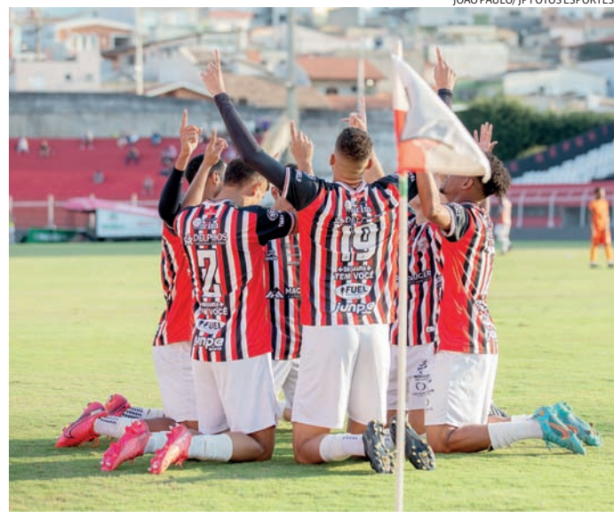
Embalado, o Paulista está invicto há três jogos e vem de vitória

Embalado, o Paulista está invicto há três jogos e vem de uma vitória de virada contra o Ecus, fora de casa, por 2 a 1, na última rodada. O time comandado pelo técnico Fausto Dias ocupa a vice-liderança do Grupo 6, com sete pontos, e está atrás da Inter de Bebedouro, com 12 pontos e invicta na segunda fase. Abaixo do Galo estão Manthiqueira,