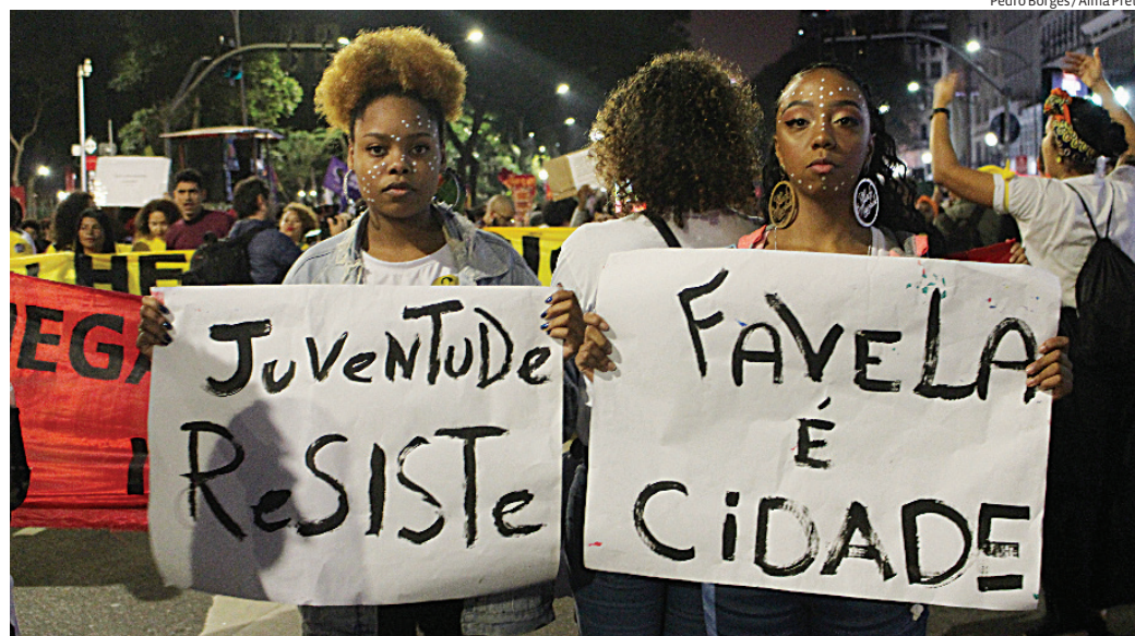
Marcha das Mulheres Negras, Latinoamericanas e Caribenhas