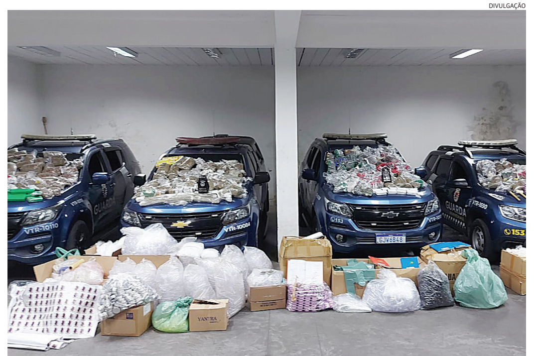
A droga foi levada para a Dise, onde a ocorrência foi apresentada

A ocorrência foi apresentada na Delegacia de Investigações Sobre Entorpecentes (Dise), que vai investigar o caso.