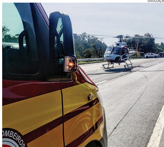
Os Bombeiros prestaram o primeiro atendimento e o Águia socorreu

O acidente, que ocorreu no km 52, envolveu a moto da vítima e um carro. O motociclista fraturou os dois fêmures e o quebrou também o pé, motivo pelo qual foi necessário socorro do Águia.