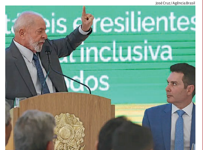
Prioridade são projetos para localidades com vazios assistenciais

O presidente Luiz Inácio Lula da Silva apresentou, nesta sexta-feira (26), o resultado do Novo Programa de Aceleração do Crescimento (PAC) Seleções, com destaque para obras de mobilidade e de drenagem urbana, este último visando a prevenção de desastres naturais. No anúncio de ontem, foram contemplados programas nos eixos cidades sustentáveis e resilientes, infraestrutura social inclusiva e do programa Água Para Todos, com R$ 41,7 bilhões em investimentos. Ao discursar, Lula reafirmou que a prioridade na escolha das obras do PAC Seleções, voltado para atender projetos apresentados por estados e municípios, é para localidades críticas e com vazios assistenciais, em benefício da população, independente de simpatia e filiação políticas entre os mandatários.