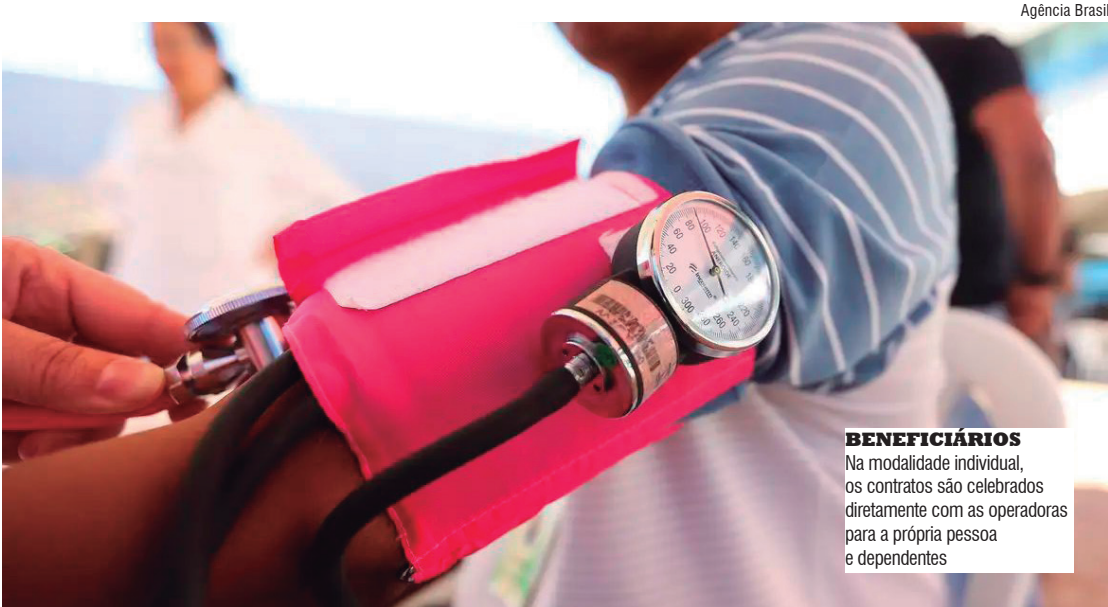
BENEFICIÁRIOS Na modalidade individual, os contratos são celebrados diretamente com as operadoras para a própria pessoa e dependentes

CÁLCULO Para chegar à variação máxima permitida, a ANS aplica, desde 2019, uma metodologia que leva em conta duas variáveis: o Índice de Valor das Despesas Assistenciais (IVDA) e o Índice Nacional de Preços ao Consumidor Amplo (IPCA), considerado a inflação oficial do país, já descontado