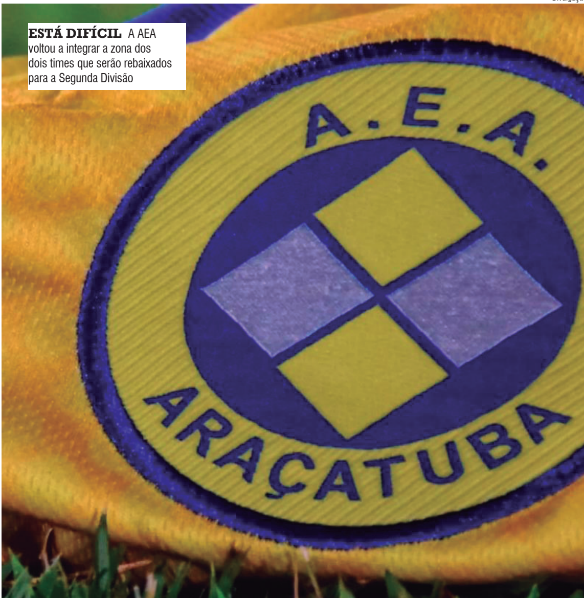
ESTÁ DIFÍCIL A AEA voltou a integrar a zona dos dois times que serão rebaixados para a Segunda Divisão

Já o Penapolense empatou em casa com a até então líder Internacional de Bebedouro, por 0 a 0, no sábado à noite. O jogo no Tenente Carriço foi de dificuldades para o CAP logo no início, já que aos 12 minutos o goleiro Saldanha foi expulso após tocar a bola com a mão fora da área.