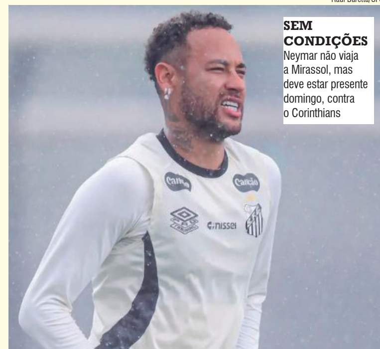
SEM CONDIÇÕES Neymar não viaja a Mirassol, mas deve estar presente domingo, contra o Corinthians

Ele participaria do treinamento de ontem com os atletas não relacionados. De acordo com as informações da comissão técnica, a tendência é de que o meia-atacante esteja à disposição para o clássico contra o Corinthians, no próximo domingo, na Vila Belmiro.