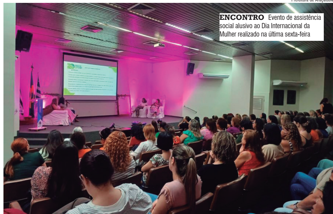
ENCONTRO Evento de assistência social alusivo ao Dia Internacional da Mulher realizado na última sexta-feira