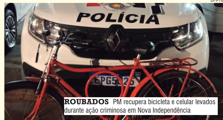
ROUBADOS PM recupera bicicleta e celular levados durante ação criminosa em Nova Independência

Um caso de maus-tratos contra animal doméstico mobilizou a Guarda Municipal e integrantes do Conselho Municipal de Proteção e Defesa dos Animais, na última sexta-feira, em Araçatuba. Uma jovem de 20 anos acabou presa após a denúncia registrada em uma clínica