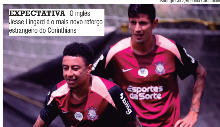
EXPECTATIVA O inglês Jesse Lingard é o mais novo reforço estrangeiro do Corinthians

Apesar disso, o limite não impede novas contratações de atletas estrangeiros. A restrição vale apenas para a quantidade de jogadores que podem ser relacionados para cada partida, o que exige controle da comissão