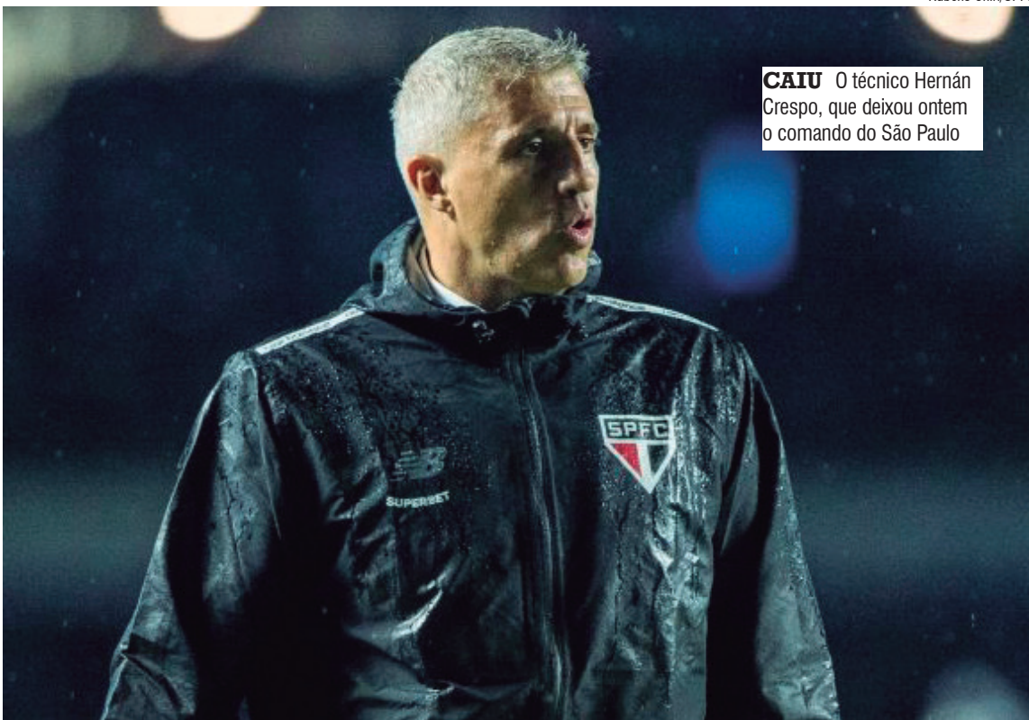
CAIU O técnico Hernán Crespo, que deixou ontem o comando do São Paulo

Campeão paulista em 2021, Crespo iniciou sua segunda passagem pelo São Paulo em julho de 2025. Desde então, dirigiu o time em 46 jogos, acumulando 21 vitórias,