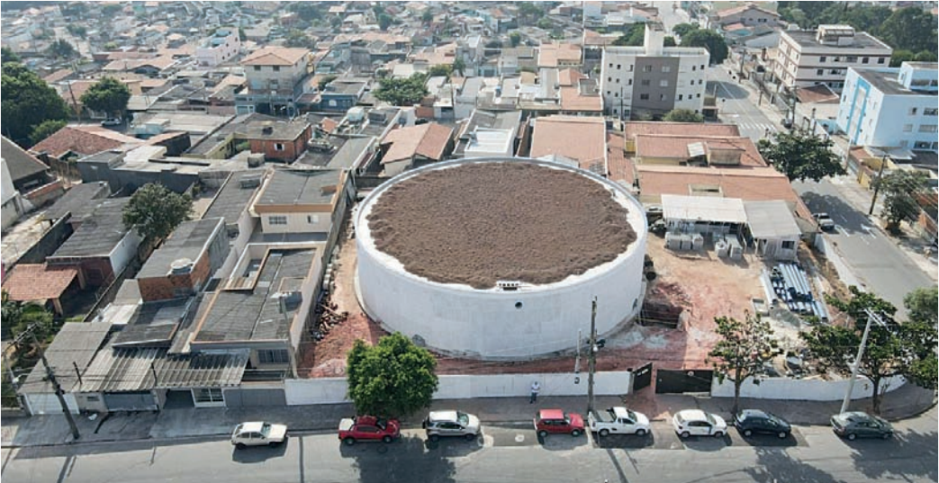
O equipamento vai ampliar a capacidade de armazenamento em mais três milhões de litros de água