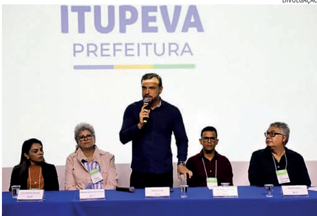
Itupeva realizou 3ª Conferência Municipal da Cidade

A Prefeitura realizou, no último sábado (29), a 3ª Conferência Municipal da Cidade de Itupeva, com o tema “Construindo a Política de Desenvolvimento Urbano: caminhos para as cidades inclusivas, democráticas, sustentáveis e com justiça social”. Essa é a primeira etapa para a conferência nacional, que tem, ainda, uma etapa estadual. A conferência foi realizada no Cine Teatro Municipal e reuniu autoridades e munícipes, que participaram de palestras e rodas de discussão que definiram as propostas que serão levadas para a análise na Conferência Estadual das Cidades.