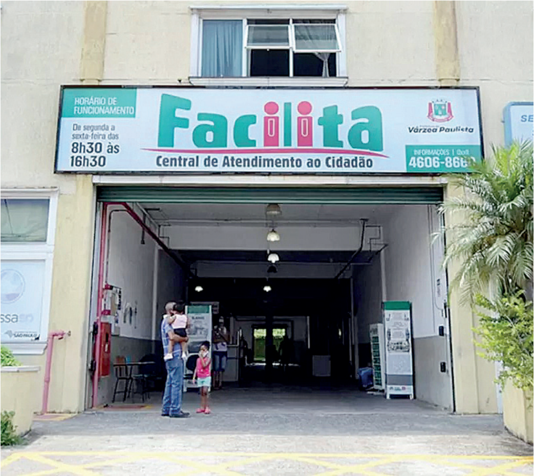
Interessados devem realizar o cadastro até o dia 31 de julho, no Facilita