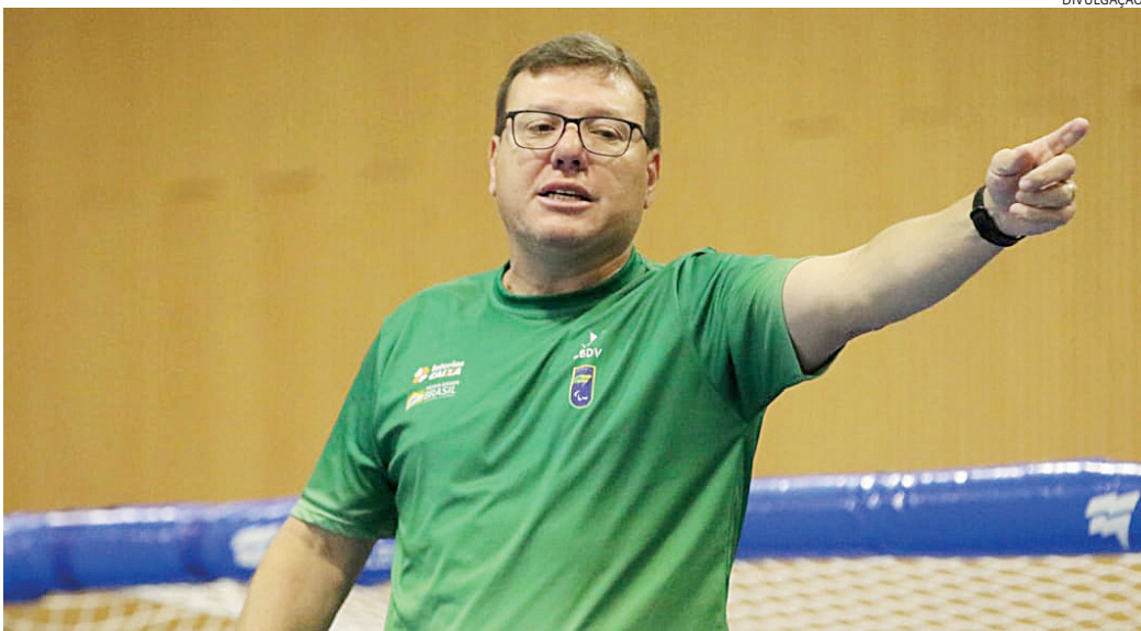
Tosim quer conquistar uma medalha inédita em uma paralimpíada com a seleção feminina

O técnico comandou o Brasil em três participações de Paralimpíadas e subiu ao