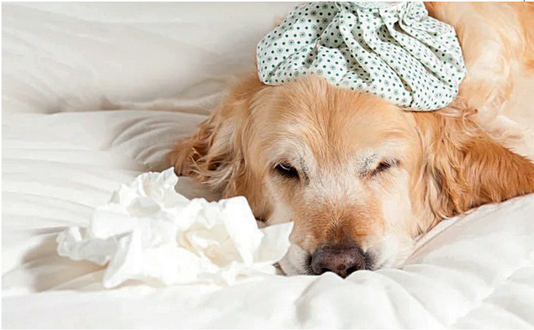
Não é apenas gripe, mas também pneumonia e tosse; essas são doenças que aparecem em época de frio