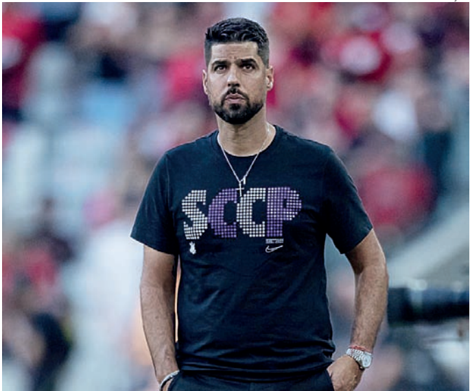
O Corinthians demitiu o treinador na tarde de ontem