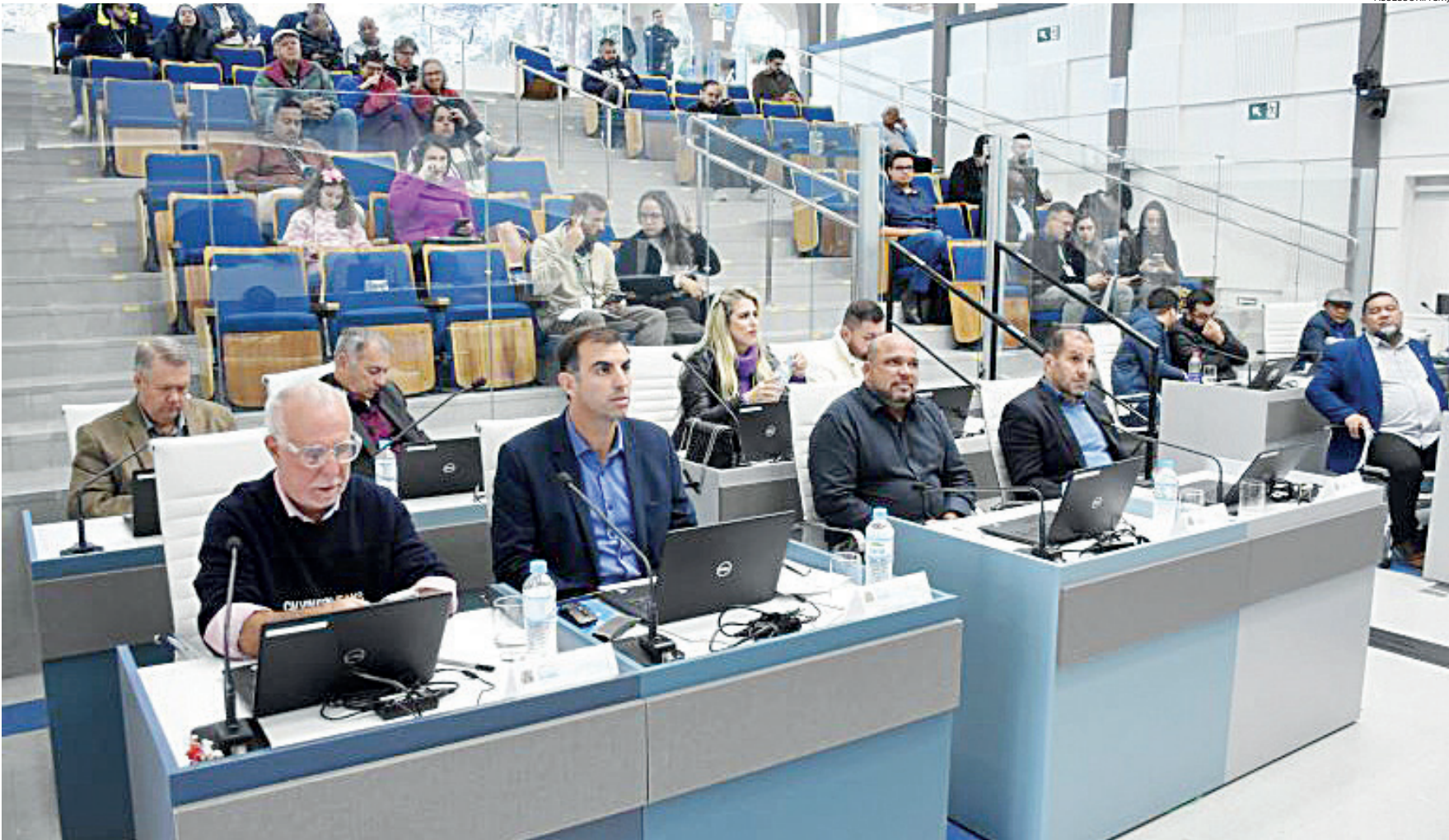
Sessão ordinária realizada ontem (02) no plenário da Câmara de Jundiaí contou com a aprovação da Lei de Diretrizes Orçamentárias para o exercício de 2025

E o Projeto de Lei nº 14415/2024, de autoria do