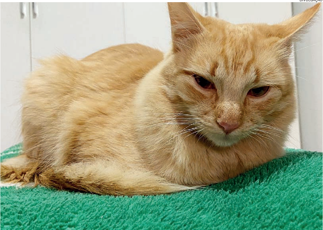
Os felinos merecem atenção especial, pois não respiram pela boca

te essas épocas.” Os felinos merecem atenção especial, pois não respiram pela boca. “Se seu gato está respirando pela