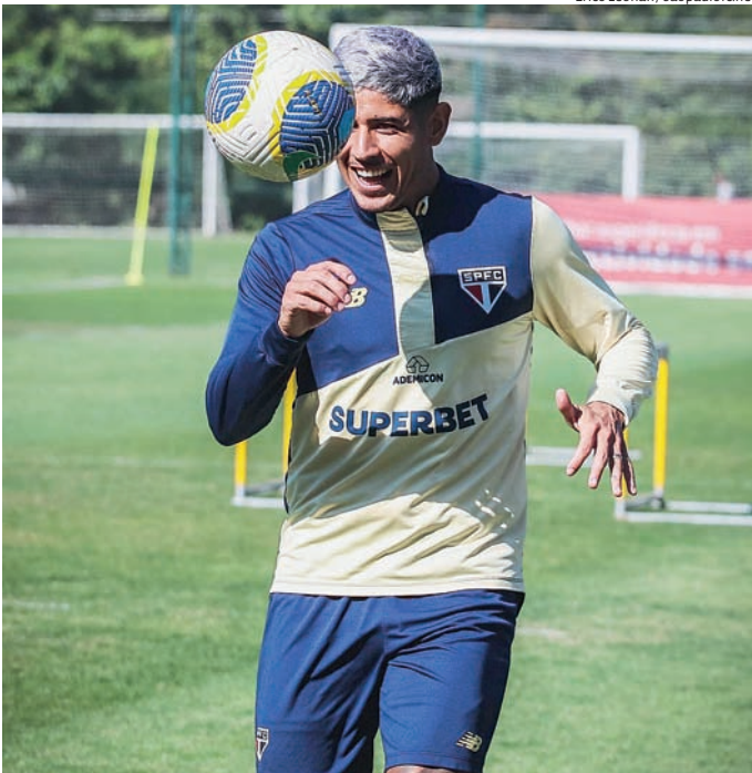
O São Paulo atualmente é o sexto colocado da tabela do Brasileirão