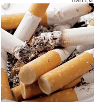
Proposta é ajudar mais de 750 milhões de usuários de tabaco

Dentre as diretrizes, a entidade recomenda o uso de vareniclina, medicamento que tem a função de diminuir o desejo intenso de fumar,