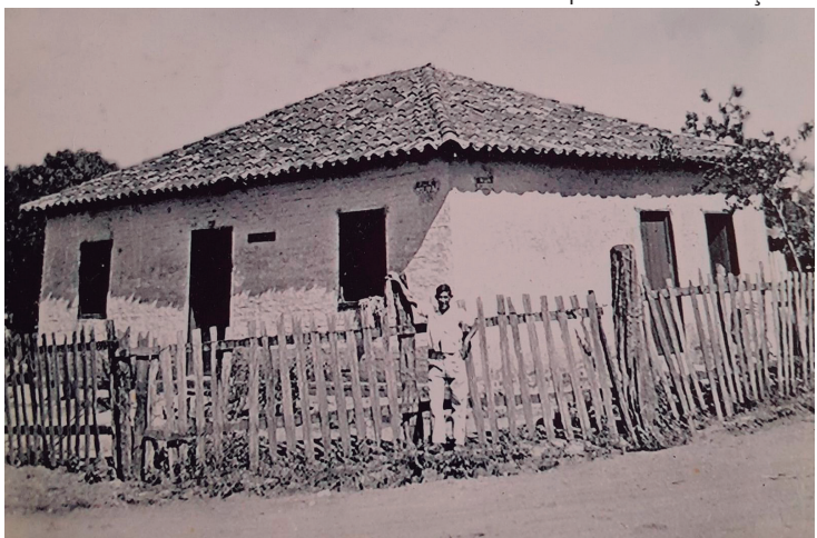
Grupo Memórias de Araçatuba

Com a aproximação das eleições, é importante que os eleitores cobrem planos reais para mitigar os riscos. Está nas mãos de cada cidadão a solução para este problema tão grave e urgente.