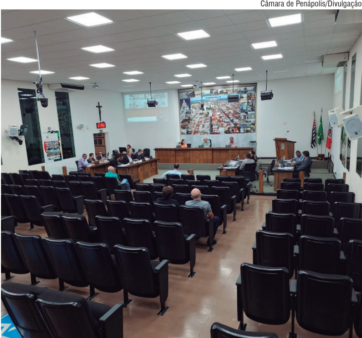
CALENDÁRIO Vereadores aprovam mudança de recesso

decorrentes das restrições impostas pelo período eleitoral, garantindo assim que o legislativo possa atuar de forma mais eficiente durante esse período crítico. De acordo com os vereadores locais, a aprovação da medida reflete uma preocupação com a eficácia do trabalho legislativo e a necessidade de adaptação às exigências específicas dos anos eleitorais. Na prática, eles temem que uso da tribuna, votações e pedidos sejam confundidos com atos eleitorais, evitando, assim, possíveis punições.