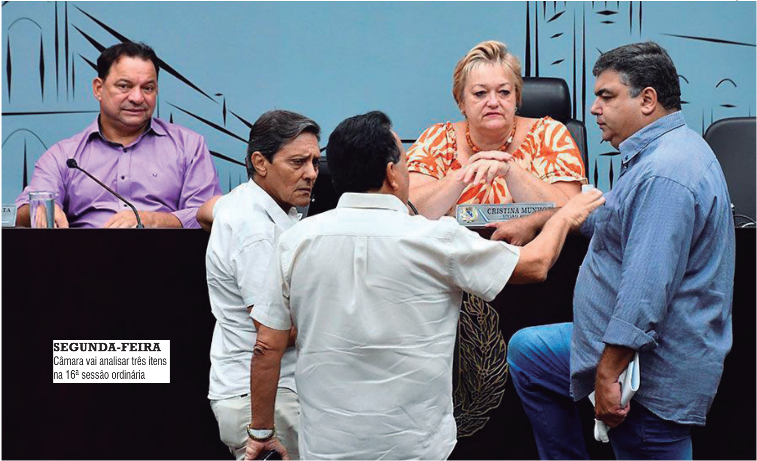
SEGUNDA-FEIRA Câmara vai analisar três itens na 16ª sessão ordinária