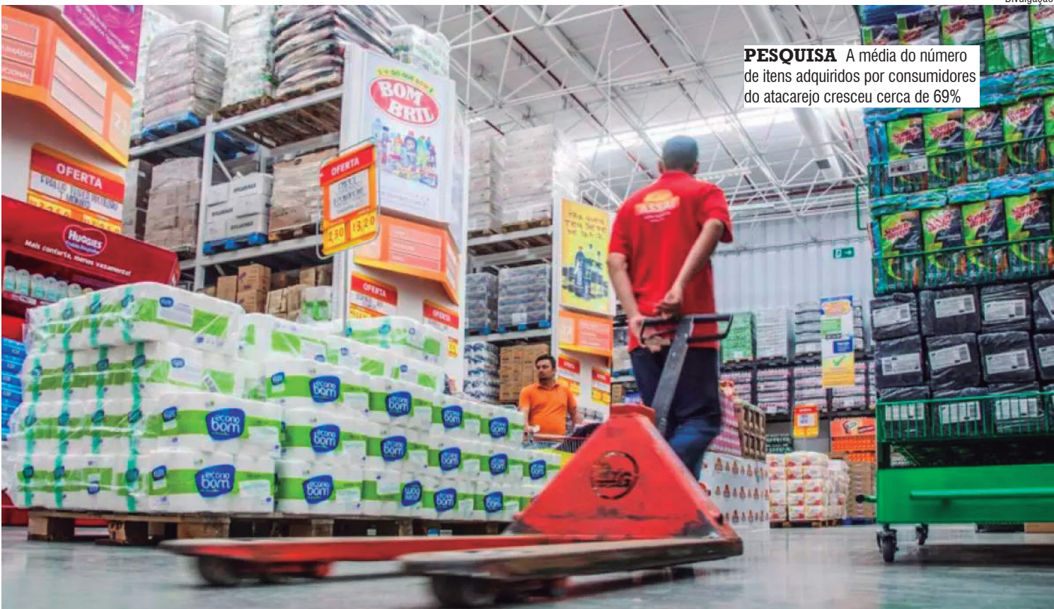
PESQUISA A média do número de itens adquiridos por consumidores do atacarejo cresceu cerca de 69%

O nome “gruda” fácil na cabeça e é autoexplicativo. Nos últimos anos, o atacarejo se tornou um modelo de negócio promissor no setor supermercadista. A estratégia une preços baixos e grandes quantidades do atacado. Em Araçatuba, são quatro lojas do tipo, que ocupam cada vez mais espaço na venda de alimentos. Segundo uma pesquisa da Abras (Associação Brasileira de Supermercados), o atacarejo é o canal mais procurado para abastecimento dos lares. De acordo o levantamento, esse modelo de abastecimento foi responsável por 47,3% da receita total do setor supermercadista - em cifras, significa R$ 695,7 bilhões injetados na economia. Os dados são referentes ao fim