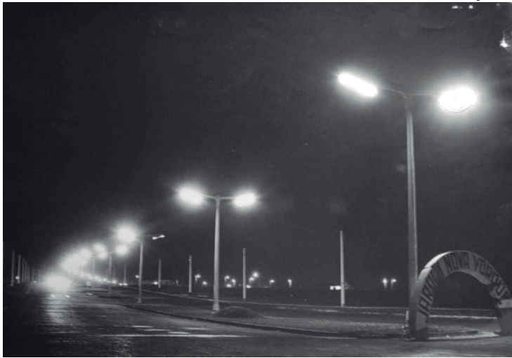
Grupo Memórias de Araçatuba

“A grande utilidade do purificador é viabilizar água potável para os abrigos que não têm água potável. Boa parte dos abrigos pode ter água potável. Então, 220 purificadores, na nossa avaliação, serão suficientes para suprir a demanda por água potável nesses abrigos, que estão concentrados, na sua grande maioria, aqui na região metropolitana”, acrescentou o ministro. Agência Brasil