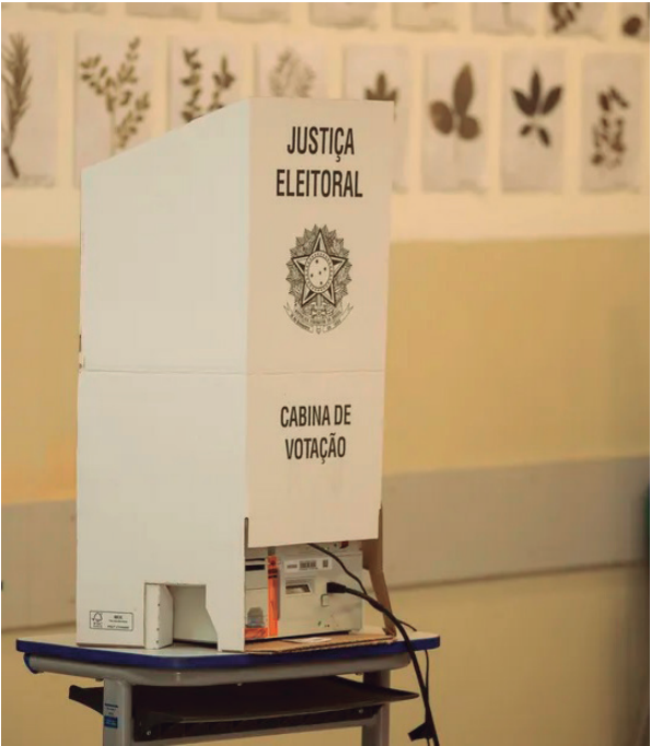
AUSÊNCIA Em Araçatuba, 34.950 eleitores optaram por não

A abstenção não é apenas uma estatística. É uma realidade que pode ter um impacto significativo nos resultados eleitorais, especialmente nas eleições para o Legislativo. Cada voto conta, e a decisão de milhares de eleitores em não participar pode alterar o curso de uma eleição, dando peso a uma minoria silenciosa que, por sua ausência, influencia o resultado. Diante desse cenário, os políticos precisam se empenhar em não apenas conquistar votos, mas também em mobilizar e engajar os eleitores, mostrando a importância de sua participação ativa no processo democrático.