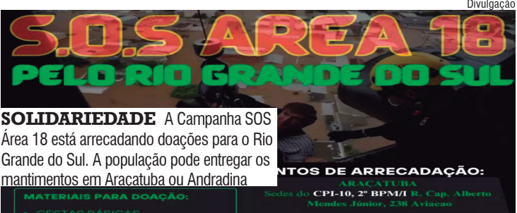
SOLIDARIEDADE A Campanha SOS Área 18 está arrecadando doações para o Rio Grande do Sul. A população pode entregar os mantimentos em Araçatuba ou Andradina