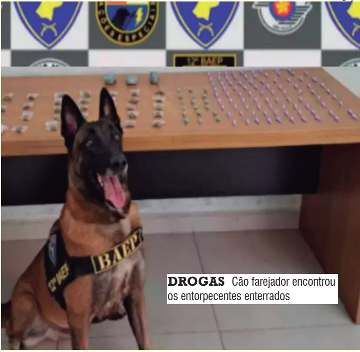
DROGAS Cão farejador encontrou os entorpecentes enterrados

Equipes do 12º Baep (Batalhão de Ações Especiais de Polícia Militar) do Estado de São Paulo realizaram uma busca por drogas no bairro São José, em Araçatuba, nessa terça-feira, 7. Com apoio do cão farejador Ragnar, os policiais encontraram, em uma área verde, 89 pinos de cocaína, 32 porções de maconha embaladas em ziplock, 18 pedras pequenas de crack e 3 porções médias de maconha, todas elas enterradas. Os entorpecentes e uma mulher suspeita de envolvimento com os mesmos foram encaminhados ao Plantão Policial.