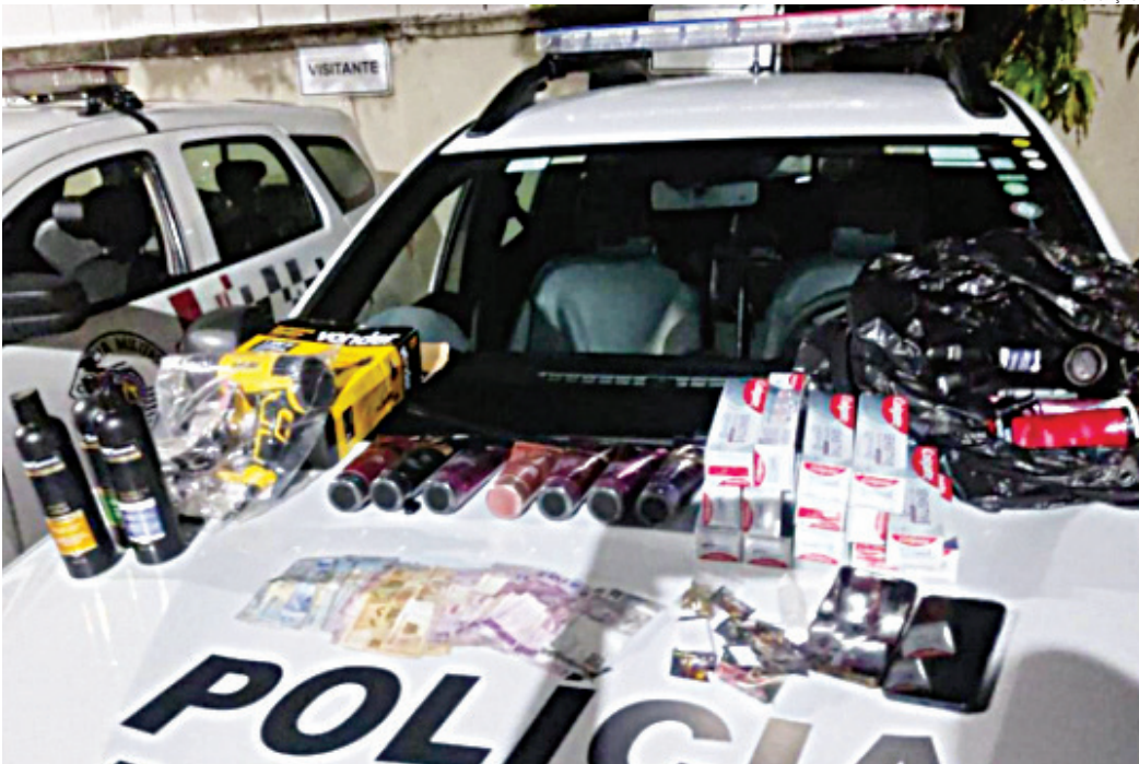
Todo o material foi apreendido durante o registro da ocorrência

Durante a abordagem, os agentes localizaram no bolso do condutor um frasco de lança-perfume, que