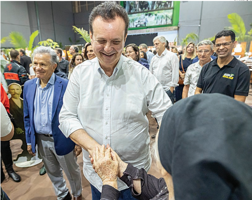
Kassab tem se aproximado e fortalecido as relações e articulações políticas na região

O secretário de Governo e Relações Institucionais do Estado de São Paulo e presidente nacional do PSD, Gilberto Kassab, fortaleceu a sua aproximação com Jundiaí e cidades da região nos últimos meses. O movimento foi demonstrado na quinta-feira (15), durante a cerimônia de abertura da 41ª Festa da Uva e da 12ª Expo Vinhos de Jundiaí, quando Kassab esteve no município representando o governador Tarcísio de Freitas (Republicanos). Na ocasião, Kassab elogiou a tradicional festa e destacou a importância econômica da cidade para o Estado. “Que Jundiaí possa continuar ofertando a todos, por muitos e muitos anos, essa festa que faz tão bem ao povo paulista. São Paulo é a locomotiva do Brasil e Jundiaí tem grande participação por toda a sua riqueza gerada”, afirmou. A presença constante do líder do PSD na região ocorre principalmente após a fi-