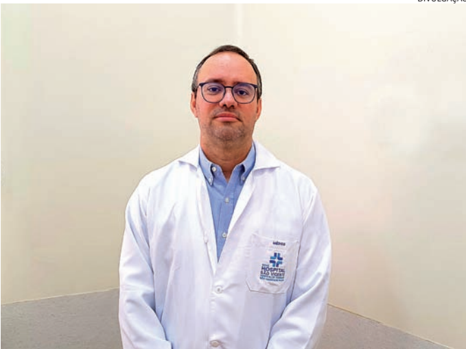
Infectologista diz que o período é marcado por viroses

As viroses respiratórias, como covid-19 e influenza, tendem a diminuir durante o verão, mas não deixam