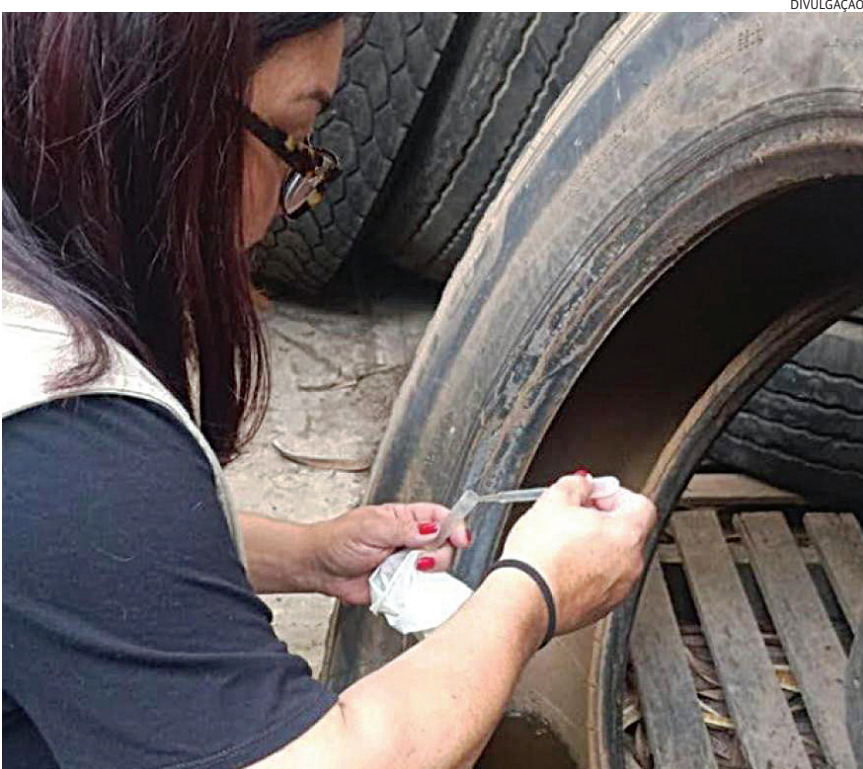
Em Itatiba, os agentes têm feito um trabalho de busca de larvas do mosquito

Embora os sintomas tenham iniciado no dia 3 de janeiro, a data é computada como 2025 para fins epidemiológicos, por ser a semana iniciada no ano passado. Em 2025, o estado de São Paulo teve 881.280 casos confirmados, 1122 óbitos confirmados e 56 em investigação, além de 1461 casos