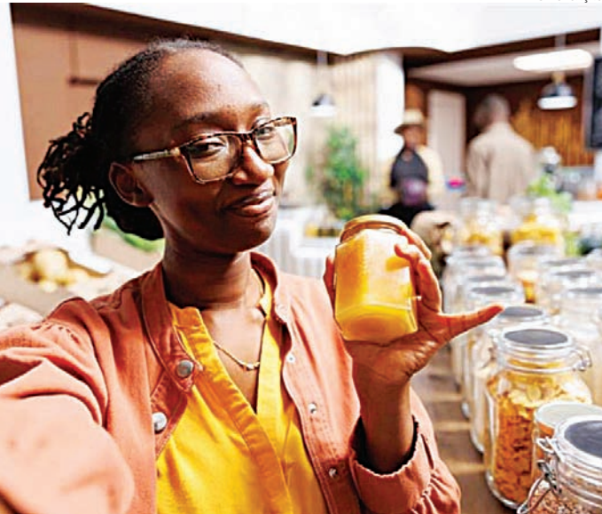
As inscrições para as capacitações podem ser feitas até dia 13 de fevereiro