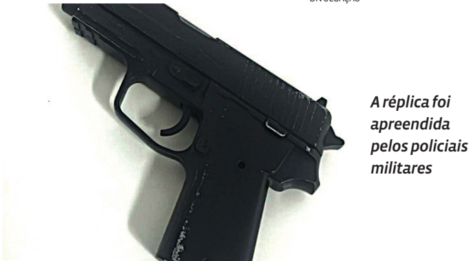
Aréplica foi apreendida pelos policiais militares

O caso será investigado pela Polícia Civil.