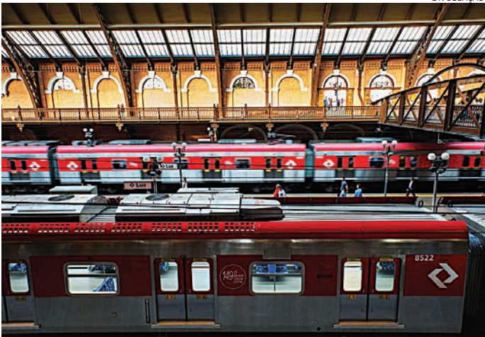
As alterações são necessárias para a realização de manutenção

Os passageiros que utilizam as linhas da CPTM devem ficar atentos às mudanças operacionais que serão realizadas sábado (17) e domingo (18) para a execução de obras de manutenção, melhorias e modernização ao longo da via férrea. No sábado (17), na Linha 10-Turquesa, das 23h até o final da operação, o embarque e o desembarque na Estação Mauá, sentido Palmeiras-Barra Funda, serão feitos pela plataforma 1, e sentido Rio Grande da Serra, pela plataforma 4. Já nas estações Guapituba e Ribeirão Pires, os passageiros devem embarcar e desembarcar pela plataforma 2. Nos dois trechos haverá manutenção preventiva na máquina de chave. Na Linha 11-Coral, das 21h até o final da operação, os passageiros devem utilizar a plataforma 2 da Estação Calmon Viana para embarque e desembarque em