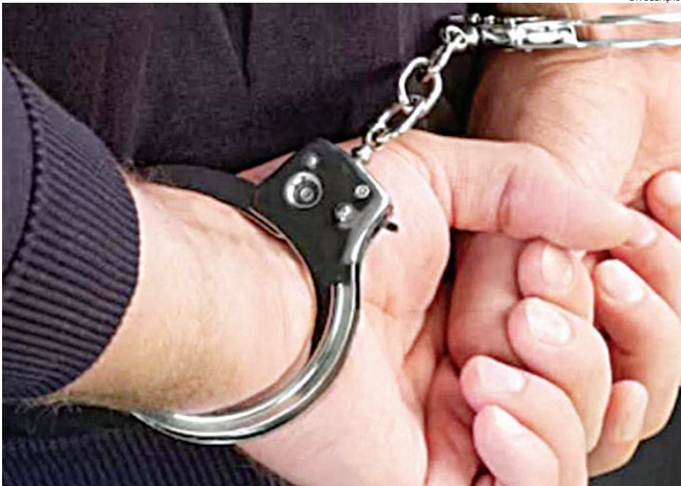
O detento foi levado de volta ao sistema prisional

O detento foi conduzido à delegacia, onde foi dado cumprimento ao mandado de prisão, sendo posteriormente reconduzido ao presídio.