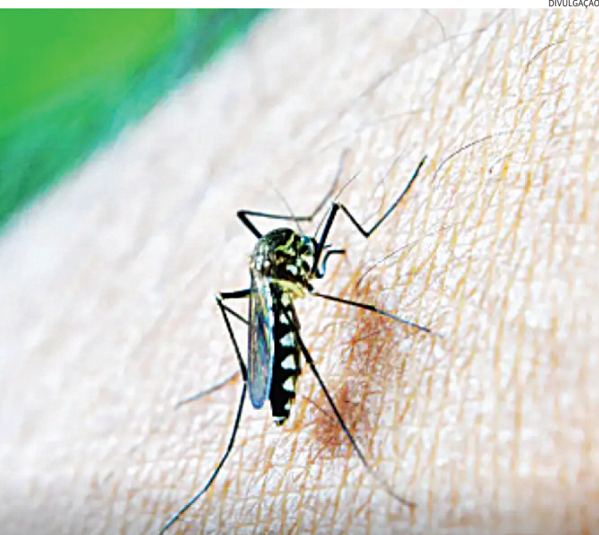
O estado já registra 971 casos confirmados e 3.389 em investigação