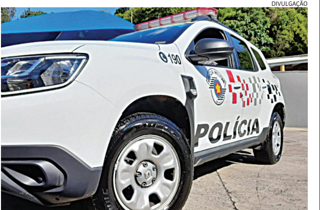
Os PMs levaram o criminoso para o DP, onde ficou à disposição

O homem foi conduzido à delegacia e, posteriormente, reconduzido ao presídio de Guareí.