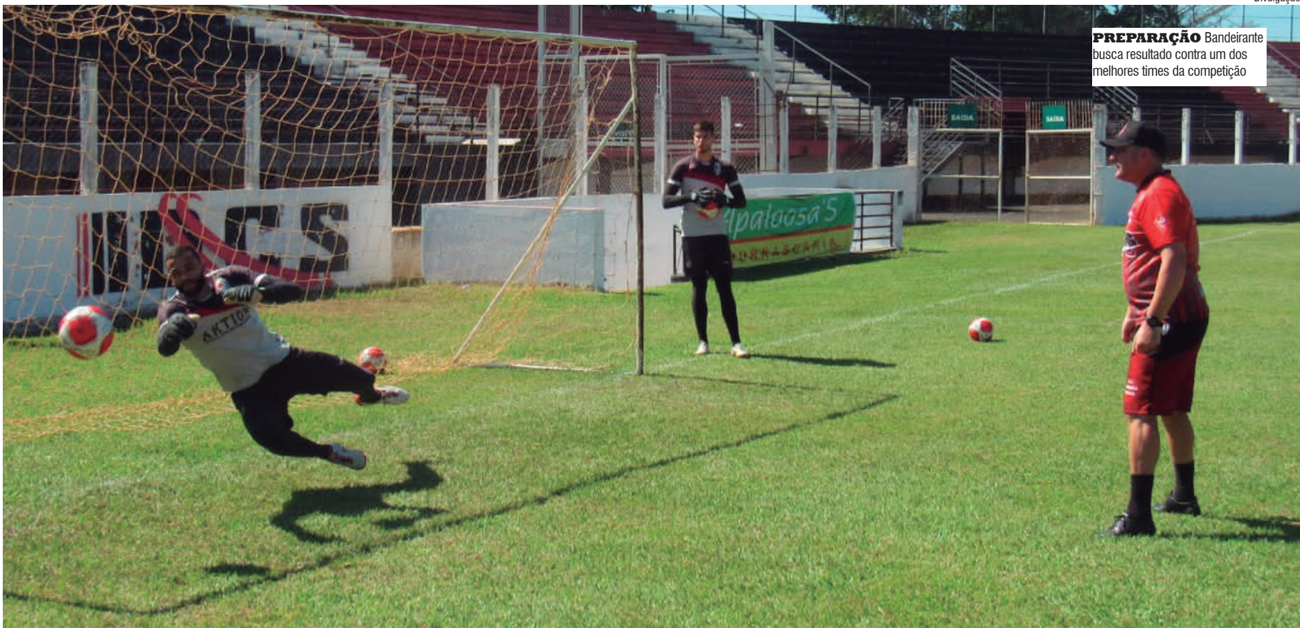
PREPARAÇÃO Bandeirante busca resultado contra um dos melhores times da competição

Com 16 pontos ganhos e na primeira colocação, o Desportivo Brasil recebe o oitavo colocado Red Bull Bragantino II, que tem onze pontos, no estádio Ernesto Rocco, em Porto Feliz, às 15h. De olho nesta partida e torcendo por um tropeço dos donos da casa, estarão EC São Bernardo e Votuporanguense, que podem termi-