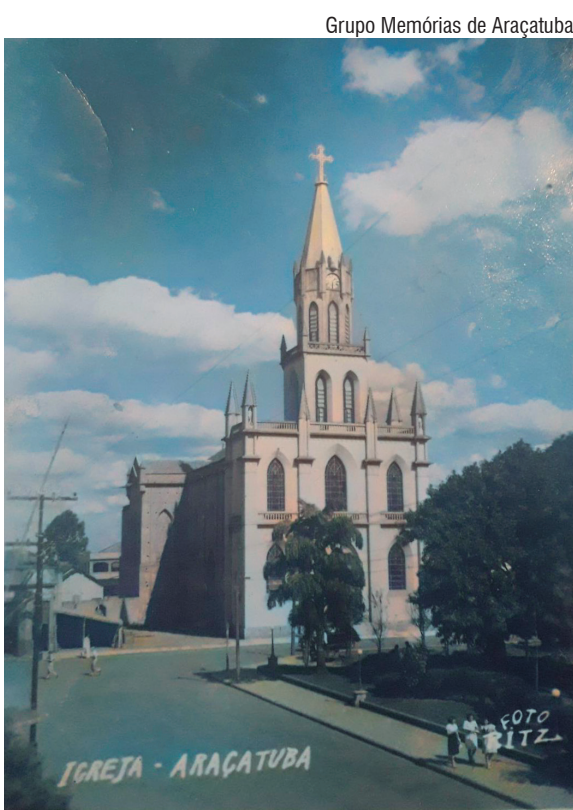
Antiga Igreja Matriz