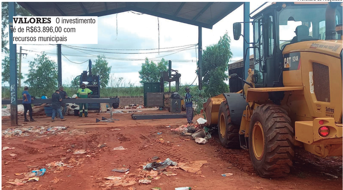
VALORES O investimento é de R$63.896,00 com recursos municipais

CooperAraçá (Cooperativa de Coleta Seletiva, Beneficiamento e Transformação de Materiais Recicláveis de Araçatuba) recebeu, nesta terça-feira (20), uma nova esteira de alimentação. O investimento é de R$63.896,00 com recursos municipais.