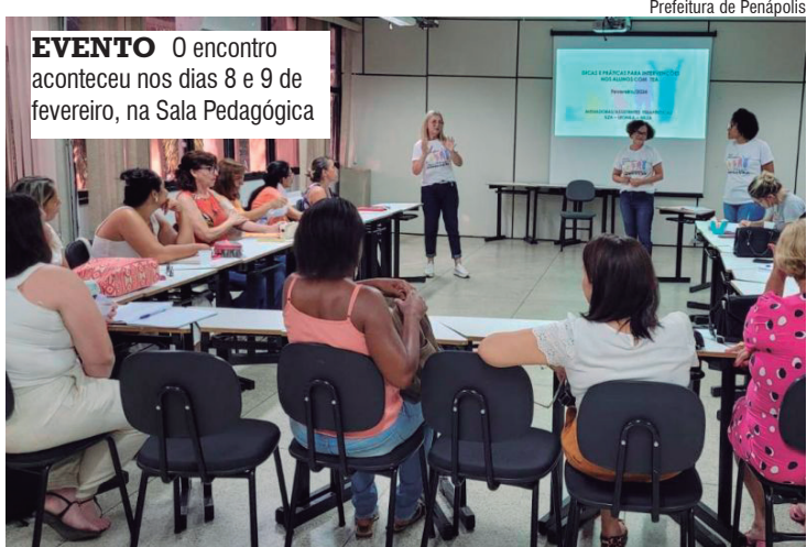
EVENTO O encontro aconteceu nos dias 8 e 9 de fevereiro, na Sala Pedagógica

A Secretaria Municipal de Educação promoveu no início deste mês, um encontro sobre “Dicas e práticas de intervenções de alunos com TEA (Transtorno do Espectro Autista)”, voltado especialmente para os profissionais da Educação Infantil. O encontro aconteceu nos dias 8 e 9 de fevereiro, com a participação de aproximadamente 50 profissionais da rede municipal de ensino e foi ministrado por integrantes do Núcleo Multidisciplinar “Superação”. Segundo explicou a secretária municipal de Educação, Neira Maria Pereira Pinheiro, a capacitação dos profissionais é necessária, considerando que houve um crescimento significativo do número de alunos com TEA atendidos na rede infantil. “As crianças com espectro autista demandam de um manejo específico de comportamento. Por isso, a supervisão de ensino e a coordenação pedagógica da Educação Infantil proporcionaram esse encontro para melhor orientar os profissionais que atuam diretamente com esses alunos”, explicou a secretária. O encontro sobre dicas e prá-