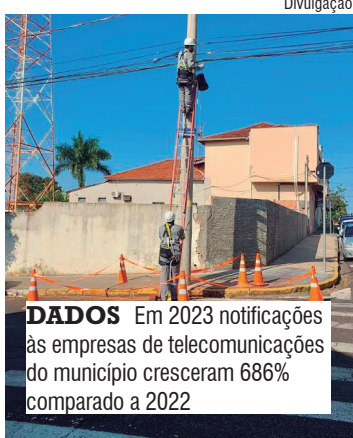
DADOS Em 2023 notificações às empresas de telecomunicações do município cresceram 686% comparado a 2022

Ação do tempo ou veículos com alturas maiores que as permitidas pelas leis de trânsito podem arrebanhar os fios de energia ou de telefonia. Para evitar cabos soltos pelas ruas, a CPFL Paulista tem feito um trabalho constante para organizar os postes junto às empresas de telecomunicações, já que estas são, por normas regulamentadas, responsáveis por seus cabos de telefonia. Em 2022, a CPFL Paulista emitiu cerca de 80 mil notificações às operadoras de telefonia, internet e TV a cabo. Em 2023, o número foi de 312 mil. Somente na região de Araçatuba, em 2023, foram aplicadas mais de 36 mil notificações às empresas com irregularidades em seus cabos de telefonia, um número 686% maior que o registrado em todo 2022.