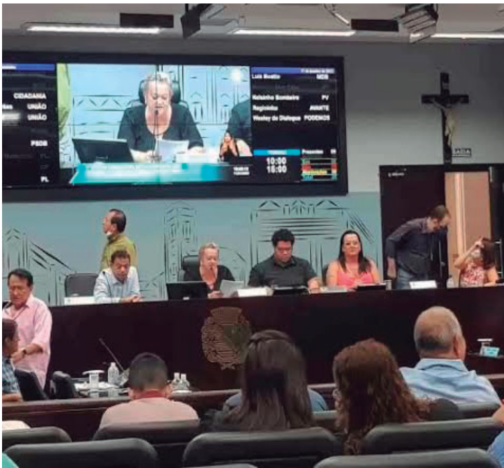
Câmara Municipal: muitas homenagens

branda para um ano eleitoral, período em que, normalmente, os ânimos costumam se elevar no meio político. Observadores da política local acreditam que, à medida que definições partidárias tendo em vista as eleições forem ocorrendo, o clima tende a “esquentar”.