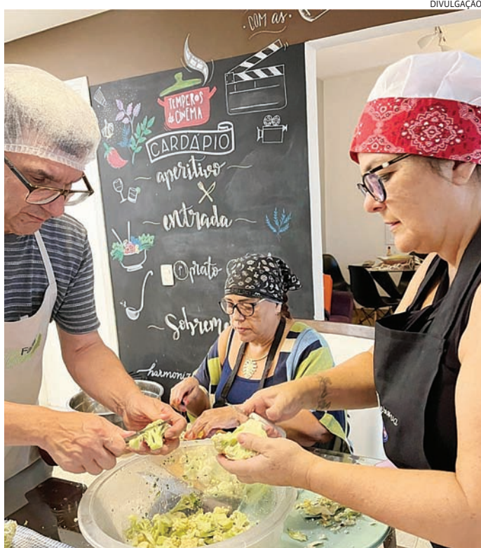
O grupo já realizou mais de 100 eventos, entregando 6 mil cestas básicas