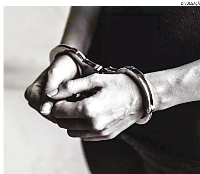
Ele já havia ficado preso por dois anos, pelo crime de roubo

Conduzido à Central de Flagrantes, ele ficou preso, sendo encaminhado posteriormente ao Centro de Triagem de Campo Limpo Paulista.