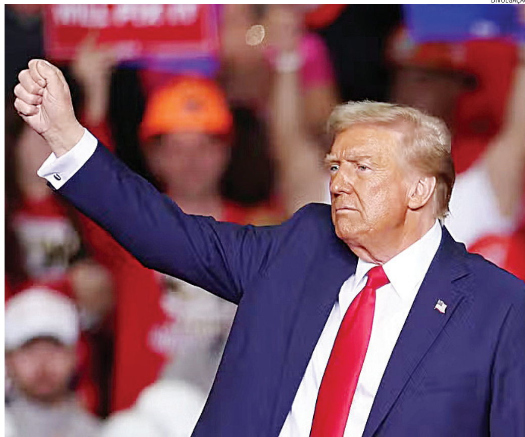
Nas redes sociais, bolsonaristas comemoraram a eleição de Trump nos EUA

“A eleição do Trump fortalece a luta pela liberdade e de valores conservadores de direita, acredito que o bom senso e a justiça