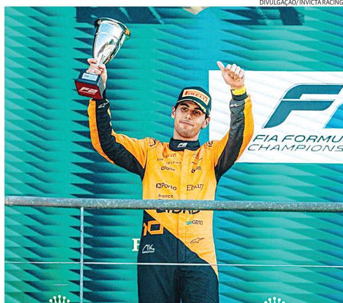
Bortoleto foi campeão da Fórmula 3 logo em seu ano de estreia

Mas havia um entrave, resolvido nas últimas semanas: Bortoleto era piloto da academia da McLaren, que o liberou para que ele