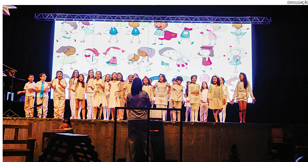
Coral infantojuvenil Cidade das Crianças encerra a programação no domingo, no Centro das Artes

As conexões presentes no tema desta edição terão papel fundamental na programação, uma vez que entre as atrações previstas estão a premiação da 2ª edição do Prêmio Jundiaí de Literatura, o Dia da Consciência Negra, a 8ª ZumbiTECA – cujo tema é “Reflexões e Jornada: O Empoderamento Negro Através da Arte, da Leitura e da Literatura”