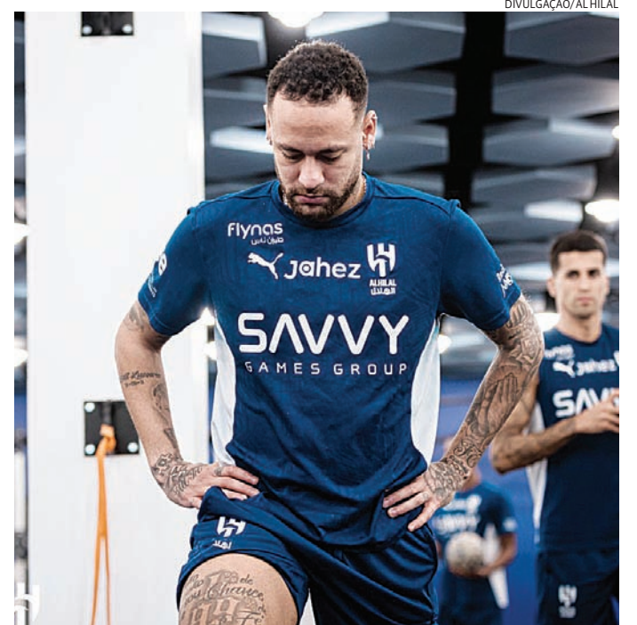
Neymar sentiu a lesão logo no segundo jogo após voltar a atuar

Ele entrou no segundo tempo da partida contra o Esteghlal, pela Liga dos