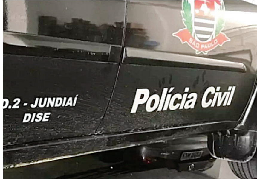
Os policiais da Dise agora trabalham para prender o 'entregador'

o local (na rua Mercúrio) e, a distância, com viatura descaracterizada, observaram um homem saindo da residência em questão. Ele foi abordado e, em sua posse, os agentes localizaram algumas poucas porções de drogas. Questionado, ele confessou que estava no tráfico, e que na casa de onde havia saído, havia mais drogas armazenadas.