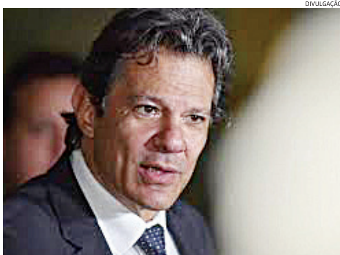
Haddad deve anunciar corte de gastos nos próximos dias

O ex-presidente Jair Bolsonaro (PL) já está se articulando com aliados para recuperar o passaporte apreendido há um ano pela Polícia Federal e voar para os Estados Unidos (EUA) e participar da posse