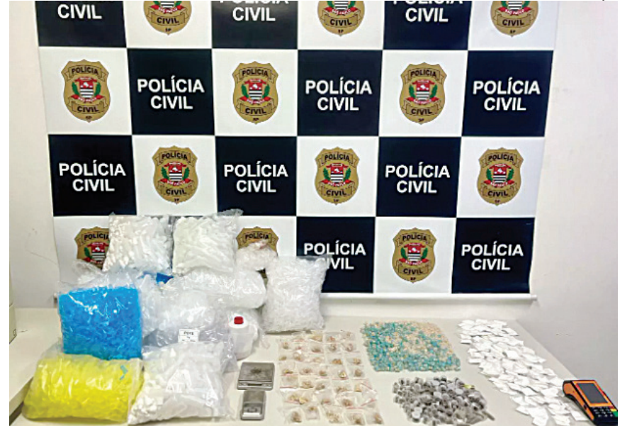
As drogas, balança de precisão e cápsulas foram apreendidas pelos policiais civis