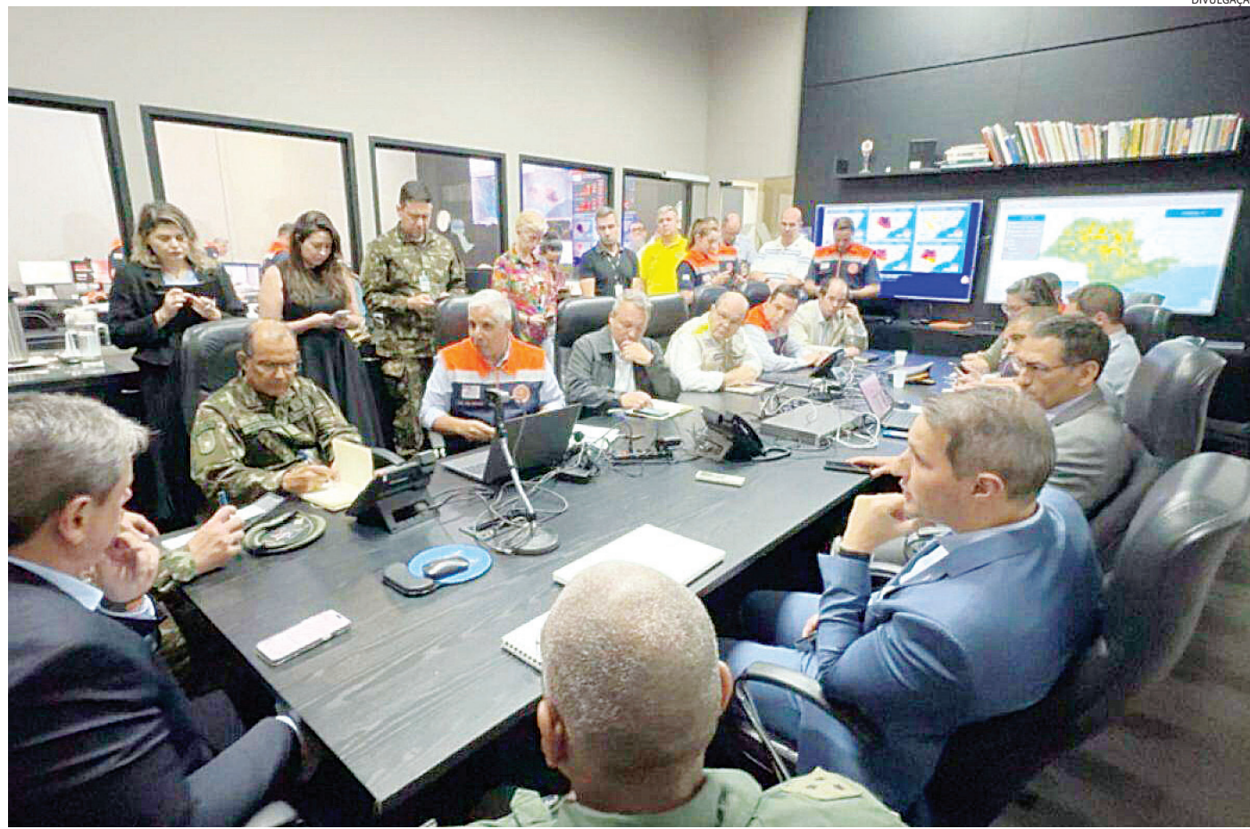
O Governo de São Paulo irá instalar a partir desta quinta-feira (7) o gabinete de crise para garantir a pronta resposta à população em caso de emergência

A Defesa Civil destaca atenção especial para as regiões de Bauru e Araraquara, pois os níveis serão ainda mais elevados. Essas chuvas poderão vir acompanhadas de raios, rajadas de vento e possibilidade de granizo. Este alerta é devido à passagem de uma frente fria pela costa da região sudeste, a qual criará condições para pancadas de chuva forte, além de con-