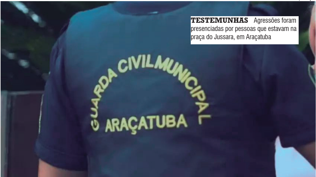
TESTEMUNHAS Agressões foram presenciadas por pessoas que estavam na praça do Jussara, em Araçatuba

A mulher contou aos guardas que havia decidido sair de casa para ir à missa naquela noite, e que antes havia discutido com o marido. Momento em que, segundo ela, o homem a seguiu e desferiu os golpes. Todos foram encaminhados até a delegacia. A vítima informou que desejava representar contra o marido e que tinha interesse em solicitar uma medida protetiva. O caso foi registrado como violência doméstica, injúria, resistência e desacato. Quanto aos guardas municipais, a reportagem apurou que passavam bem e retomaram a rotina de trabalho.