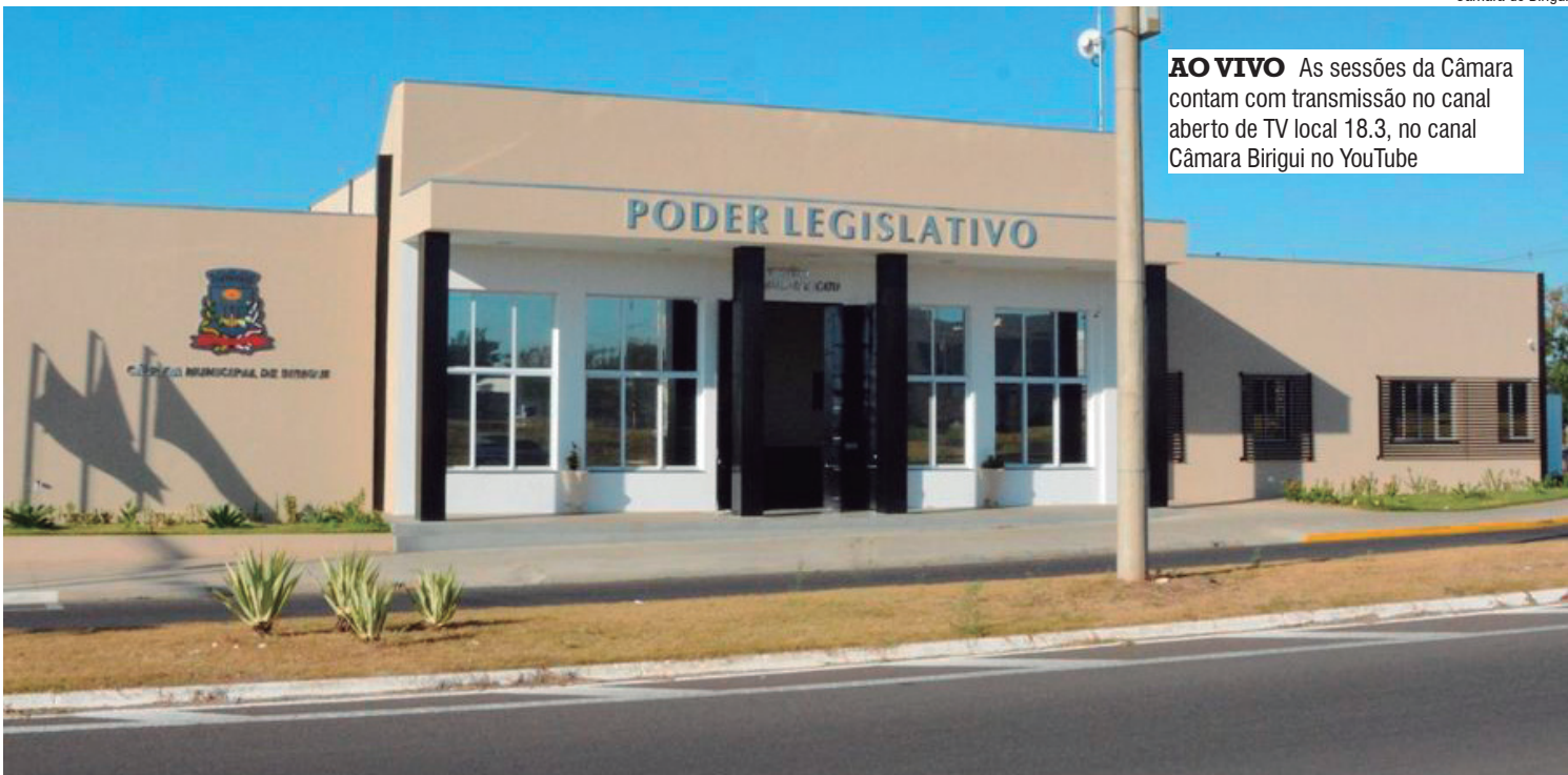
Câmara de Birigui

MATÉRIAS Projeto de Lei Ordinária nº 7 de 2024, autoria do Poder Executivo, o projeto autoriza o município de Birigui a abrir crédito adicional especial na Lei nº 7.359, Lei Orçamentária de 2024; Lei nº 7.288/2023, Lei de Diretrizes Orçamentárias de 2024; e na Lei nº 7.067/2021, Plano Plurianual (PPA) de 2022 a 2025. O autor considera a necessidade da aquisição de maquinários destinados a manter o pleno funcionamento de atividades operacionais da Secretaria Municipal de Obras e Serviços, levando em conta que o município foi contemplado, pelo Governo do Estado de São Paulo, com convênios