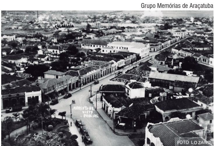
Centro de Araçatuba