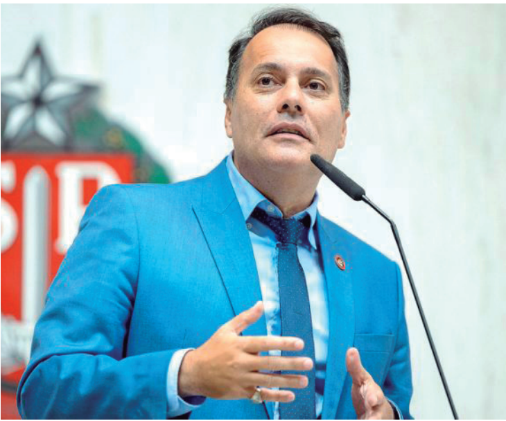
Átila destinou recurso para Araçatuba

prédio, a biblioteca estava atendendo temporariamente numa sala do Complexo Esportivo Municipal. No momento, ela está fechada devido à mudança, retorno ao prédio, limpeza e organização do acervo. Nenhum dos serviços realizados pela biblioteca estará disponível até a reinauguração do prédio.