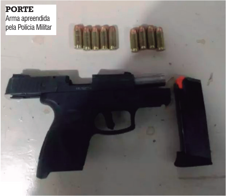
PORTE Arma apreendida pela Polícia Militar

No domingo, 18, um empresário de 54 anos, foi preso em flagrante pela Polícia Militar após se envolver em um acidente de trânsito, no trevo da avenida Guanabara, em Andradina, a 112 km de Araçatuba. No local, foi constatado que ninguém ficou ferido no acidente, mas segundo o boletim de ocorrência, dois homens entraram em luta corporal. O empresário, preso em flagrante, informou aos policiais que possuía registro de CAC - Colecionador, Atirador e Caçador - e foi preso por porte ilegal de arma e embriaguez ao volante. De acordo com informações, o homem havia se envolvido em uma confusão no pátio de um posto de combustíveis em Andradina. O segundo homem envolvido na confusão também foi identificado e permaneceu no local com a chegada dos policiais. Uma vistoria foi reali-