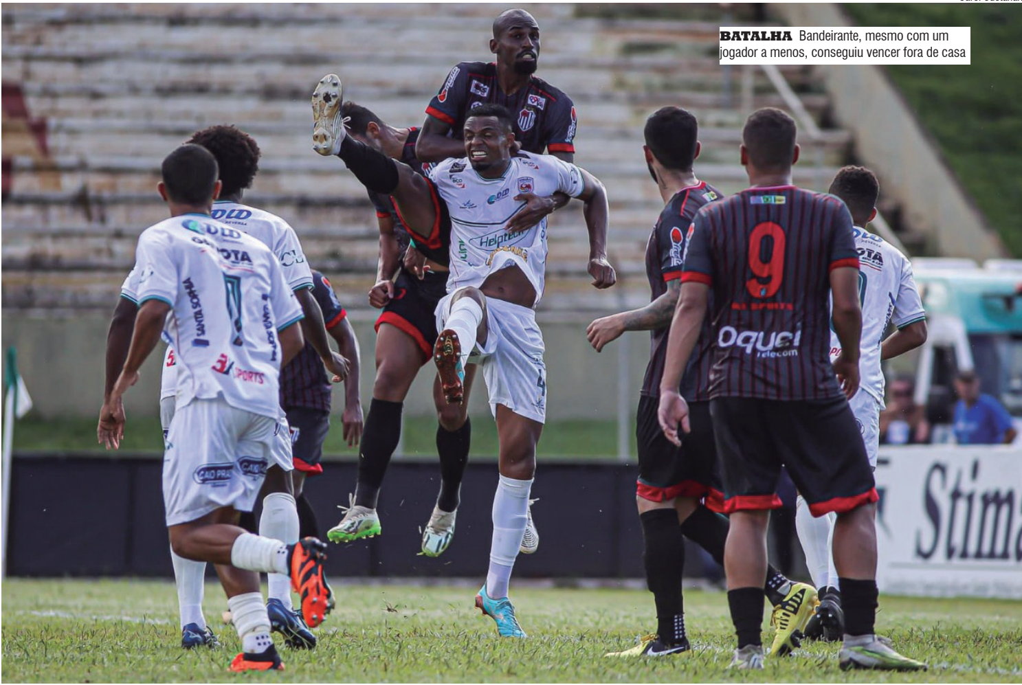
BATALHA Bandeirante, mesmo com um jogador a menos, conseguiu vencer fora de casa