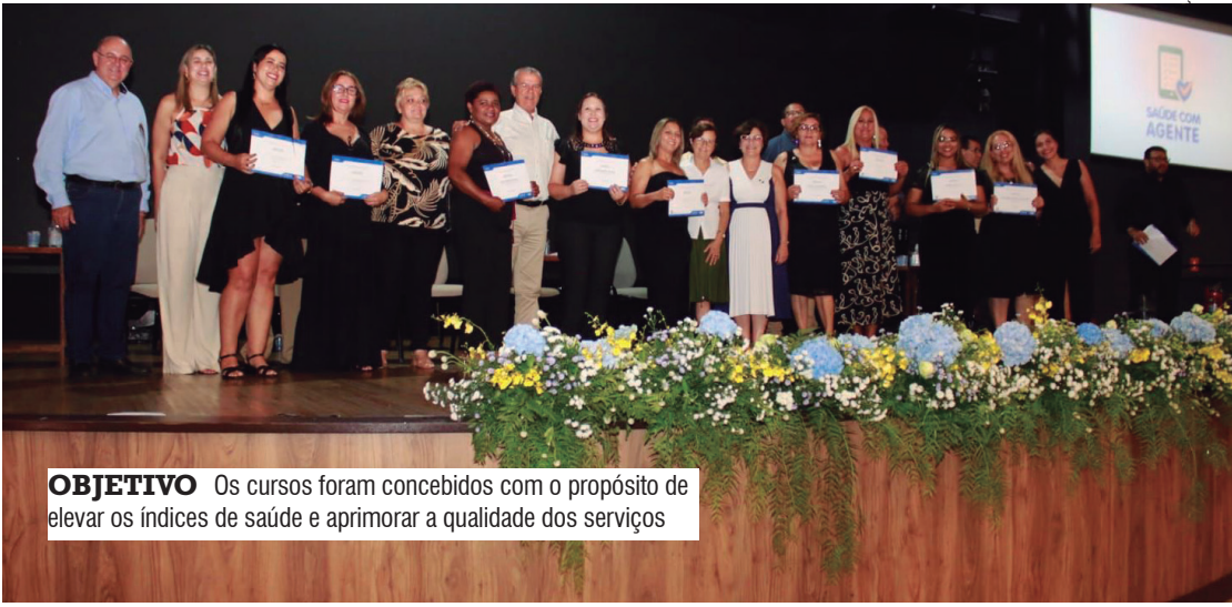
OBJETIVO Os cursos foram concebidos com o propósito de elevar os índices de saúde e aprimorar a qualidade dos serviços