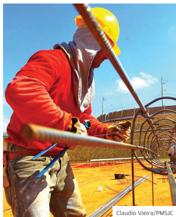
Qualifica. Inscrição pelo site

OPORTUNIDADE. O programa Qualifica São José está com inscrições abertas para 21 cursos gratuitos para qualificação de mão de obra para o mercado de trabalho. São 1.924 vagas abertas no total. Para se inscrever basta acessar a página do Qualifica São José no site da Prefeitura e preencher alguns requisitos, como ser morador da cidade.