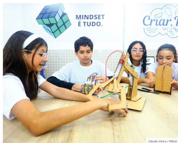
Números. Mais de 80 mil alunos matriculados na rede municipal

Diversas ações e programas educacionais acontecem nas escolas, como o Educação 5.0, voltado à formação de habilidades e competências socioemocionais e o uso de tecnologias; Educação Integral com oficinas de arte, cultura, esportes e tecnologia no contraturno, jogos pedagógicos para Alfabetização, Programa Recupera, Escola de Formação do Educador para formação continuada de professores, com destaque também na fila zera da Educação Infantil.