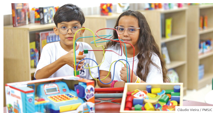
Inovação. Investimentos da Prefeitura chegam a todas as unidades