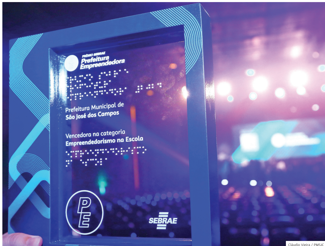
Mais prêmio. São José dos Campos conquistou em abril o Prêmio Sebrae Prefeitura Empreendedora

RECONHECIMENTO CIDADE TAMBÉM CONQUISTOU O PRÊMIO SEBRAE NA CATEGORIA EMPREENDEDORISMO NA ESCOLA