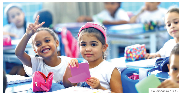
Alegria. Educação 5.0 melhorou a estrutura de escolas da cidade