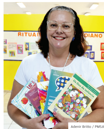
Educação. Fontes qualificadas

FORMAÇÃO. Todos os professores da rede de ensino municipal irão receber, até maio, obras atuais sobre educação e práticas inovadoras. A entrega dos livros é organizada pela equipe da EFE junto aos gestores das unidades escolares. O objetivo é subsidiar os programas de formação continuada e proporcionar acesso a fontes qualificadas de pesquisa.