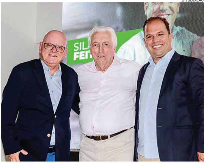
A convenção foi realizada na última sexta-feira (26)

A Procuradoria-Geral da República (PGR) denunciou na última sexta-feira (26) o deputado federal Nikolas Ferreira (PL-MG) ao Supremo Tribunal Federal (STF) pelo crime de injúria contra o presidente Luiz Inácio Lula da Silva. A denúncia envolve discurso feito pelo deputado durante uma reunião na Organização das Nações Unidas (ONU) em 2023. Nikolas chamou Lula de “ladrão” e publicou a