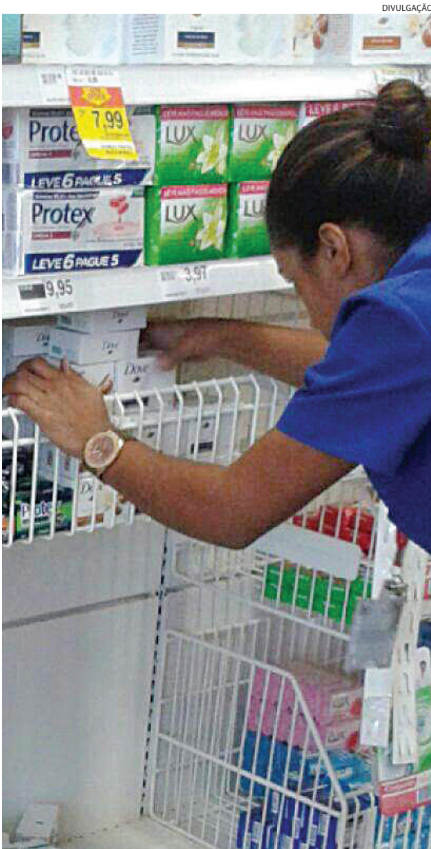
Há empresas que estão contratando 100 funcionários de uma só vez

Consulte todas as vagas no Portal JJ (jj.com.br)