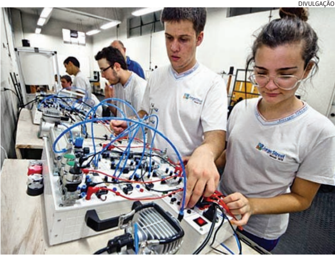
A Seduc-SP deve ampliar para 1.911 escolas que ofertam cursos

Os selecionados vão ministrar aulas presenciais aos estudantes conforme habilitação de nível superior e os componentes curriculares correspondentes. São nove cursos: administração, agronegócio, ciência de dados, desenvolvimento de sistemas, enfermagem, farmácia, hospedagem, logística e vendas. Na inscrição, o candidato deve escolher uma Diretoria de Ensino da Secretaria da Educação do Estado de São Paulo (Seduc-SP) de sua preferência dentre as 91 regionais de todo o estado para eventual alocação. Deverá também indicar um Eixo de Prova, de acordo com os cursos em que pretende lecionar. A taxa de inscrição é de R$ 49. As provas objetiva e discursiva estão marcadas para 29 de setembro. O processo engloba ainda avaliação de títulos (diplomas de formação e experiência profissional) e prova prática (envio de videoaula gravada). Quem não for chamado na primeira seleção terá o nome inclu-