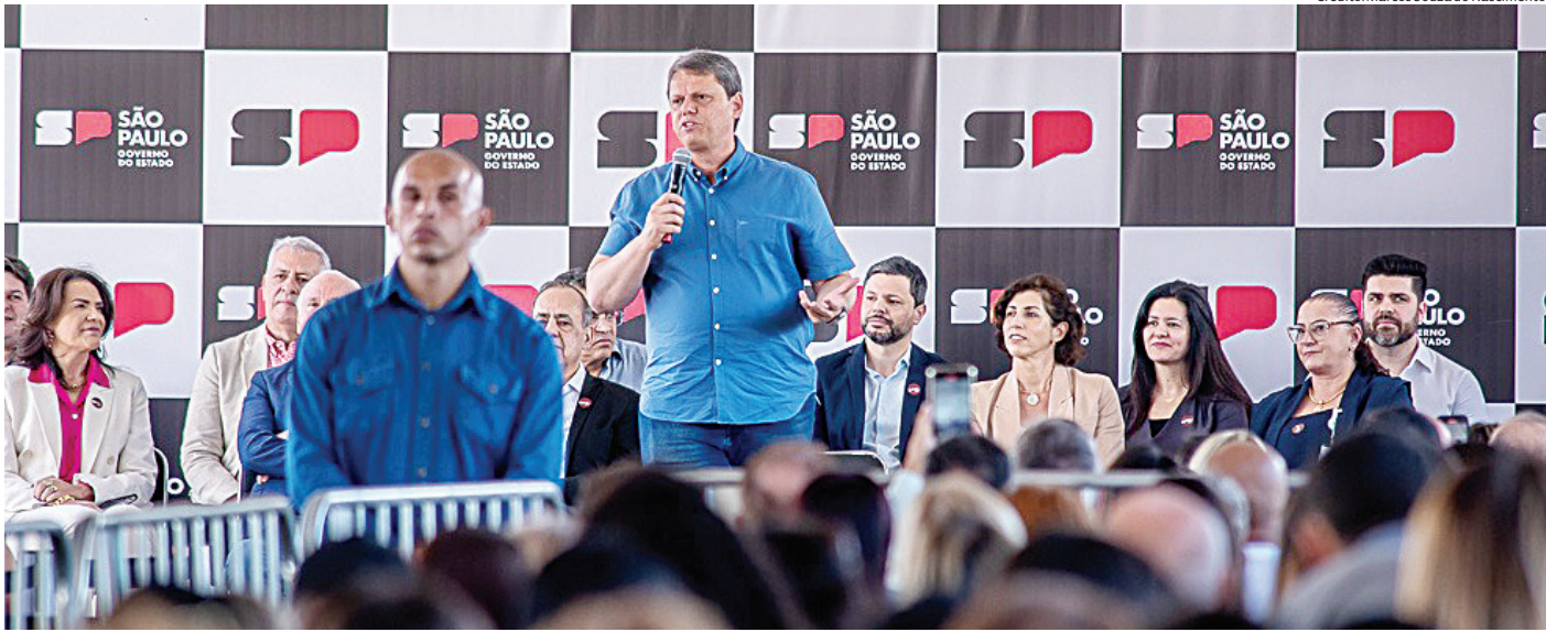
O governador Tarcísio de Freitas entregou a nova Maternidade Estadual Franco da Rocha na última quinta-feira (25)

A solenidade de inauguração contou ainda com a presença da secretária-executiva da Saúde, Priscilla Perdicaris, e da secretária de Políticas para