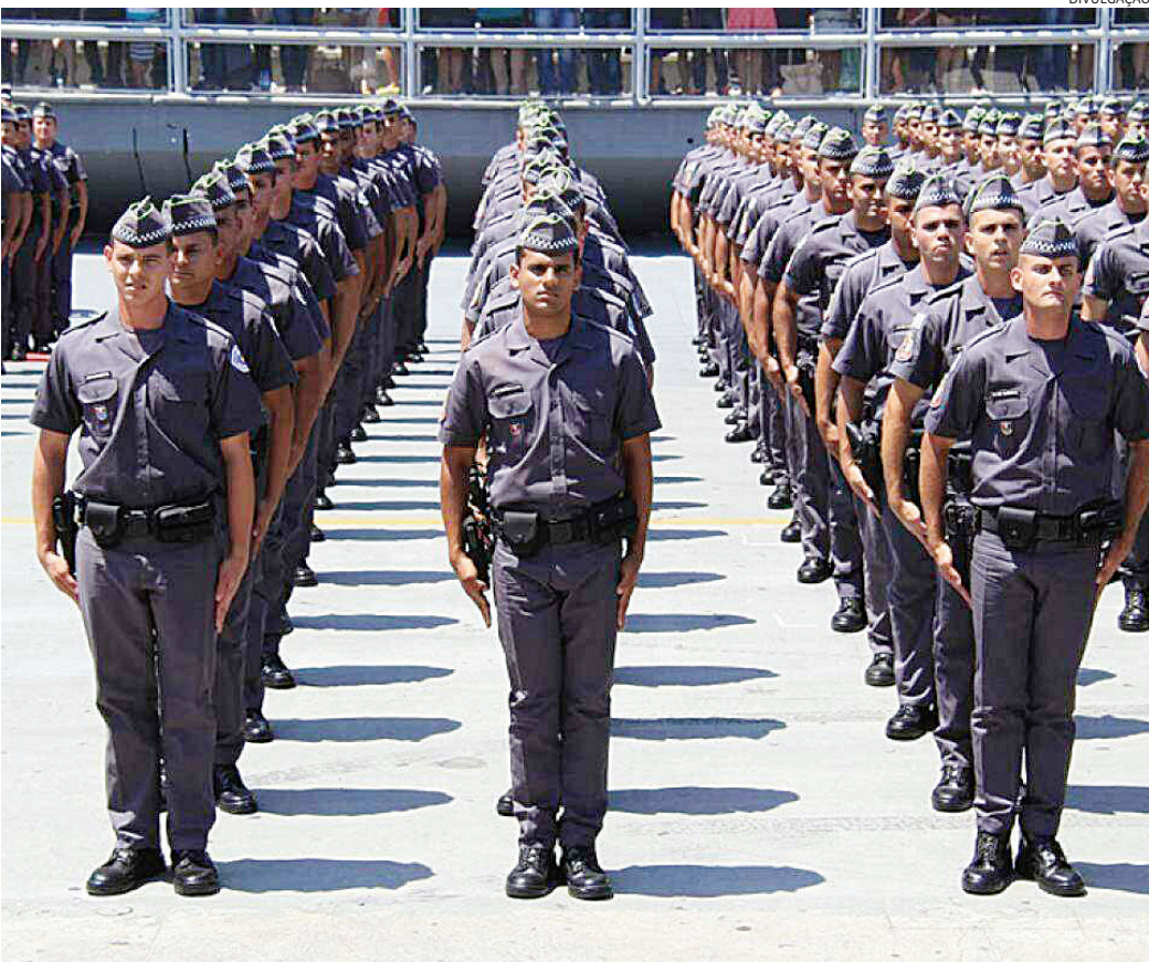
Roubos diminuíram em Jundiaí e no estado, mas furtos, que diminuíram em São Paulo, tiveram aumento em Jundiaí

ro semestre deste ano teve 2.607 furtos registrados na cidade, incluindo furto de veículos, alta em relação ao mesmo período do ano passado, quando houve 2.468. Em 2022, foram registrados 2.471 furtos no primeiro semestre. No Estado de São Paulo, os furtos em geral, incluindo a veículos, tiveram 319.915 registros entre janeiro e junho deste ano. No ano passado, no mesmo período, foram contabilizados 334.095 furtos no estado. Em 2022, o primeiro semestre teve 321.245 boletins de ocorrência de furto em São Paulo.