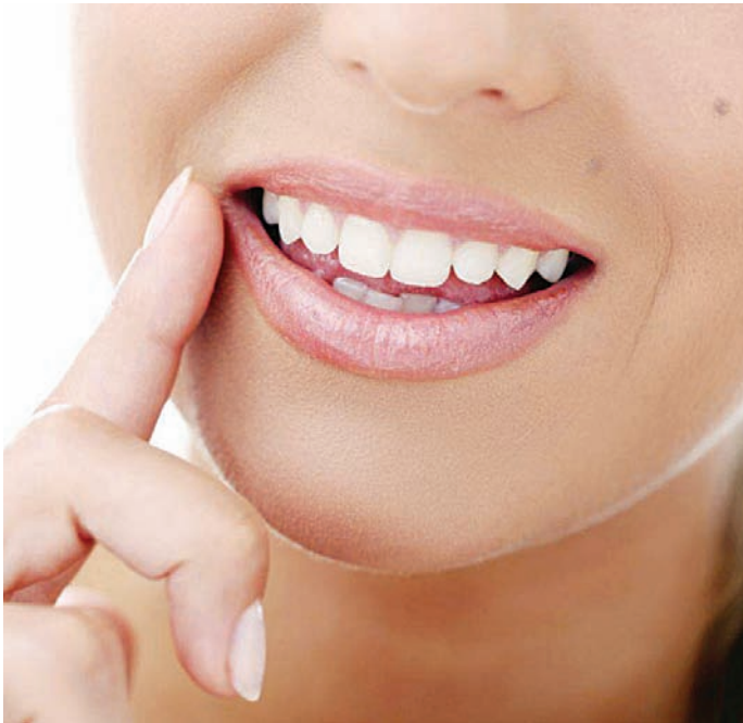
O especialista alerta para os cuidados que devem ser tomados

Dr Sérgio explica que existe outro tipo de clareamento dental chamado “over-the-counter”, em que o paciente compra produtos clareadores vendidos em farmácias e realiza a auto aplicação, sem a orientação do cirurgião-dentista. Os itens podem ser: canetas clareadoras, cremes dentais, goma de mascar, fitas clareadoras e enxaguantes bucais.