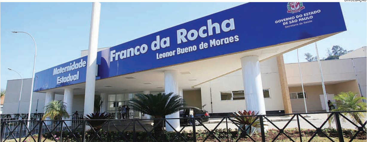
Unidade será gerenciada pela Secretaria de Estado da Saúde (SES) com estimativa de repasse anual de R$ 72 milhões

Com investimento estadual e municipal de R$ 24,5 milhões, a unidade beneficiará mais de 624 mil habitantes da região de Franco da Rocha, que inclui ainda os municípios de