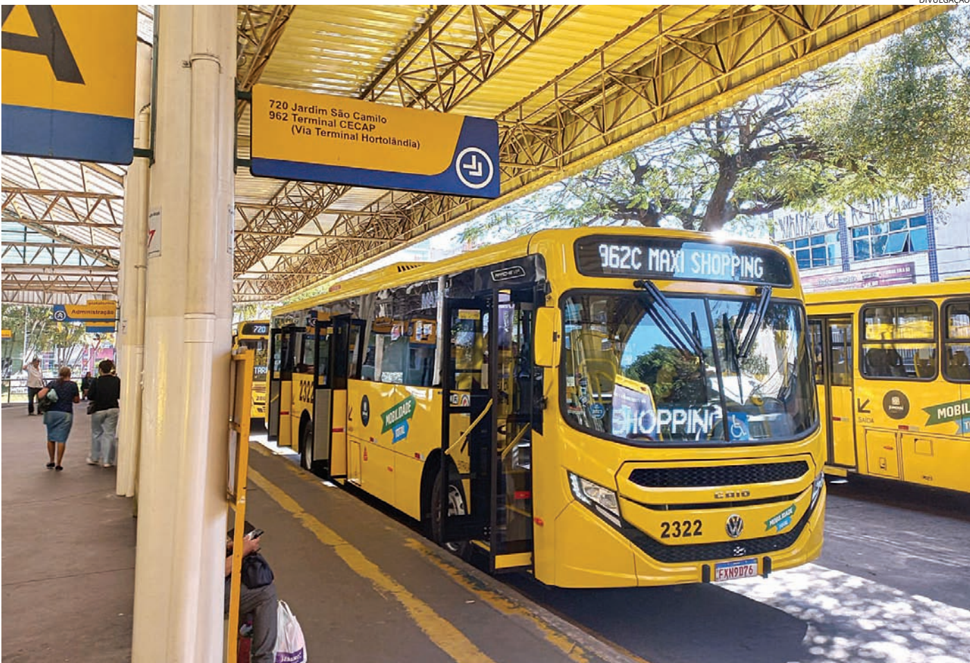
A expectativa é gerar 500 mil embarques/mês e 8,9 mil viagens em dias úteis, num total de 94 linhas

Foi anunciada na última sexta-feira (26) verba de R$ 69 milhões para investimento no projeto de Parceria Público-Privada de Mobilidade de Jundiaí. O projeto prevê a construção de um novo terminal urbano no Vetor Oeste, além de novos abrigos, melhorias viárias e estruturais no sistema de transporte público da cidade. O projeto de mobilidade de Jundiaí - contemplado com R$ 69 milhões pelo Novo PAC Seleções, na modalidade Mobilidade Urbana – Grande e Médias Cidades - está entre os 899 empreendimentos propostos pelos 26 estados e o Distrito Federal, 710 municípios e 1 consórcio contemplados na etapa, que selecionou ações nos eixos Abastecimento de Água – Urbano, Esgotamento de Sanitário, Mobilidade Urbana – Grandes e Médias Cidades, Prevenção a Desastres Naturais – Drenagem Urbana e Convive Centro Comunitário pela Vida. “O projeto de mobilidade de Jundiaí é amplo, e envolve uma grande reestruturação do sistema de transporte público municipal. A PPP inovará, com novo terminal de transporte no Vetor Oeste e novos mo-