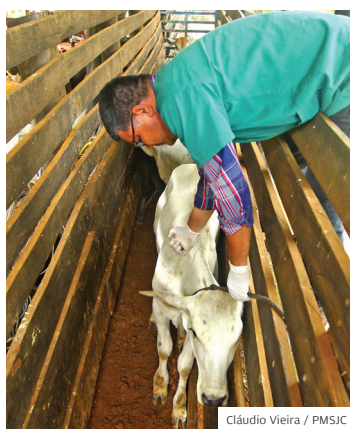
Apoio. Ao produtor rural

AFTOSA. A Prefeitura de São José dos Campos realizou em novembro a vacinação gratuita de rebanhos contra a febre aftosa. A campanha atendeu pequenos produtores rurais do município. Nessa etapa, foram vacinados bovinos e bubalinos (búfalos), de 0 a 24 meses de idade. São José é uma das únicas cidades do Brasil que oferecem a vacinação gratuita.