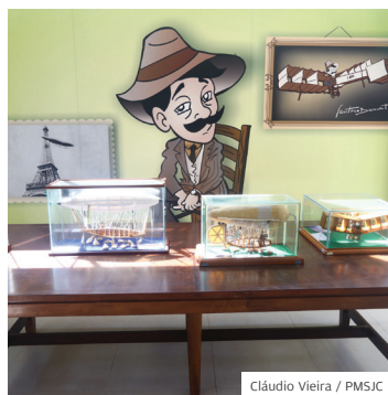
Acervo. Tem muito documento