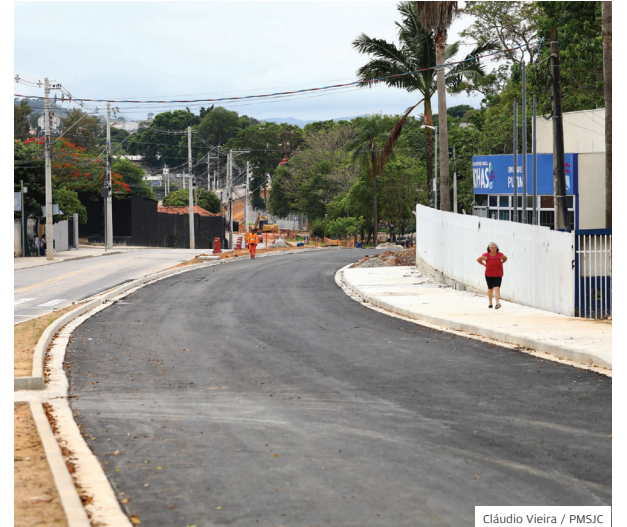
Mobilidade. Duplicação da avenida João Rodolfo Castelli; obra garante mais desenvolvimento à região