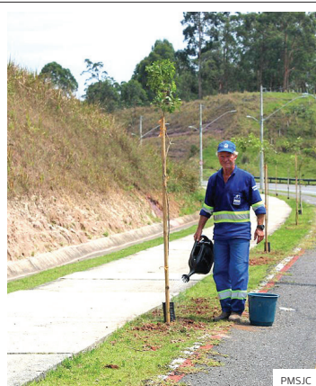
Cambuí. Plantio de mudas

VERDE. A Prefeitura plantou, em seis meses, 2.400 árvores na região sul, leste e sudeste da cidade. A Via Cambuí, eixo de ligação entre as regiões leste e sudeste, recebeu cerca de 800 mudas e, atualmente, está sendo realizada manutenção com tutoramento e limpeza de copa, além de substituição de algumas árvores que não conseguiram enraizar.