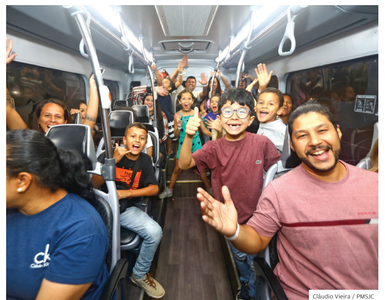
Inscrições. Para participar acesse o site da Prefeitura ou o 156

site da Prefeitura de São José dos Campos ou pelo canal 156. A programação seguirá com apresentações de corais, dança e muita música no palco instalado na Praça Afonso Pena. Quem passar pelo local, poderá prestigiar ainda a Feira Gastronômica, organizada por instituições sociais cadastradas no município, e a Feira de Artesanato de Natal, com a venda de presentes feitos pelos artesãos da cidade. Vai ser imperdível. Participe e leve toda a família!