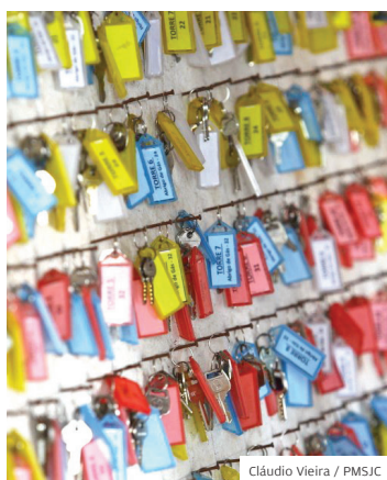
Moradia. Projetos selecionados

HABITAÇÃO. Seis empreendimentos de São José foram selecionados pelo programa Minha Casa Minha Vida. No total serão 528 imóveis, que serão destinados, por meio de sorteio, aos inscritos no programa habitacional da Prefeitura. Quatro deles, com total de 208 apartamentos, serão construídos em terrenos que serão doados pelo Município.