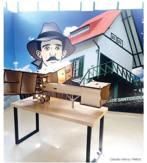
A Casa. É uma réplica da residência original