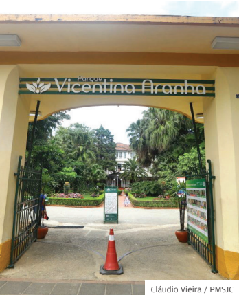
Parque. Na região central

PARQUE. A Afac, entidade gestora do Vicentina Aranha, lançou a campanha Imposto do Bem, oportunidade para os visitantes do Parque contribuírem com o restauro das edificações. Ao aderir à campanha, pessoas físicas que declaram Imposto de Renda no modelo completo podem destinar até 6% do imposto.