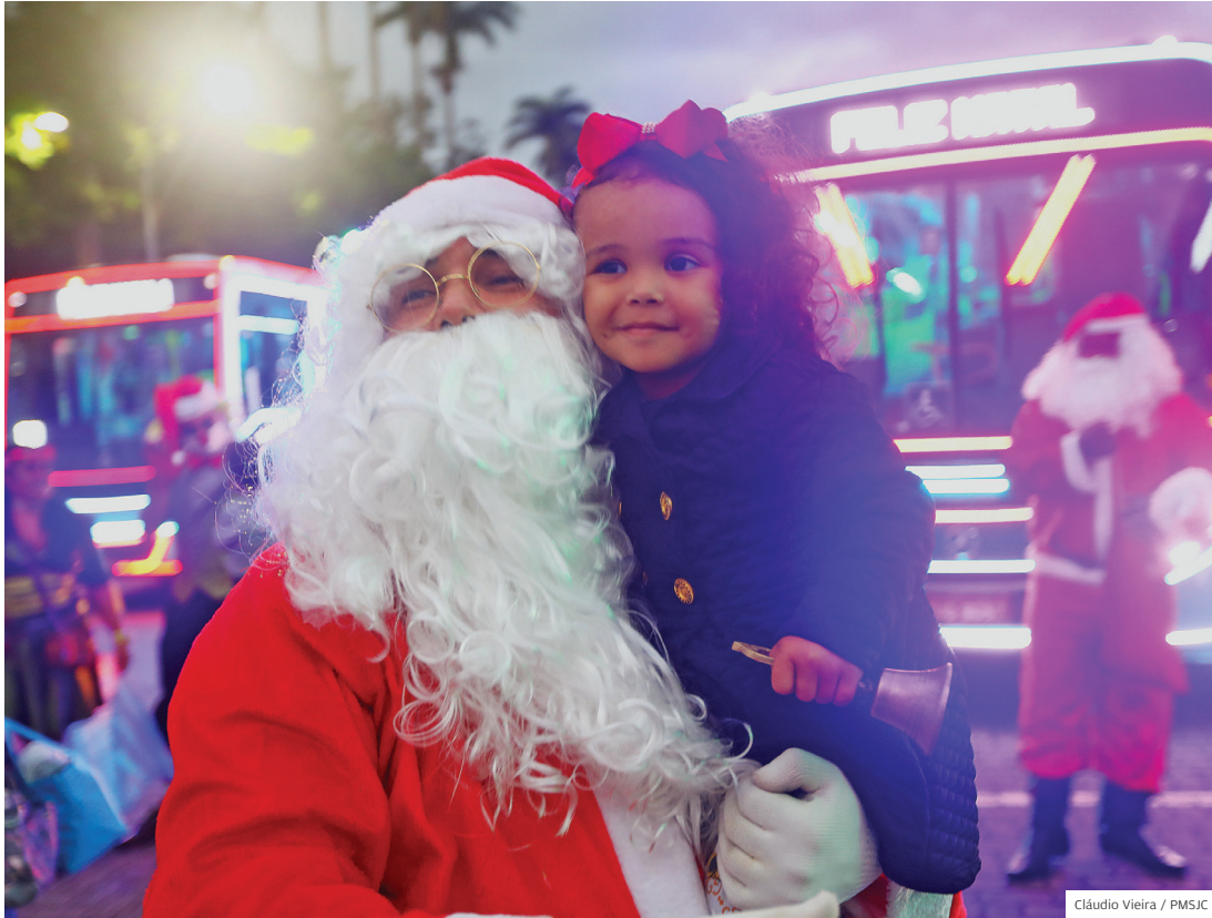
Nas ruas. Caravanas de Natal vão agitar bairros em passeios de ônibus especiais decorados com LED

FESTA INSCRIÇÕES PARA A CARAVANA NATALINA COMEÇAM EM 4 DE DEZEMBRO PELO SITE DA PREFEITURA OU PELO CANAL 156