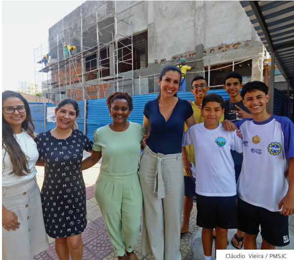
Modernização. Comunidade da Emefi Maria Nazareth de Moura Veronese acompanha melhorias nos espaços

INFRAESTRUTURA DUPLICAÇÃO DA AVENIDA JOÃO RODOLFO CASTELLI, NOVA UBS E REFORMA DE ESCOLAS ESTÃO EM ANDAMENTO NA REGIÃO