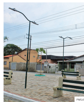
Santana. Praça renovada

ILUMINADO. A Prefeitura de São José dos Campos realiza licitação para 33 novos espaços públicos que irão receber iluminação ornamental de LED na cidade. Recentemente, o município concluiu a entrega de 31 locais que receberam a melhoria. O investimento previsto nesta nova etapa é de R$ 1,9 milhão.