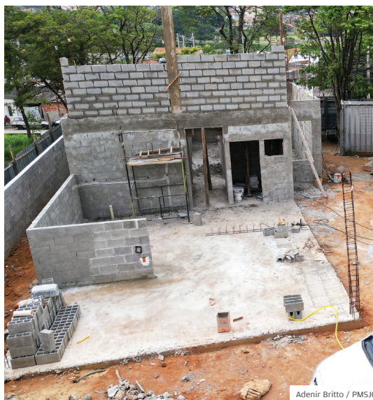
Base. Nova base do Samu na região norte

A região norte de São José vai contar, a partir de 2024, com uma nova e moderna sede do Samu. No local também funcionará a nova base do Corpo de Bombeiros. A base do Samu terá acesso direto para a rua Pedro Rachid, de fácil ligação à Via Norte, para agilizar os deslocamentos das equipes nos atendimentos das ocorrências com a população da região. Essa e outras ações estão em andamento na região. Confira tudo nesta página.