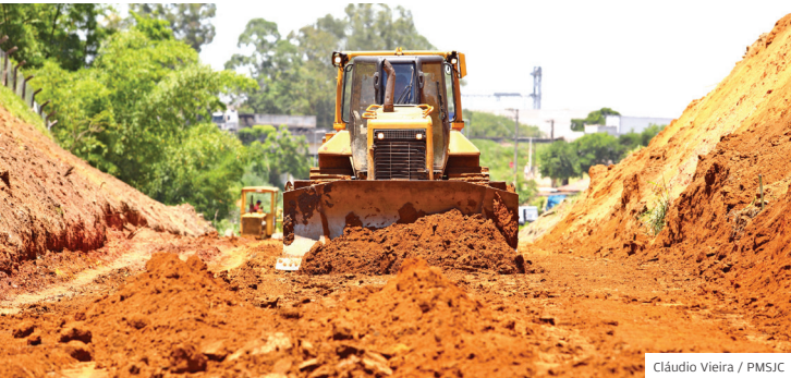
Canteiro. Obra executada pela Urbam (Urbanizadora Municipal)

A Prefeitura iniciou a obra para construção da terceira fase da Via Oeste. A nova etapa vai ligar a avenida Alfredo Asdente (Jardim Pôr do Sol) à divisa com Jacareí, no Limoeiro. O investimento total será de R$31,6 mi, com prazo de 14 meses.