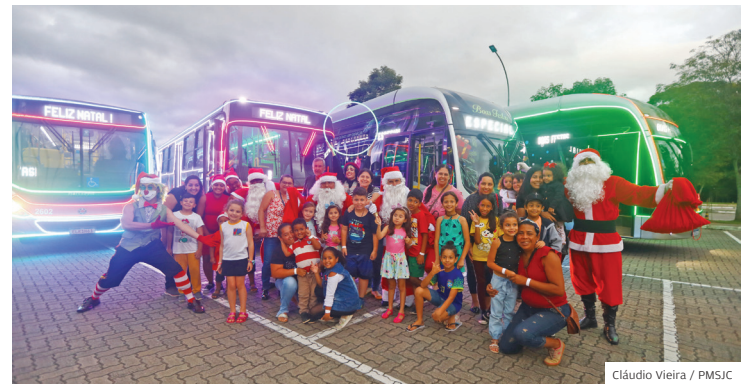
Anote. Inscrições para a caravana começam no dia 4, às 10h30