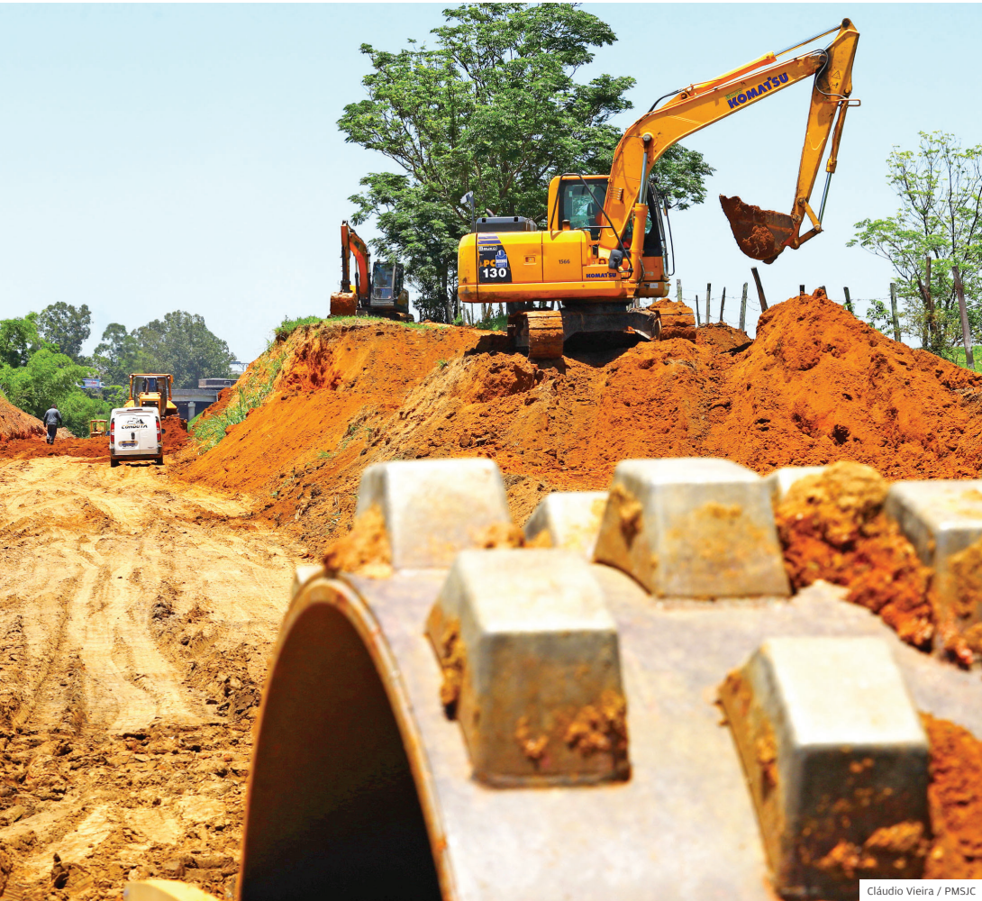
Com a obra. Será possível sair do centro de São José até Jacareí internamente, sem usar a Dutra

A Prefeitura iniciou a obra para construção da terceira fase da Via Oeste. A nova etapa vai ligar a avenida Alfredo Asdente (Jardim Pôr do Sol) à divisa com Jacareí, no Limoeiro. O investimento total será de R$31,6 mi, com prazo de 14 meses.