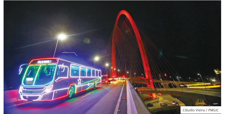
Magia. Caravanas irão circular em todas as regiões de São José