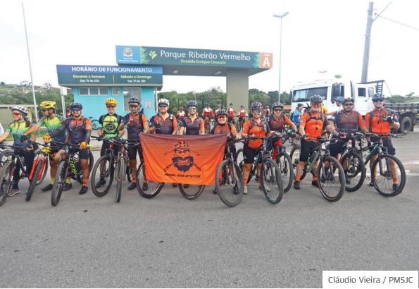
Bike. Trip Bike saiu do parque Ribeirão Vermelho