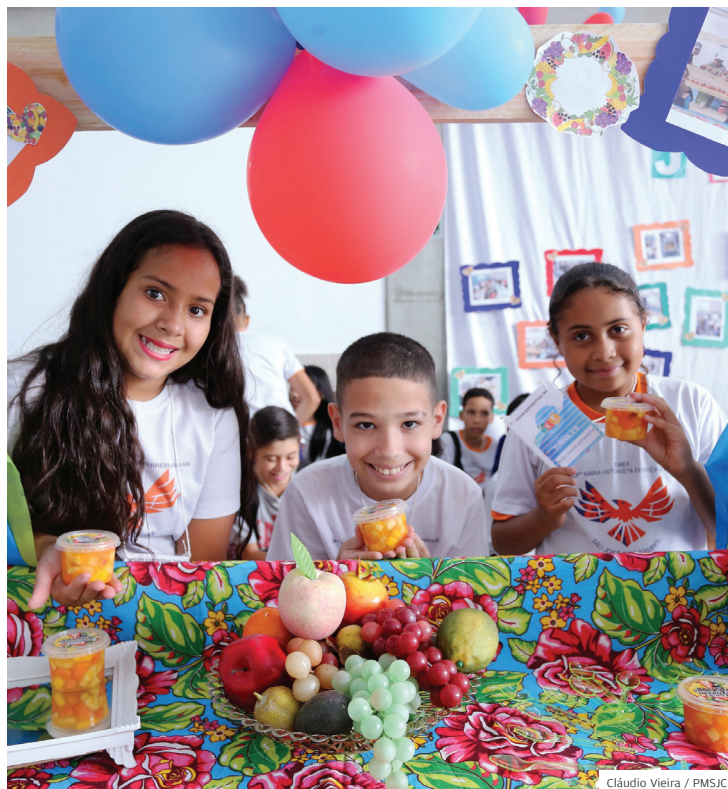
Na escola. Programa Jovens Empreendedores Primeiros Passos

Obras e serviços em todos os cantos da região sudeste. Reforma das escolas, novo salão de ginástica no São Francisco, construção da nova UBS do Jardim da Granja, travessias elevadas e a duplicação da avenida João Rodolfo Castelli. É a Prefeitura investindo na qualidade de vida.