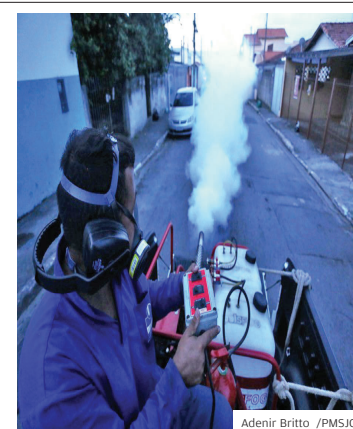
Serviço. Fumacê reforçado

INSETO. O calor chegou e, com ele, as chuvas. Esse fato é um alerta da presença de pernilongos e mosquitos da dengue, zika e chikungunya. Por isso, a Prefeitura tem intensificado as ações de combate aos insetos. Dentre elas, está a aplicação de larvicida biológico, que garante 80% do controle de pernilongos na cidade.