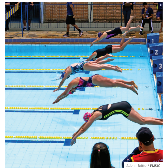
Esporte. Festival de Natação na Casa do Jovem