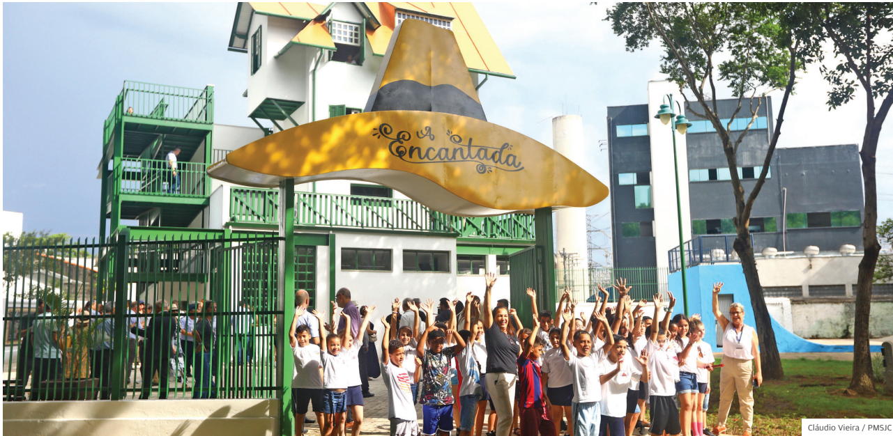
No parque Santos Dumont. Espaço possibilita experiência educativa e imersiva repleta de descobertas e histórias

ATRAÇÃO CASA FOI REVITALIZADA PARA PROPORCIONAR UMA EXPERIÊNCIA EDUCATIVA AOS VISITANTES