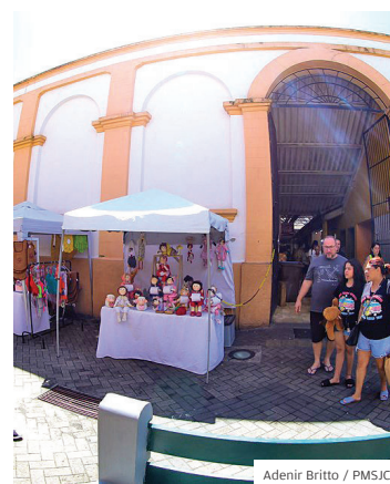
Marco. 100 anos de história

NOVIDADE. A Prefeitura de São José encaminhou à Câmara projeto de lei complementar para fazer a concessão do Mercado Municipal à associação criada pelos comerciantes do mais tradicional centro de compras da cidade, que completou 100 anos em 2023. A proposta para o Mercado vem sendo debatida com a população desde março.