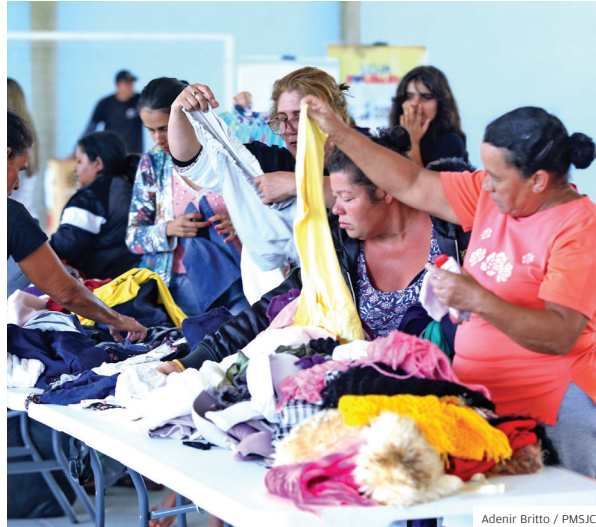
Pinheirinho. Prefeitura atende população em situação de vulnerabilidade social com a doação de roupas