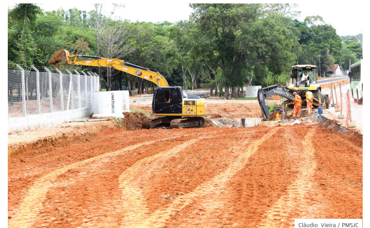
Duplicação. Terraplenagem, drenagem e pavimentação asfáltica