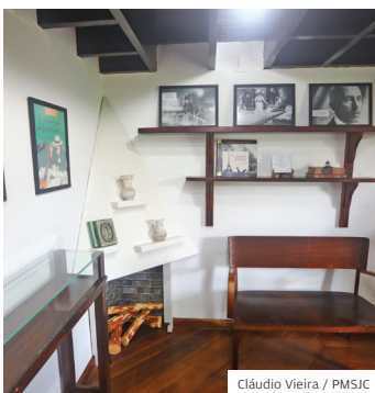
Mobiliário. De época

A Prefeitura abriu a “Encantada - Casa de Santos Dumont” para a população. Localizada no parque de mesmo nome, a réplica da casa original, que foi a residência de Alberto Santos Dumont entre 1918 e 1932, foi revitalizada para proporcionar aos visitantes uma experiência educativa. Vale conhecer!