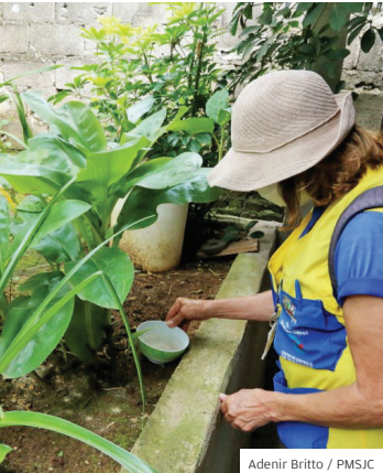
Casas. Agente visita residência

ÍNDICE. A quarta e última ADL (Avaliação de Densidade Larvária) de 2023, realizada pela Prefeitura de São José dos Campos durante todo o mês de outubro, registrou IB (Índice Breteau) de 1,4, que representa estado de alerta em relação à infestação do mosquito Aedes aegypti , transmissor de doenças como dengue, chikungunya e zika vírus.