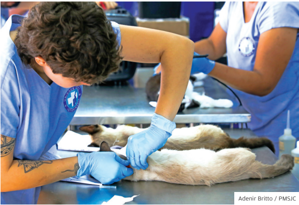
Pet. Castramóvel no Jd. das Indústrias em novembro