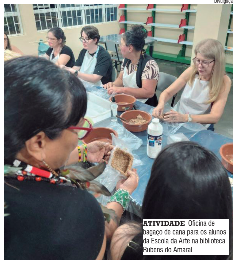
ATIVIDADE Oficina de bagaço de cana para os alunos da Escola da Arte na biblioteca Rubens do Amaral

A palestra Reflorestando Mentes propõe uma imersão na cultura dos povos originários, promovendo reflexão, desconstrução de estereótipos e resgate histórico. A atividade também incentiva o reconhecimento da população como parte dessa herança cultural.