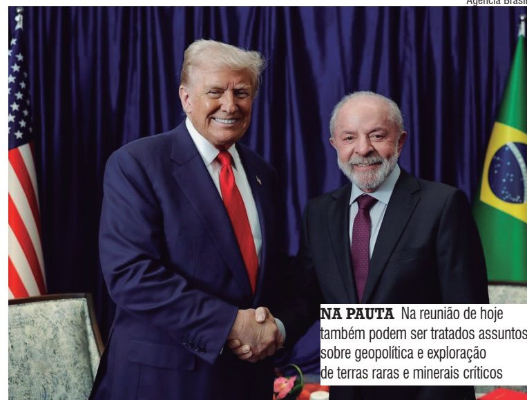
NA PAUTA Na reunião de hoje também podem ser tratados assuntos sobre geopolítica e exploração de terras raras e minerais críticos

Outros temas podem surgir durante a reunião de trabalho, inclusive sobre geopolítica e exploração de terras raras e minerais críticos. O encontro vinha sendo negociado pelas equipes dos dois presidentes e foi fecha-