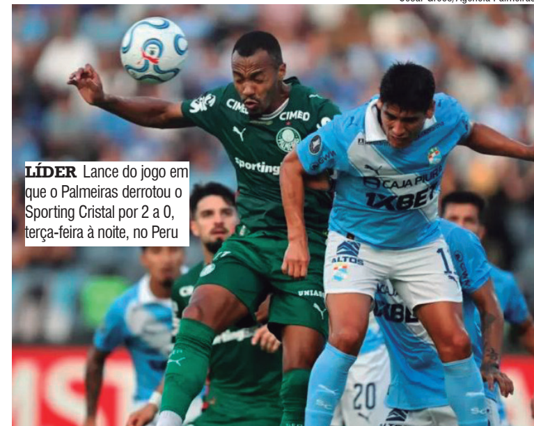
LÍDER Lance do jogo em que o Palmeiras derrotou o Sporting Cristal por 2 a 0, terça-feira à noite, no Peru

Antes de vencer o Sporting Cristal, o Verdão havia empatado com o Cerro e com o Santos, sequência pela qual a equipe foi cobrada, já que teve um desempenho abaixo. Ao ser questionado sobre a consistência, Abel Ferreira rebateu, comparando o