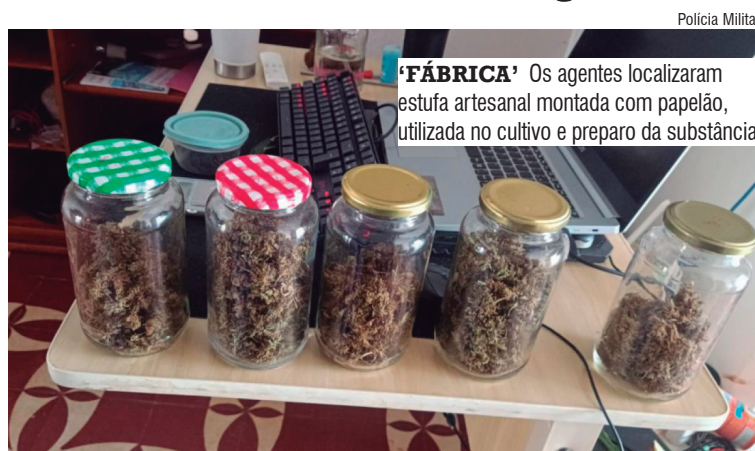
'FÁBRICA' Os agentes localizaram estufa artesanal montada com papelão, utilizada no cultivo e preparo da substância

A PM foi acionada após denúncia de movimentação suspeita. No endereço indicado, os policiais foram recebidos por um jovem de 23 anos que autorizou a entrada no imóvel. Na casa estava outro morador, de 22 anos, visivelmente alterado, com falas