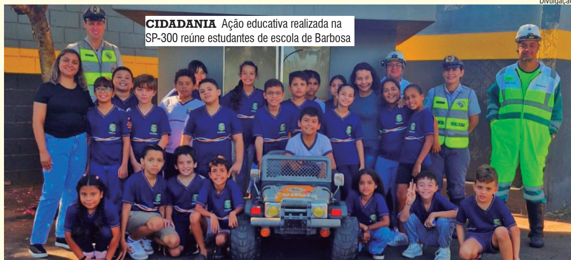
CIDADANIA Ação educativa realizada na SP-300 reúne estudantes de escola de Barbosa