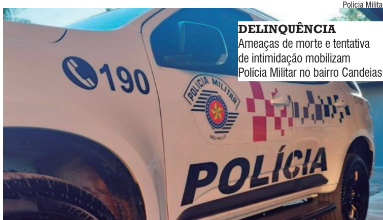
DELINQUÊNCIA Ameaças de morte e tentativa de intimidação mobilizam Polícia Militar no bairro Candeias

Apesar de não ter sido agredida fisicamente naquele momento,