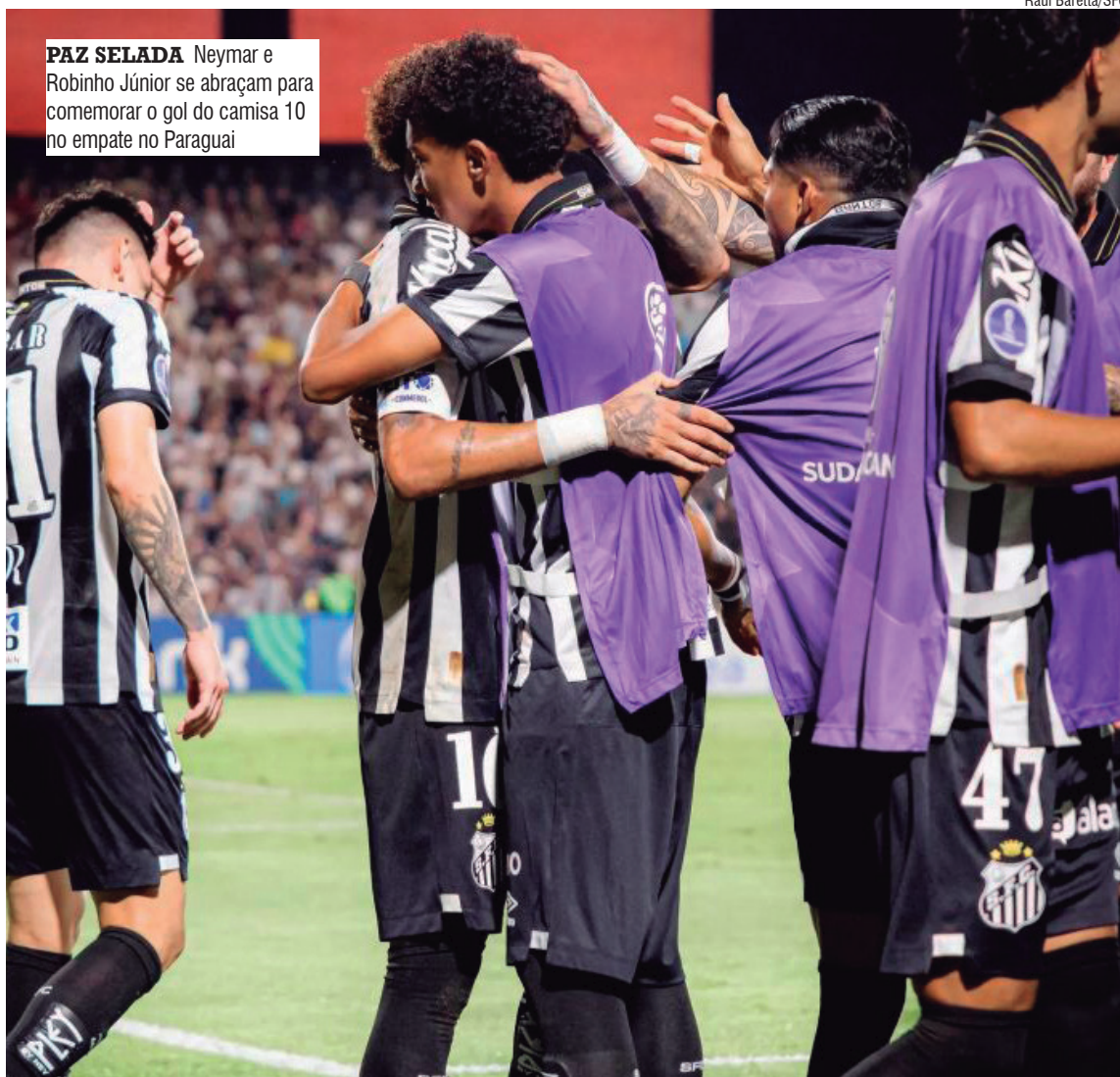
PAZ SELADA Neymar e Robinho Júnior se abraçam para comemorar o gol do camisa 10 no empate no Paraguai

“Foi um desentendimento que tivemos no treino, uma reação que eu tive e realmente me excedi um pouco. Mas logo após o ocorrido, pedi desculpas, conversamos no vestiário, nos entendemos ali. É um me-