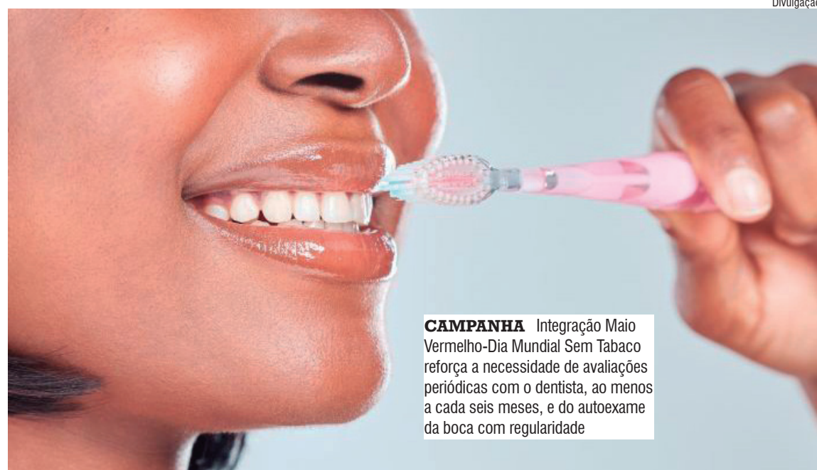
CAMPANHA Integração Maio Vermelho-Dia Mundial Sem Tabaco reforça a necessidade de avaliações periódicas com o dentista, ao menos a cada seis meses, e do autoexame da boca com regularidade

Para quem tem implantes dentários, os cuidados preventivos são os mesmos, mas o acompanhamento profissional ganha