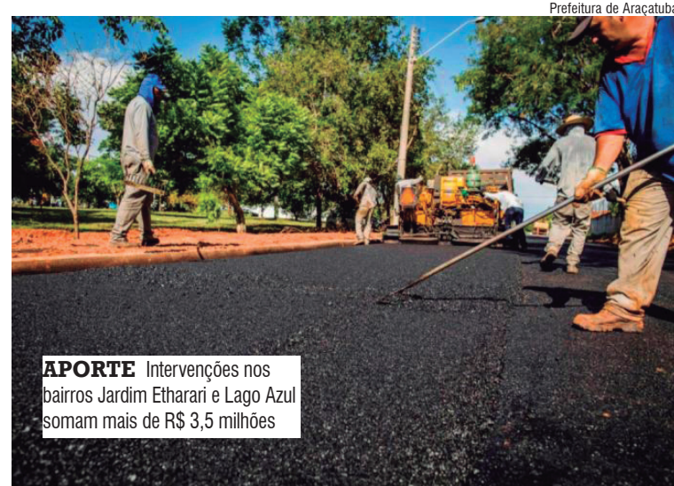
Prefeitura de Araçatuba

A primeira etapa contempla a execução das obras de drenagem, com processo licitatório já aberto e valor estimado em R$ 1.824.807,96. Desse montante, R$ 990 mil são oriundos do Fundo Estadual de Recursos Hídricos (Fehidro), enquanto R$ 834.807,96 correspondem à contrapartida do