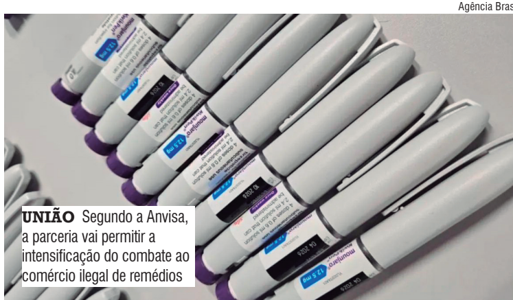
UNIÃO Segundo a Anvisa, a parceria vai permitir a intensificação do combate ao comércio ilegal de remédios

Segundo ele, a cooperação consolida um modelo já testado