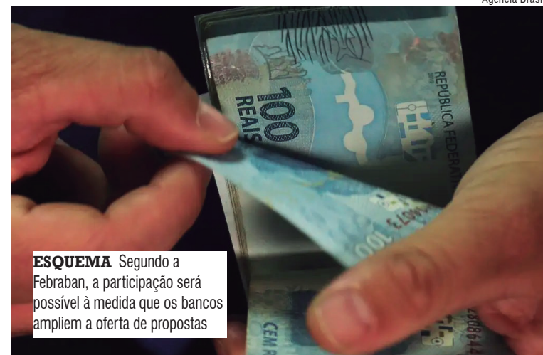
ESQUEMA Segundo a Febraban, a participação será possível à medida que os bancos ampliem a oferta de propostas

Com o sistema do FGO em funcionamento, os bancos passam a registrar as operações dentro do programa, o que ga-