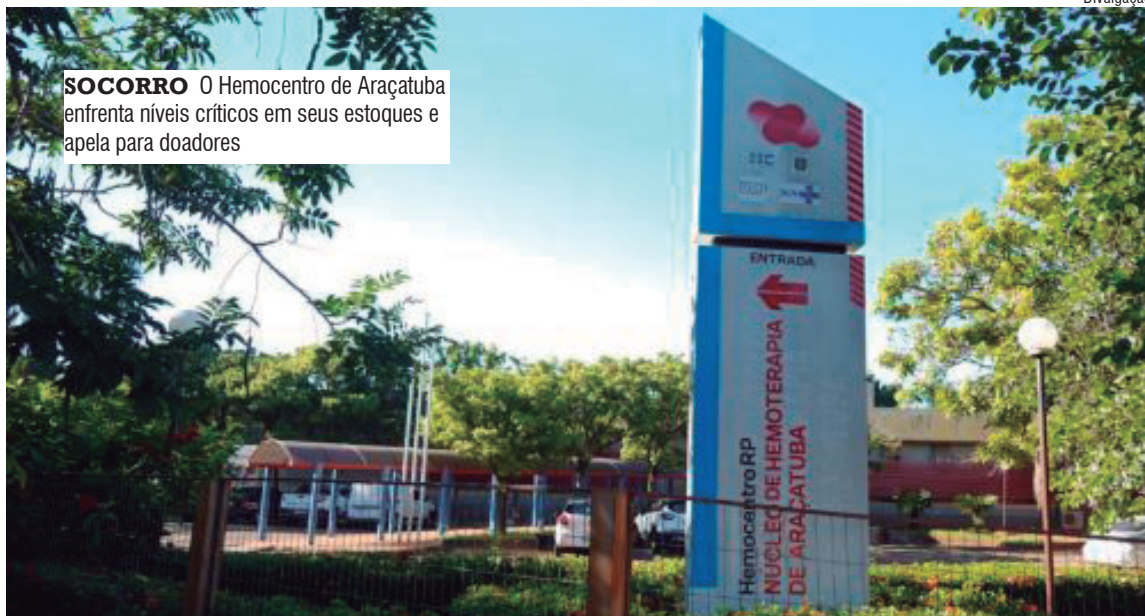
SOCORRO O Hemocentro de Araçatuba enfrenta níveis críticos em seus estoques e apela para doadores