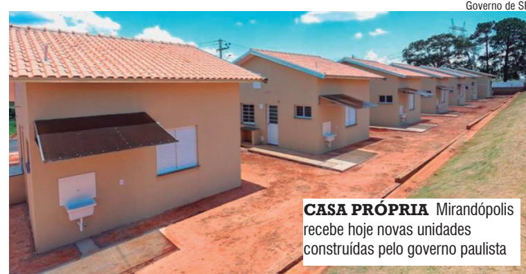
CASA PRÓPRIA Mirandópolis recebe hoje novas unidades construídas pelo governo paulista

As famílias inscritas devem observar datas, horários e locais definidos em edital para partici-