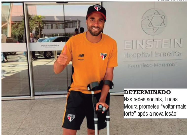
DETERMINADO Nas redes sociais, Lucas Moura prometeu “voltar mais forte” após a nova lesão

No entanto, antes mesmo do embarque, o avião que levaria a equipe apresentou falhas técnicas, impossibilitando a viagem. Com isso, a diretoria optou por modifi-