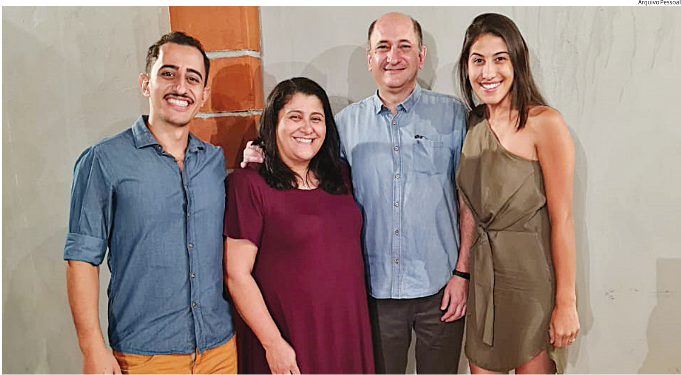
A família Carrion perdeu o patriarca em agosto de 2024, aos 50 anos, vítima de um infarto