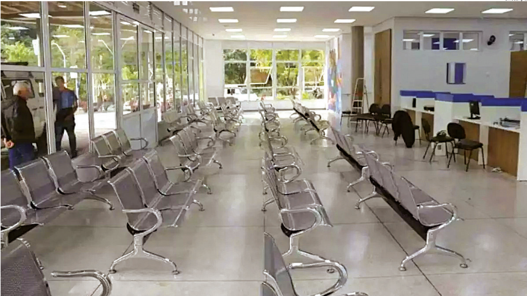
A interrupção ocorreu em 30 de abril e, até o momento, não houve avanço no processo nem posicionamento da prefeitura