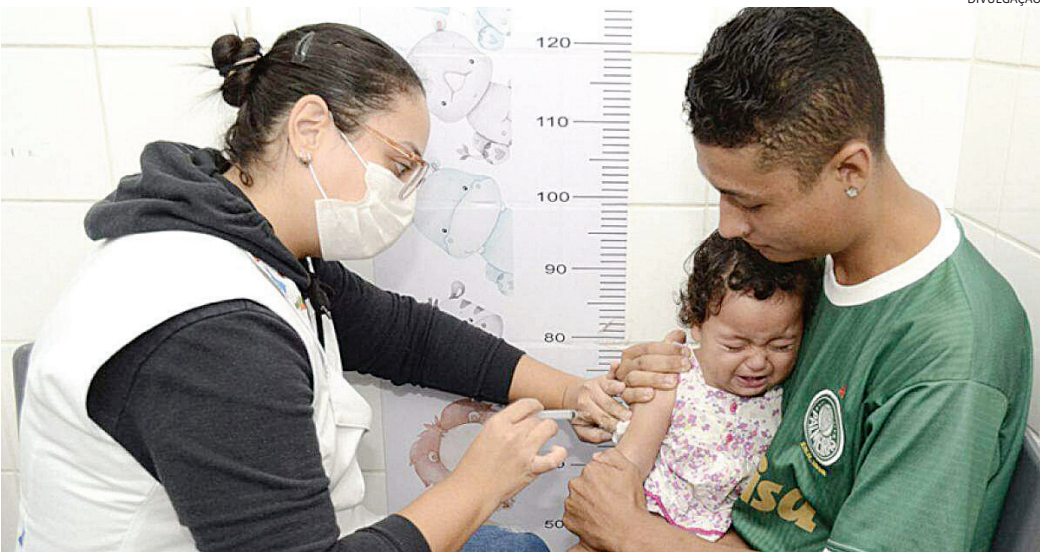
Mais de 650 doses foram aplicadas em ação que reforça a importância da imunização e da prevenção coletiva