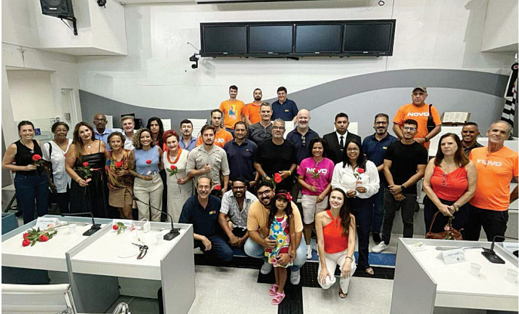
Diretório se reuniu em março para eleger presidente municipal mas agora está destituído

Biondi fez questão de lembrar que são 10 anos de ação do Novo em Jundiaí, com um grupo de cerca de 200 filiados atuantes e com propostas para ampliar o trabalho na cidade. “A eleição para a presidência do diretório municipal foi em maio.