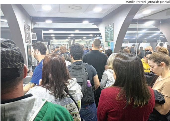
Público ficou ‘preso’ na entrada do Plenário

A Comissão de Constituição e Justiça (CCJ) do Senado pode votar nesta quarta-feira (14) a proposta de emenda à Constituição que acaba com a reeleição para presidente da República, governadores e prefeitos. Agendada para a última quarta (7), a votação da PEC 12/2022 foi adiada após