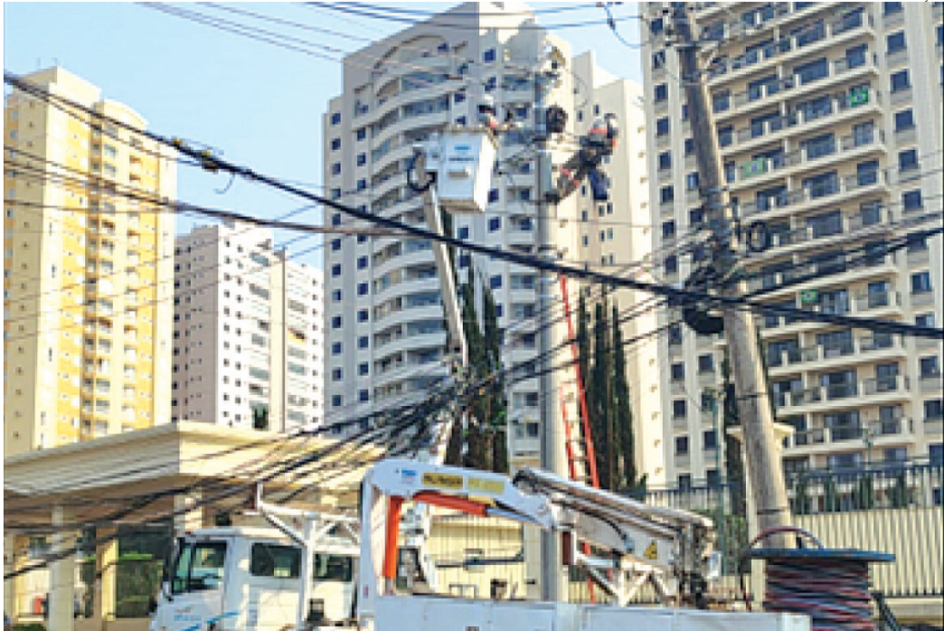
Equipe da CPFL reconstrói a rede após colisão de veículo contra poste

Das ocorrências envolvendo veículos, as colisões contra postes têm mais impacto para a população, pois geralmente exigem re-