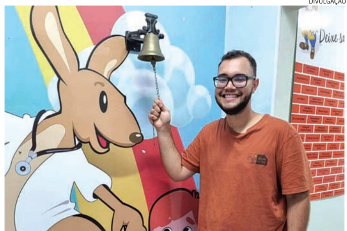
“Desde que entrei no Grendacc senti que não estava doente”, disse.