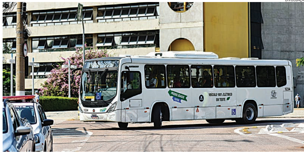
Novo contrato de concessão prevê renovação da frota e monitoramento da operação

O novo marco também abre espaço para discussões sobre integração regional do transporte. Entre as possibilidades está a criação de estruturas de gestão compartilhada entre municípios, o que pode facilitar, no futuro, a integração tarifária entre cidades da Região Metropolitana de Jundiaí e a conexão entre diferentes modais, como ônibus e trem. Além disso, a legislação estabelece metas para a redução gradual do uso de combustíveis fósseis e incentiva a adoção de soluções mais sustentáveis para o transporte público.