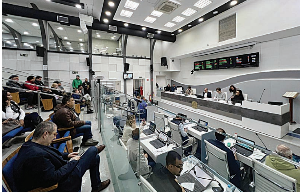
Vereadores votaram emenda ao projeto do Executivo, considerada ilegal

O ponto de divergência está na emenda incluída pela Câmara, que previa