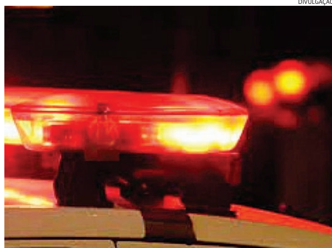
Os GMs detiveram duas pessoas na festa

Durante a ação, os guardas abordaram diversas pessoas e detiveram dois