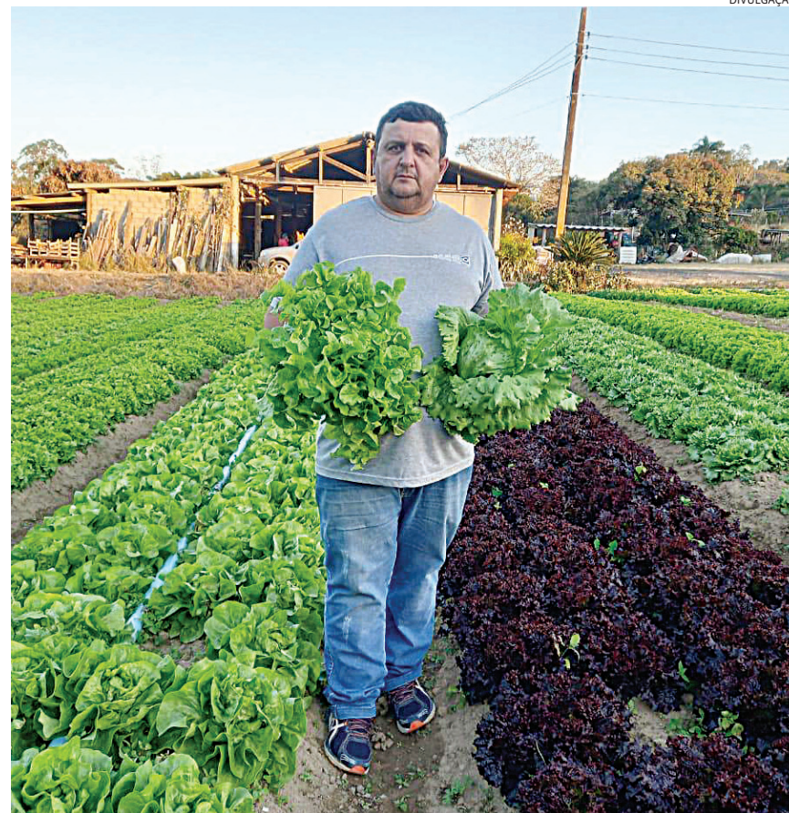
Com mais oferta no mercado e menor procura o preço das hortaliças tendem a cair

ver bem. Neste inverno, as temperaturas na região têm ficado dentro do esperado para a época, sem frio extremo o suficiente para preocupar.