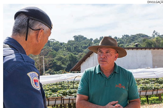
A ronda atua em regiões onde há atividade agrícola

Na área agrícola de Jundiaí, a maioria das ocorrências é de furtos de cabos de energia e de internet e de ferramentas das propriedades, conforme relatos dos moradores. “Nossos bairros rurais, que ficam mais afastados do Centro, estão bem mais seguros com a Ronda. O bom atendimento dos guar-