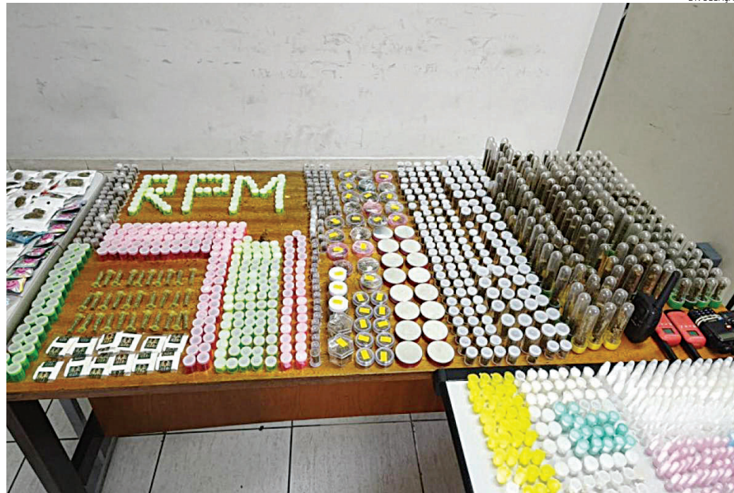
As drogas foram apreendidas e o caso será investigado

Os policiais realizavam patrulhamento pela rua Tambaú quando avistaram dois homens em atitude suspeita. Ao perceberem a aproximação da equipe, ambos correram em direções diferentes. Um deles foi alcançado e detido. Durante a abordagem, o suspeito admitiu atuar como "olheiro" para traficantes, monitorando a movimentação policial e repassando informações ao grupo criminoso.