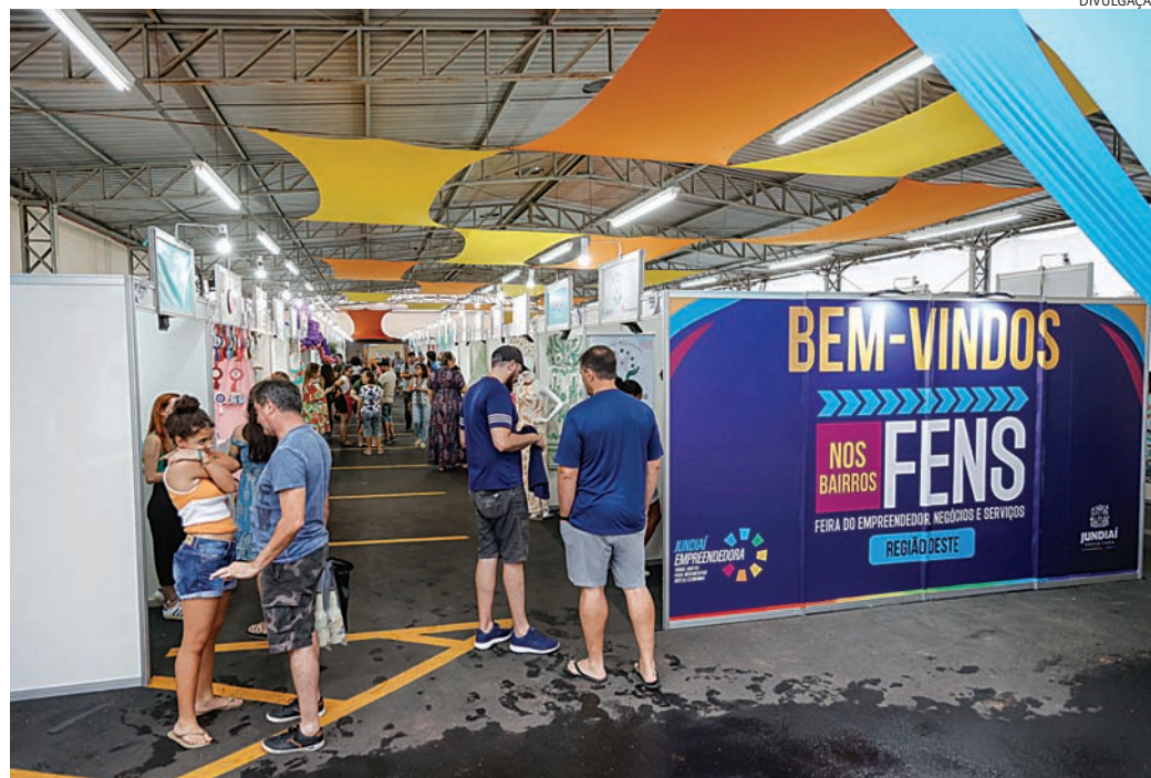
Poderão participar empresas sediadas e cadastradas em Jundiaí

As inscrições deverão ser feitas por meio de formulário dentro do site – negocios.jundiai.sp.gov.br – entre quarta-feira, 24 de junho, a partir das 9h, até