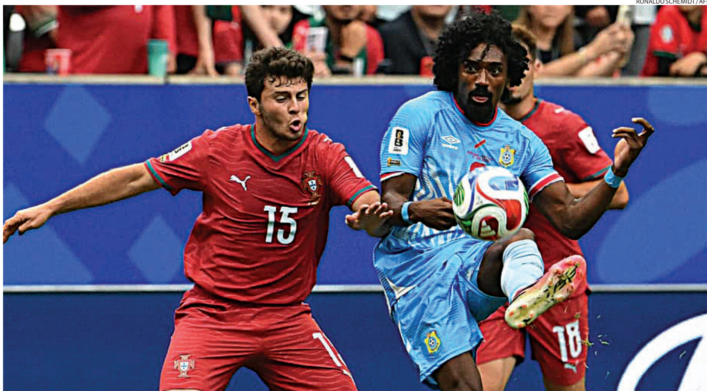
Na estreia, os portugueses ficaram no empate por 1 a 1 com a República Democrática do Congo

A terceira rodada do Grupo L será disputada no próximo sábado (27). A Inglaterra enfrentará o Panamá, enquanto Gana terá pela frente a Croácia na definição dos classificados da chave.