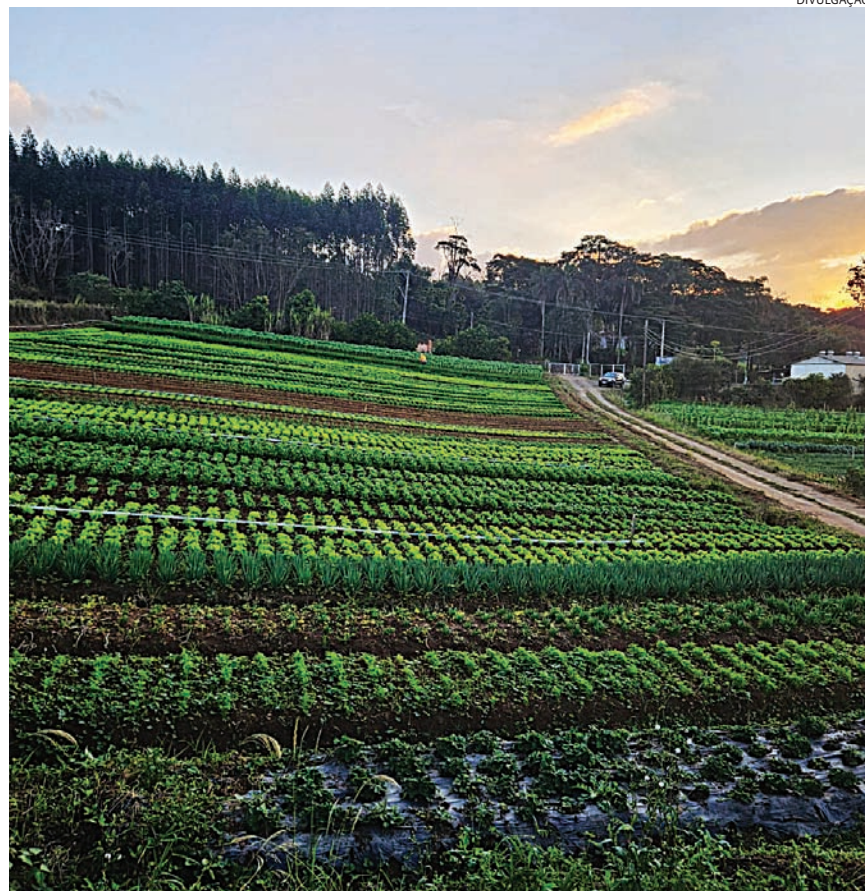
Já frutas mais sensíveis ao frio, como goiaba, maracujá e pitaya, pedem atenção constante

Jundiaí é referência na produção de uva, caqui e pêssego, frutas conhecidas justamente como “de clima temperado” porque dependem do frio para se desenvol-