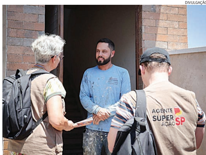
As famílias recebem acompanhamento nos serviços socioassistenciais

Jundiaí já atua na Trilha de Superação da Pobreza e agora inicia esta nova etapa de Proteção Social que prevê o atendimento de 476 famílias. A Trilha de Proteção Social tem como público famílias com renda per capita de até R$ 218 mensais que vivenciam situações de extrema vulnerabilidade, como ausência de adultos em idade ativa no núcleo familiar, dedicação integral ao cuidado de terceiros situação de rua; ou não recebi-