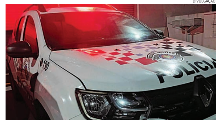
De acordo com a PM, o motociclista morreu no hospital

O motorista afirmou que parou, mas passou a ser hostilizado por populares e outros motociclistas que presen-