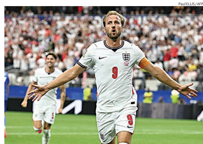
Ingleses tentam confirmar classificação no Grupo L da competição